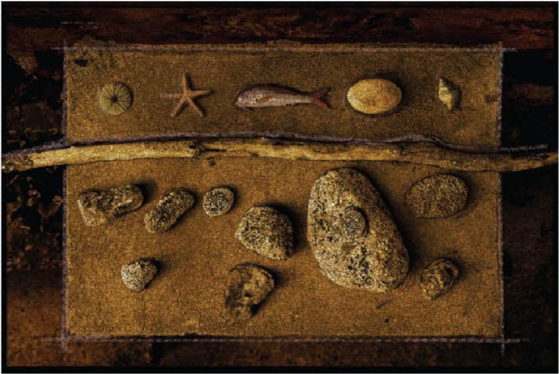
ENERGETIC PATTERN - S-5319