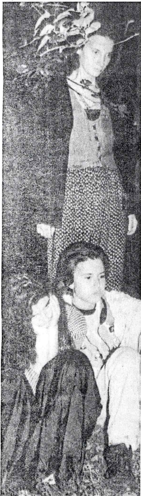
Зрителки медитират пред огнената жарава под открито небе

30-ина ценители на необичайни зрелища се сбраха в полите на Витоша в съботната нощ, за да гонят демони.