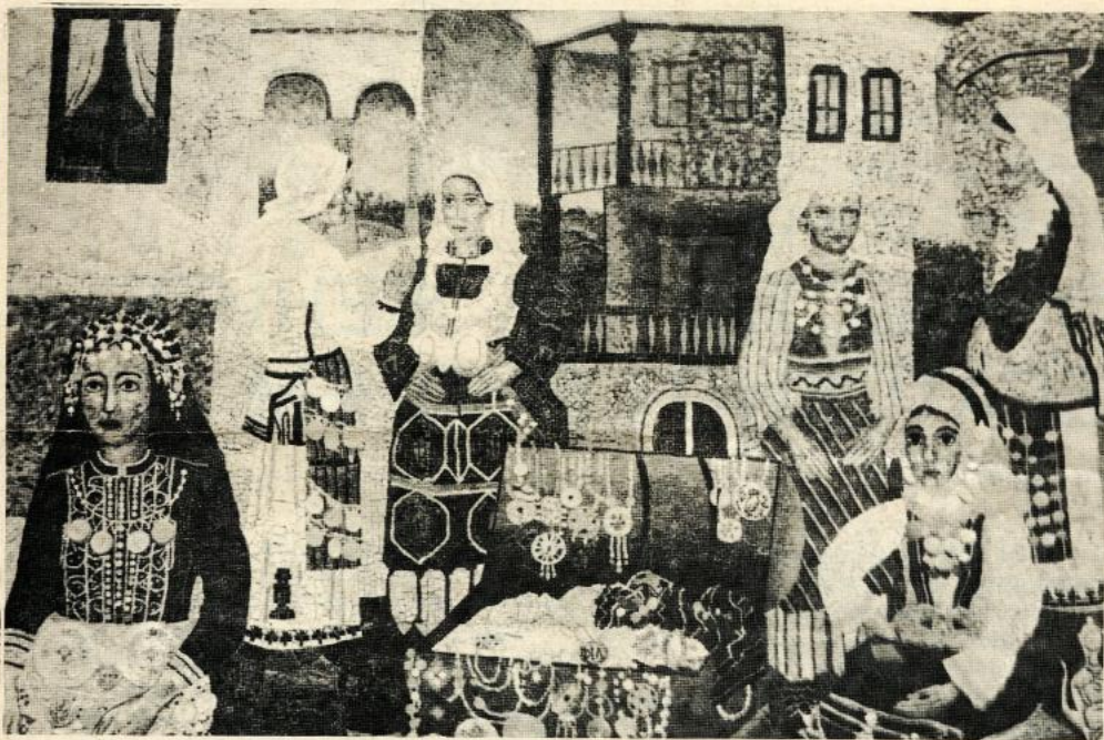
МОЗАИКОТ ВО СТОПАНСКАТА БАНКА — СКОПЈЕ