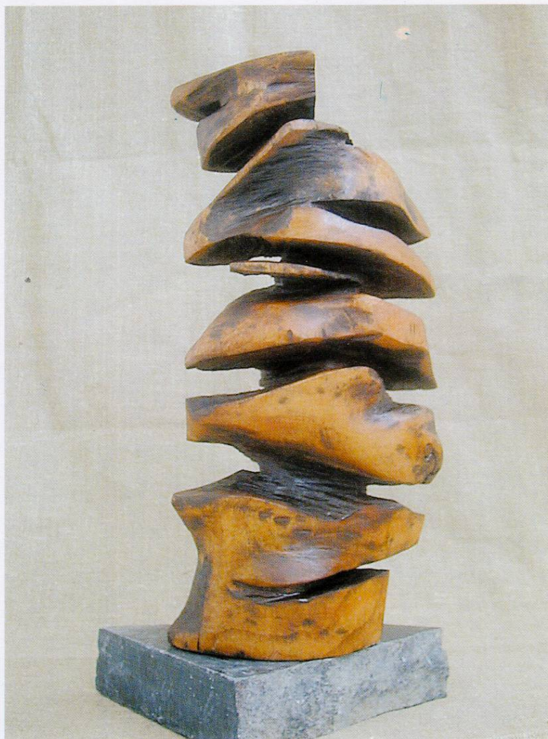
ОГНЕНА ФУРКА II 54x24x15, дрво, 2002