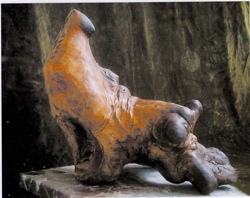
АПСАРИС 44x47x35, дрво, 2003