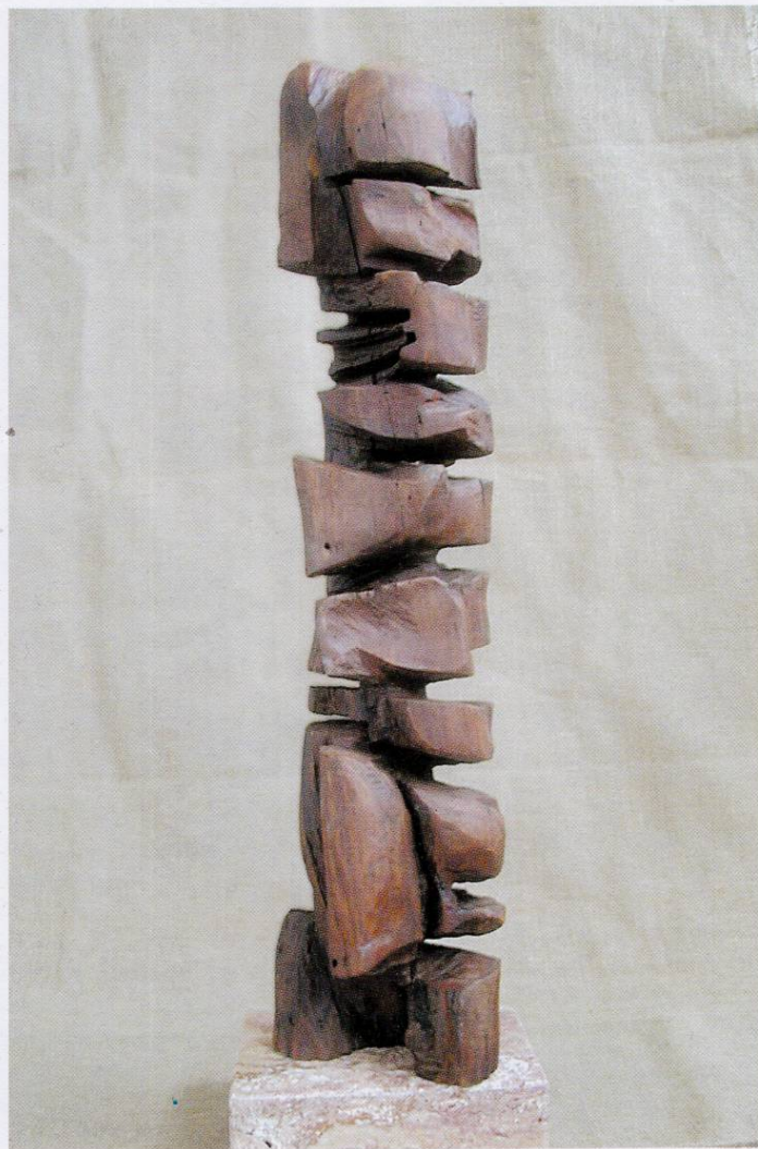
ТОТЕМ ВО ДВИЖЕЊЕ 83x19x17, дрво, 2001