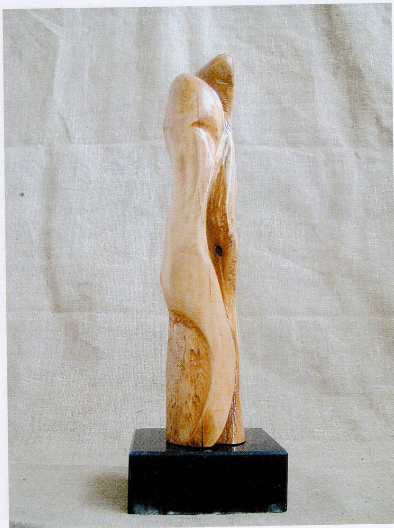
ПРЕГРАТКА 53x9,50x10, дрво, 2003