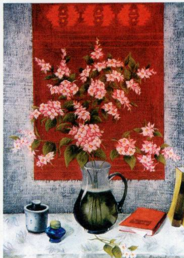
Ацо Апостоловски - награда за сликарство од Домот на културата "Кочо Рацин" Скопје