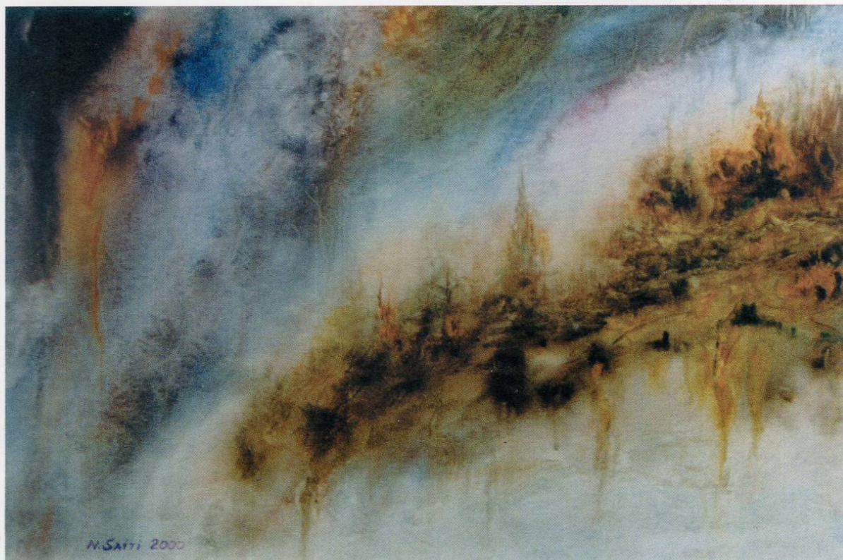
Неждет Саити - Цети - награда за техника акварел - од КИЦ