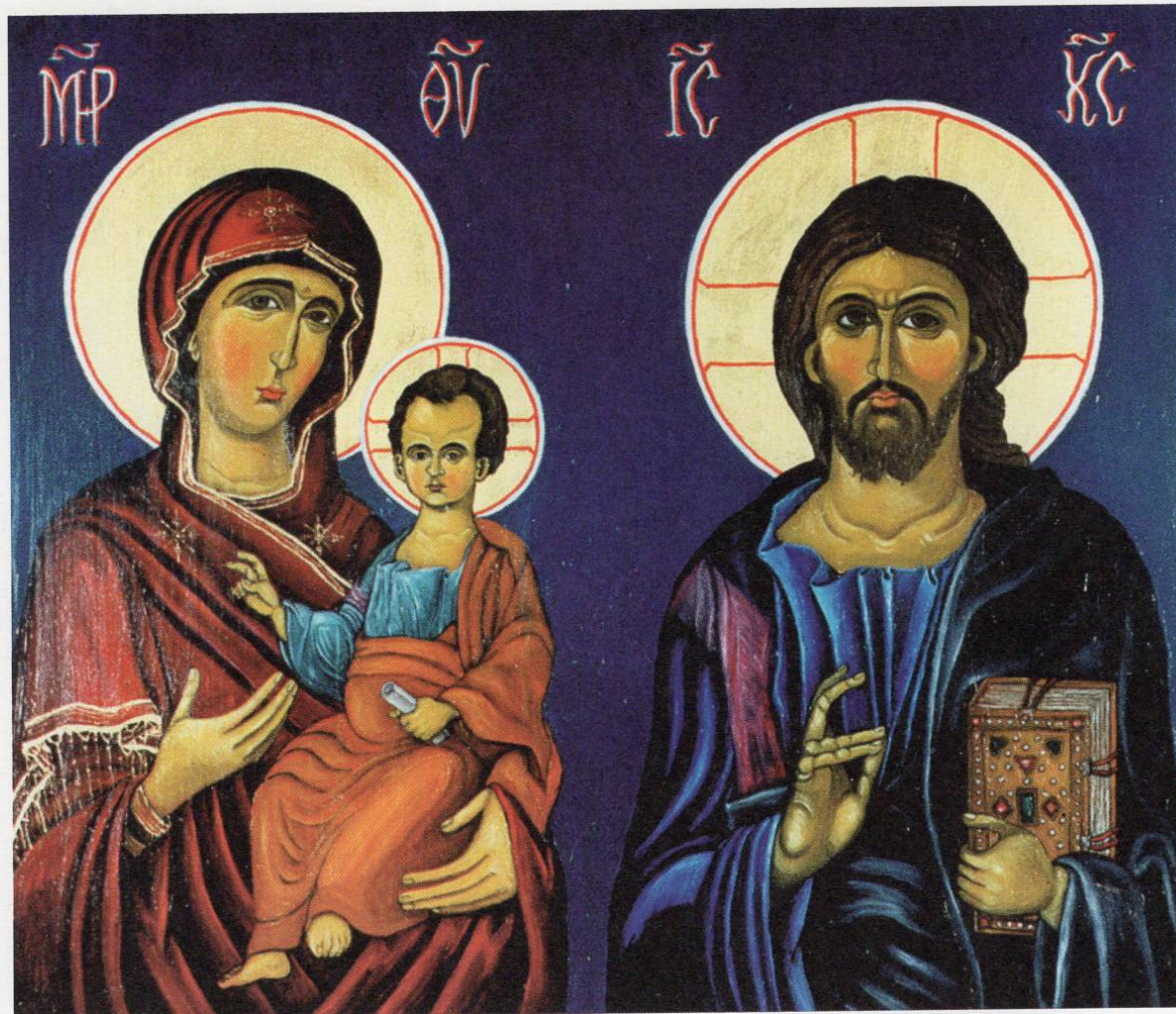
Лазо Младеновски - награда за сликарство - успешна копија - од КИЦ