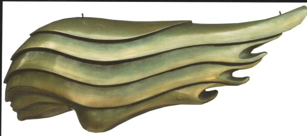
ПРОСВЕТЛЕНИЕ НА СОВРШЕНСТВОТО II (ПОЛИЕСТЕР) - 41x121x40 cm - 2009

ENLIGHTENING OF PERFECTNESS II (FIBERGLASS) - 41x121x40 cm - 2009