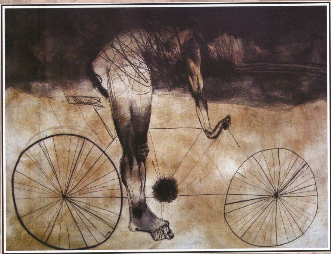
“Велосипедист” етканица, акватинта