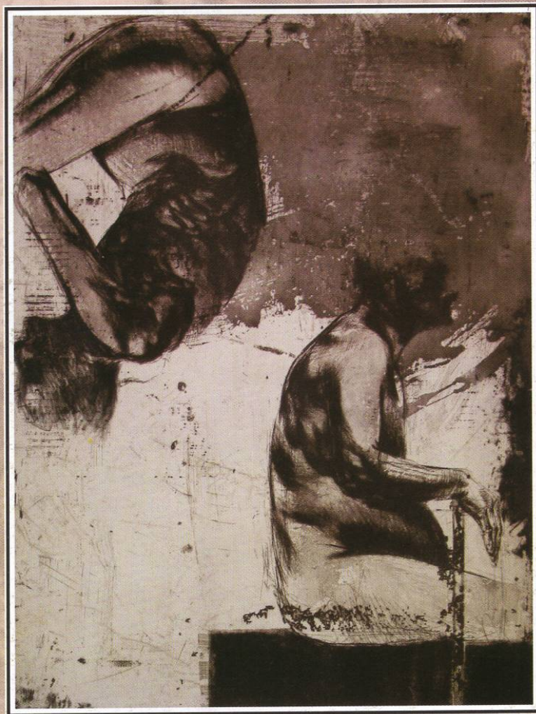
“Меланхолија” етканица, акватинта