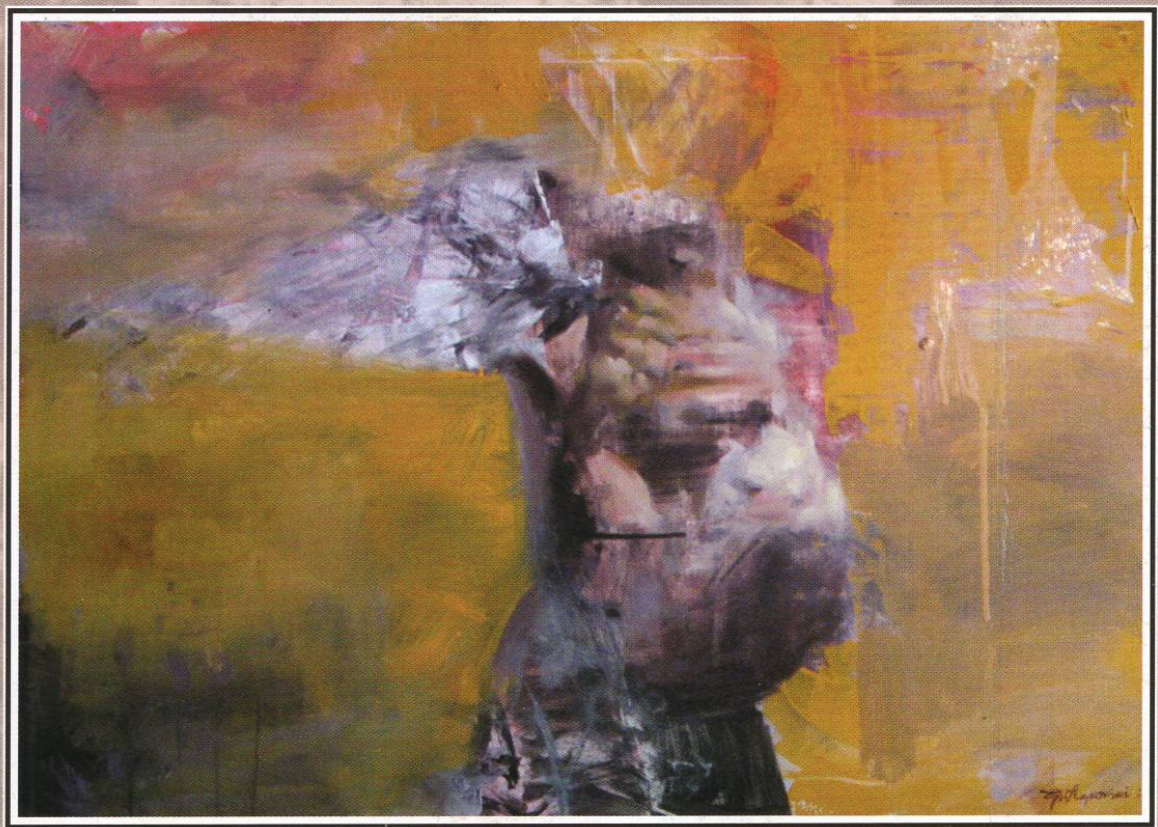
“Распната фигура” масло на платно