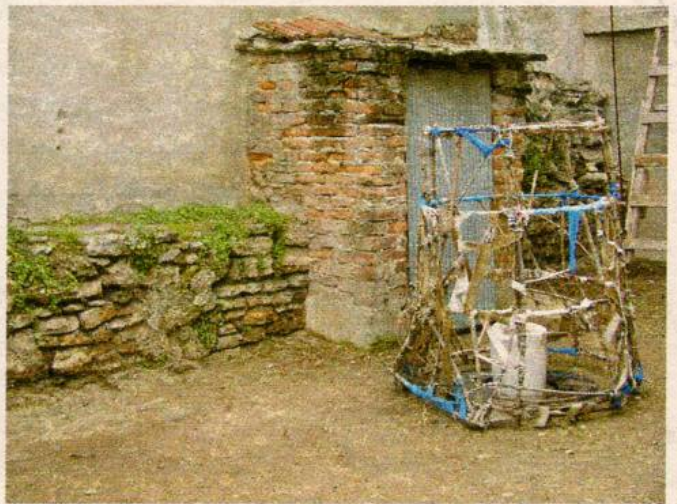
Before and After