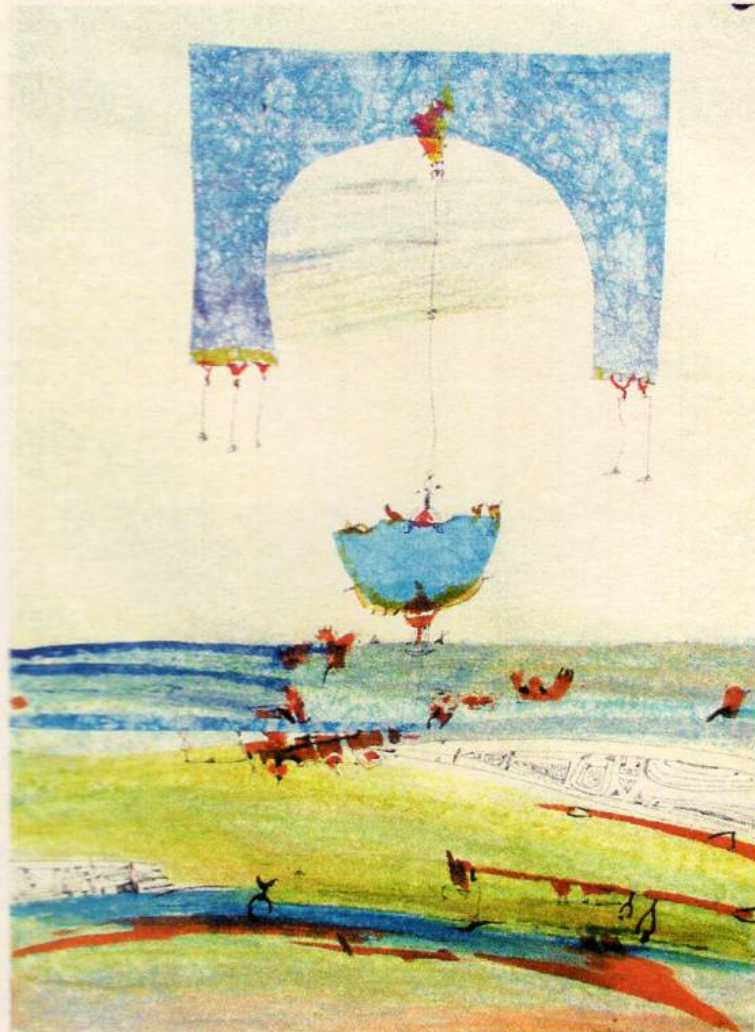
Од циклусот Порџа , 2003