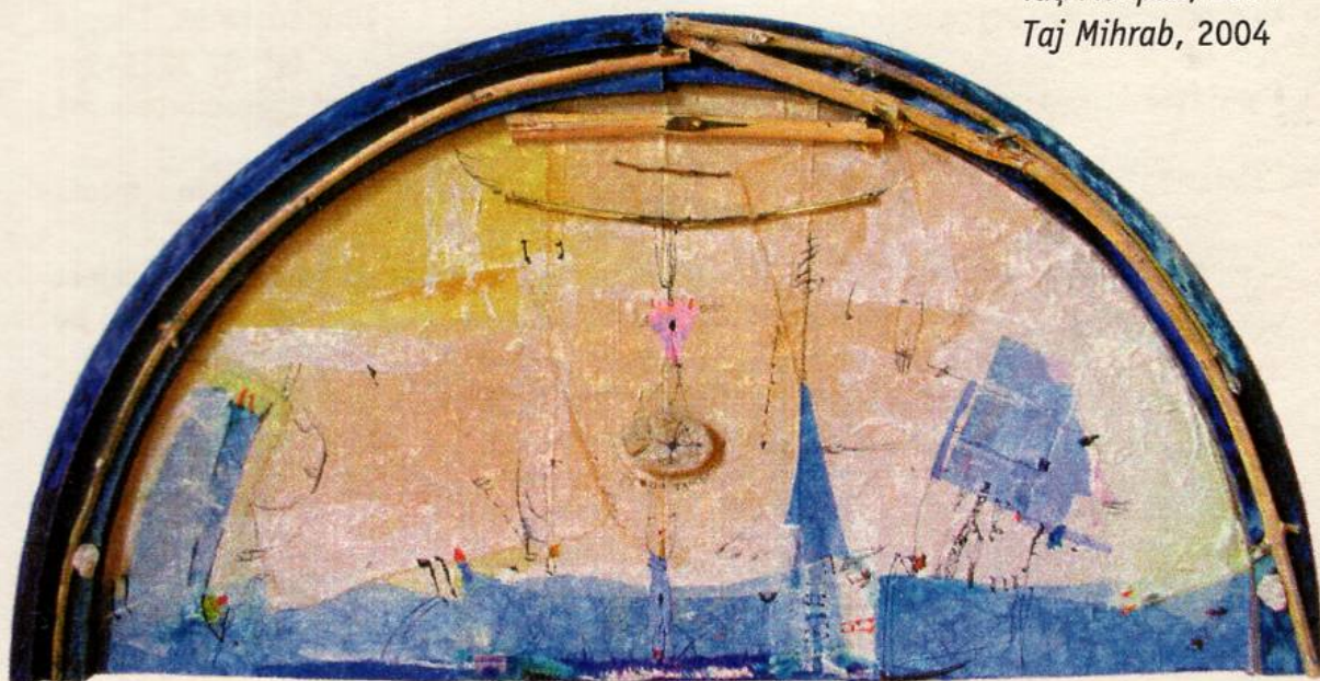
Таџ Михраб , 2004 Taj Mihrab , 2004