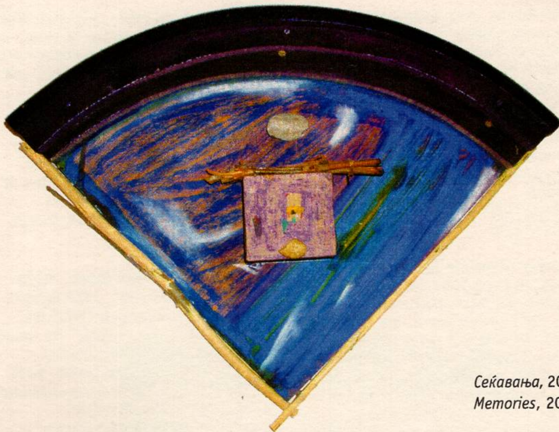
Секавања, 2003 Memories, 2003