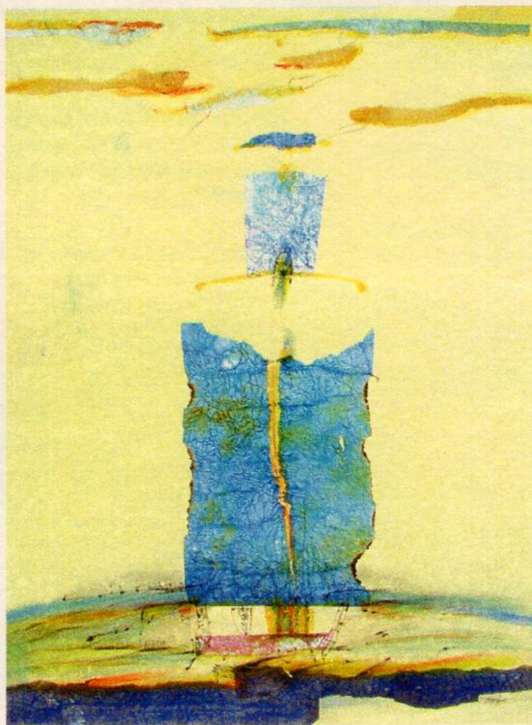
Од циклусот Птици, 2003 From the Cycle Birds, 2003