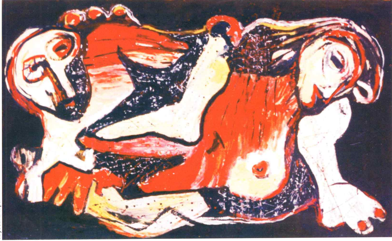
Љубовна игра III