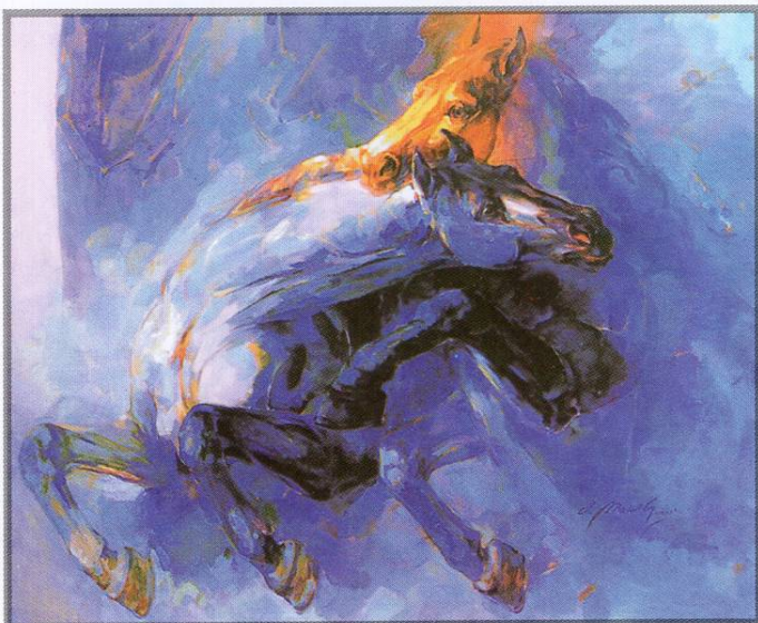
ДУЕЛ'01 - масло