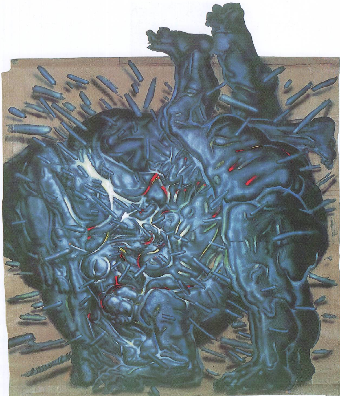
ЦРТЕЖ - СЛИКА VII акрилик