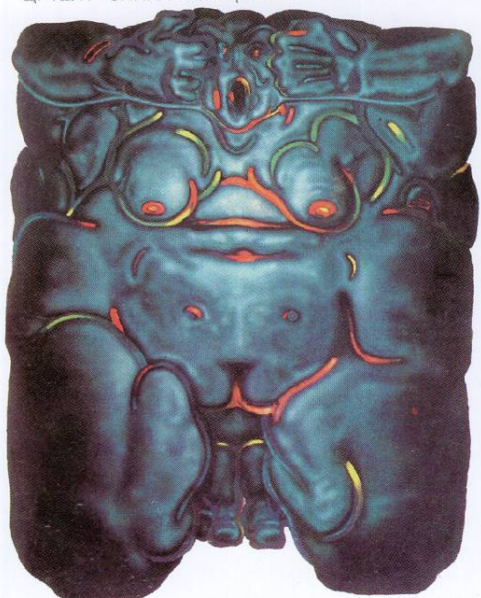
ЦРТЕЖ - СЛИКА III акрилик