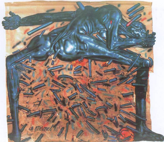
ЦРТЕЖ V акрилик