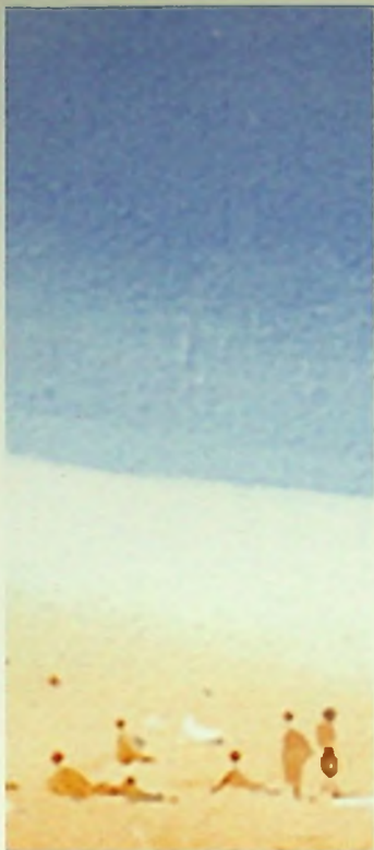
12. Поглед низ крстот View Through the Cross