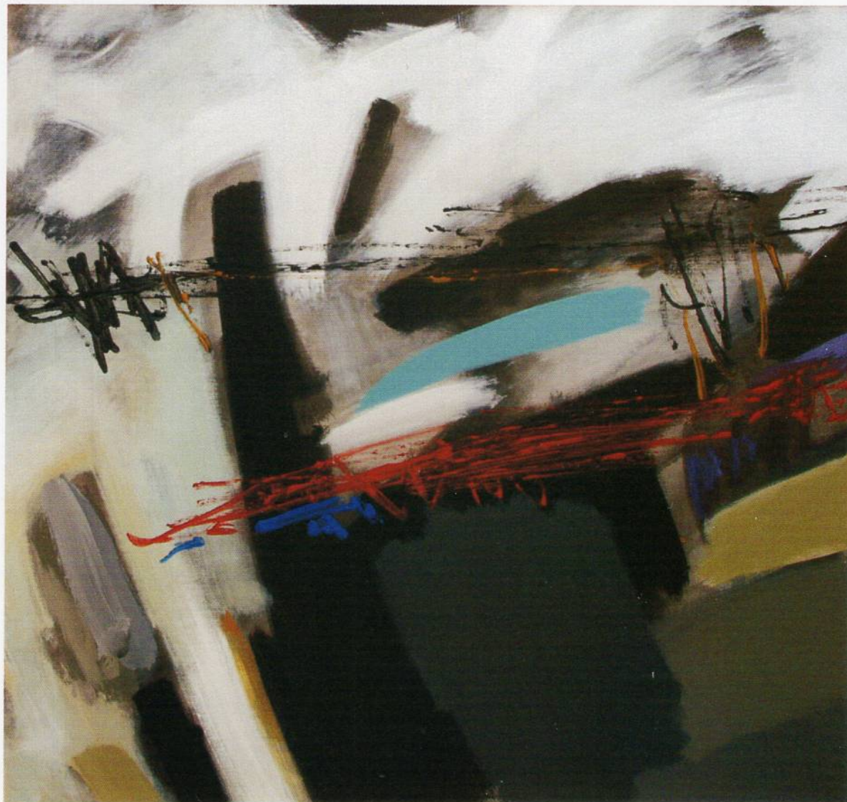
Сид 4, Акрилик на платно, 80x80 см