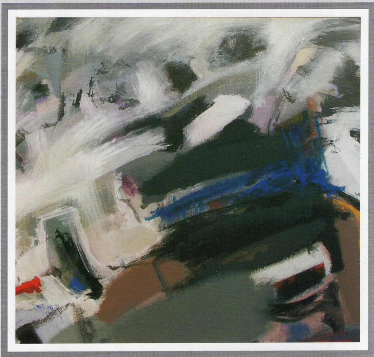
Сид 6, Акрилик на платно, 80x80 см