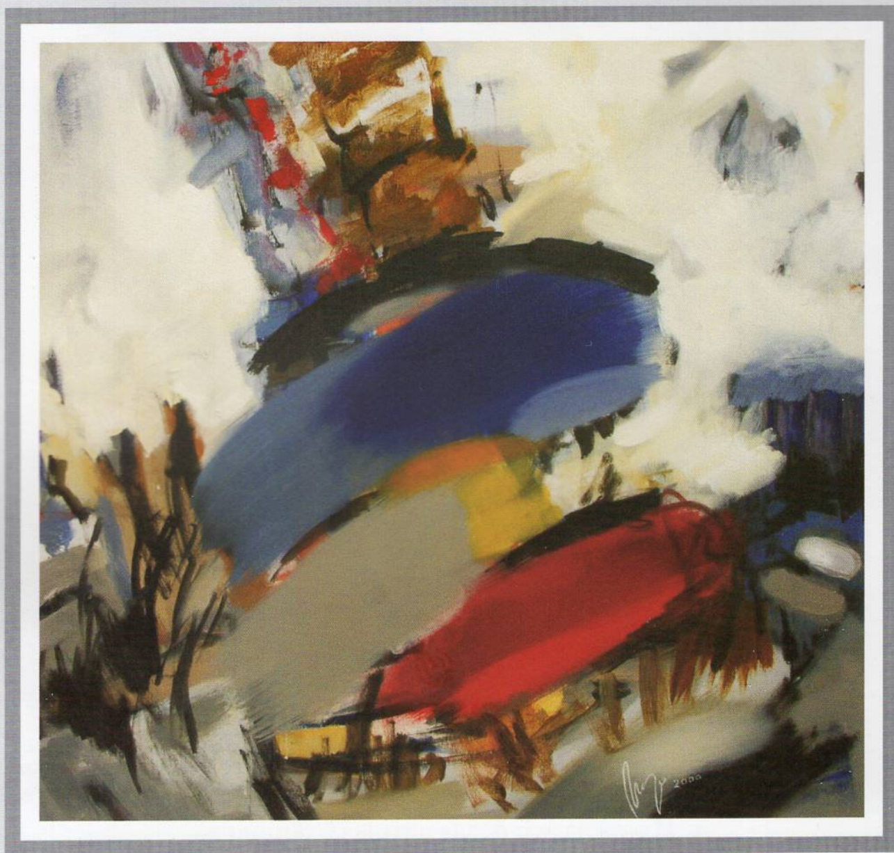
Сид 5, Масло на платно, 80x80 см