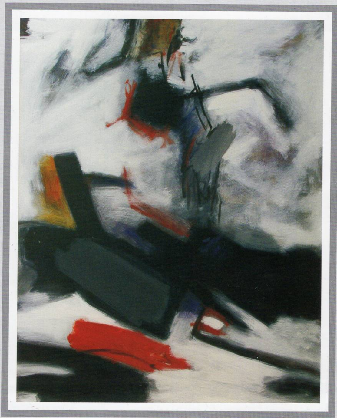
Сид 2, Акрилик на платно, 80x100 см