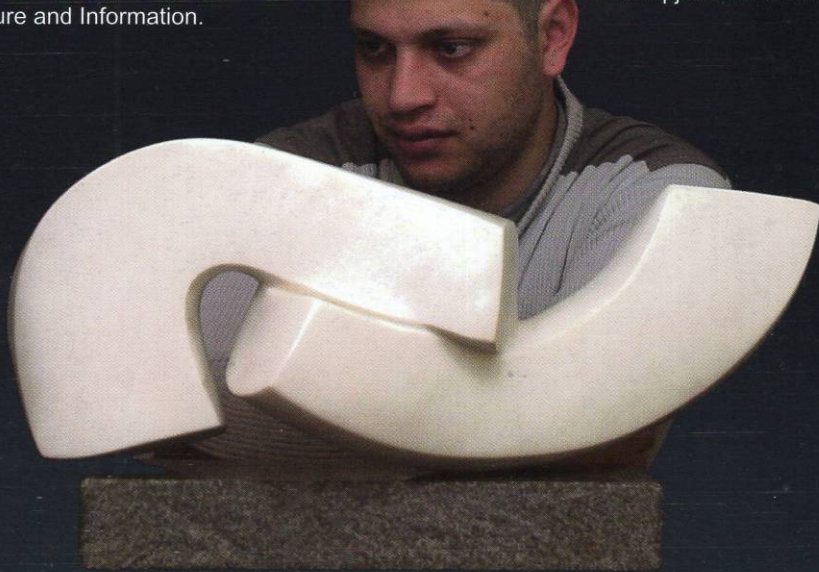
7. циклус "Архитектонски композиции" Бел мермер 28x60x27 2000