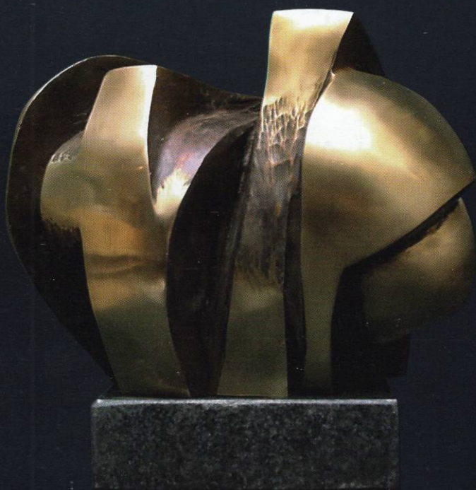
2. циклус "Архитекtonика" Бронза 32x30x24 1997