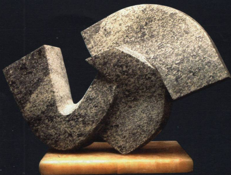
6. циклус "Архитектонски композиции" Гранит 37x52x20 2001