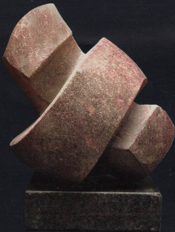
8. циклус "Архитектонски композиции" Магматски камен 31x23x22 1999