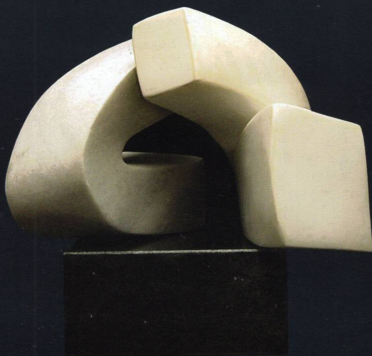
4. циклус "Архитектонски композиции" Бел и сив мермер 36x33x30 1999