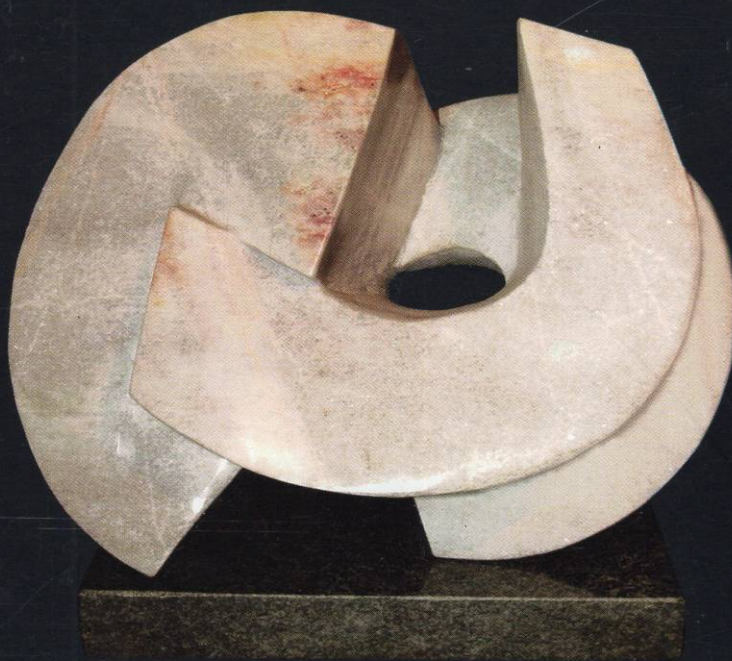
9. циклус "Архитектонски композиции" Сив мермер 45x53x28 2000

Организатор на изложбата; Завод Музеј и Галерија - Битола, Дом на Културата Глигор Прличев - Охрид Фотографија; Гоце Чочков Графичко обликување; Елена Марковачева Печат; "СОФИЈА"- Богданци Превод на Англиски јазик и предговор; Мира Дуковска Ср - Каталогизација во публикација; Народна и Универзитетска Библиотека Св. Климент Охридски - Скопје ISBN - 9989 - 802 - 44 - 0