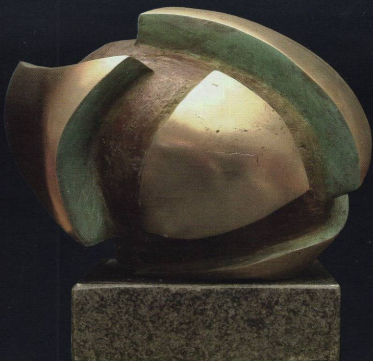
1. циклус "Архитекtonика" Бронза 28x33x20 1997