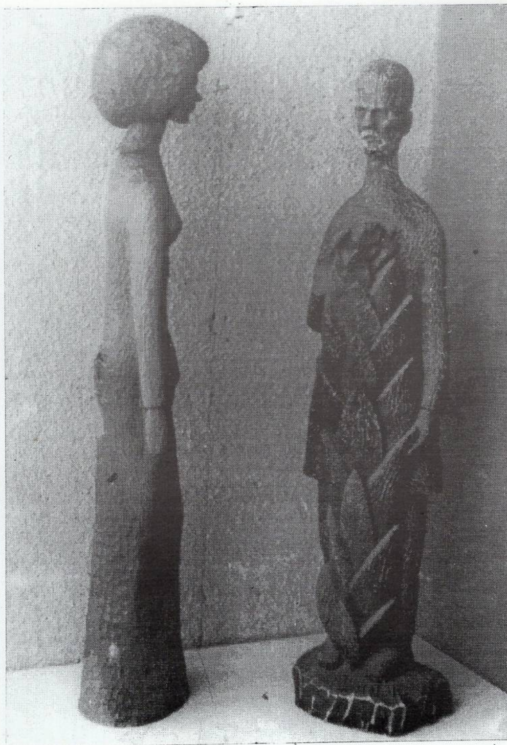
Женска фигура - дрво