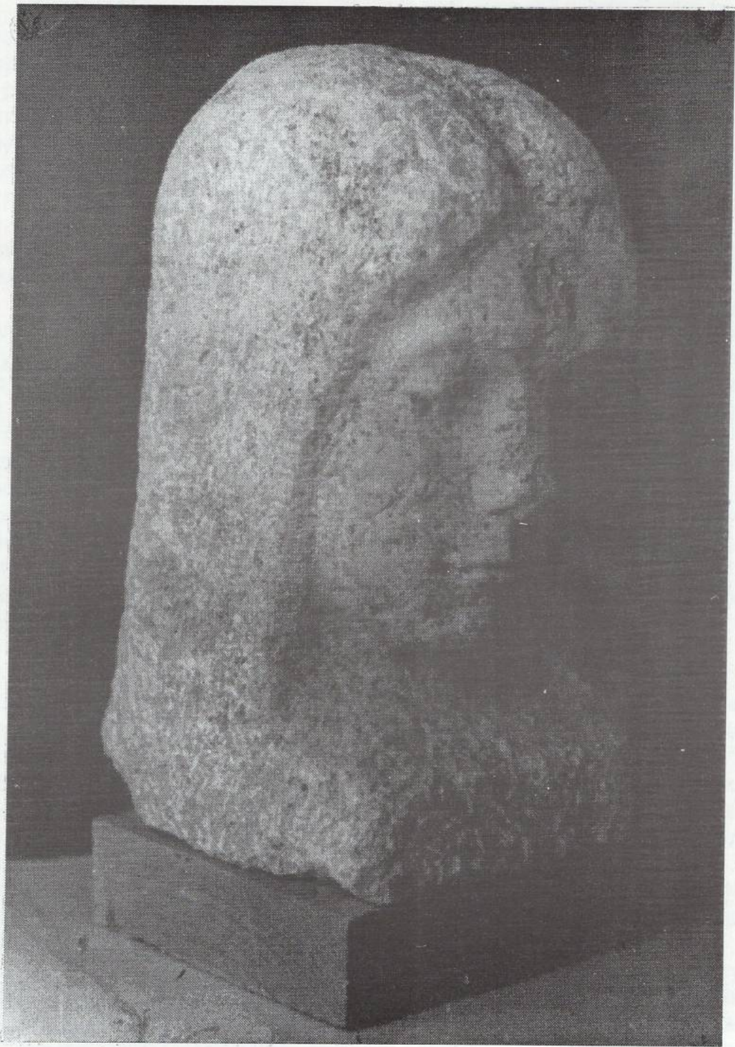
Женски портрет - травертин