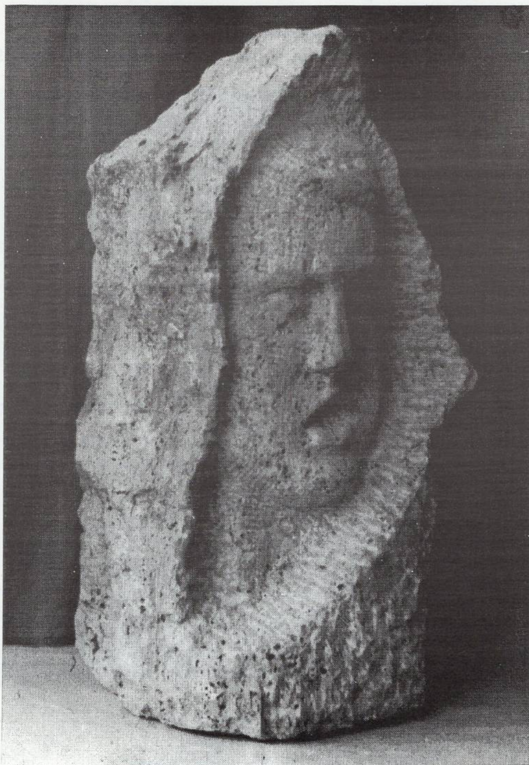
Женски портрет - травертин