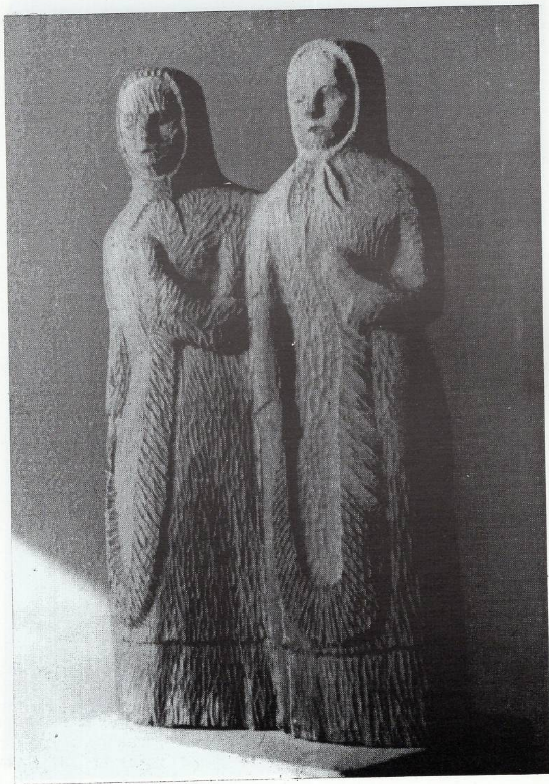
Тутунарки со низи - дрво