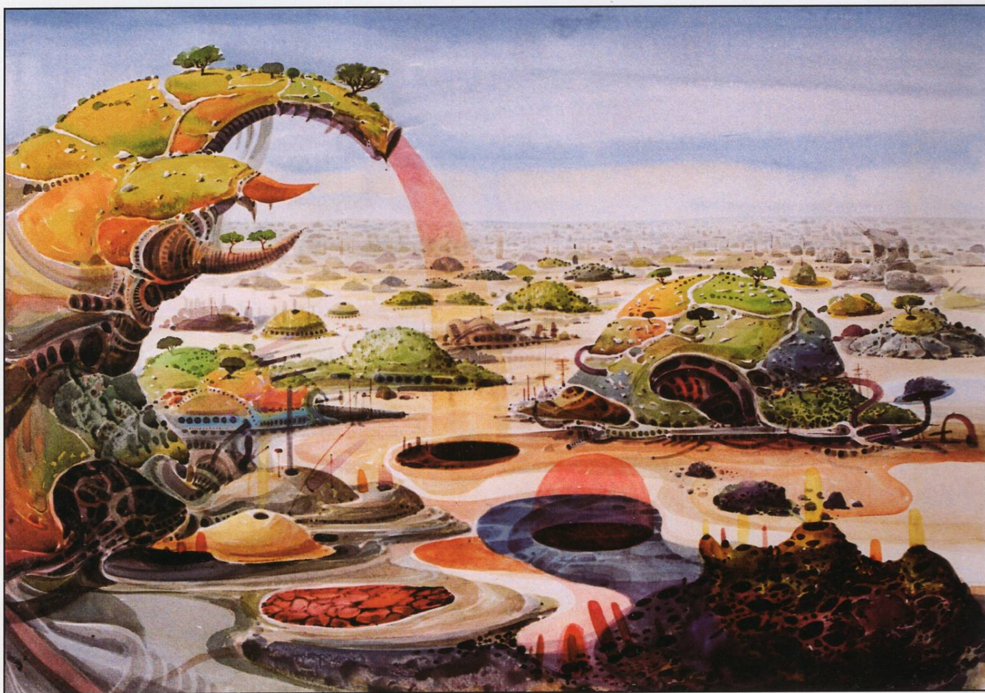
Бази – оази