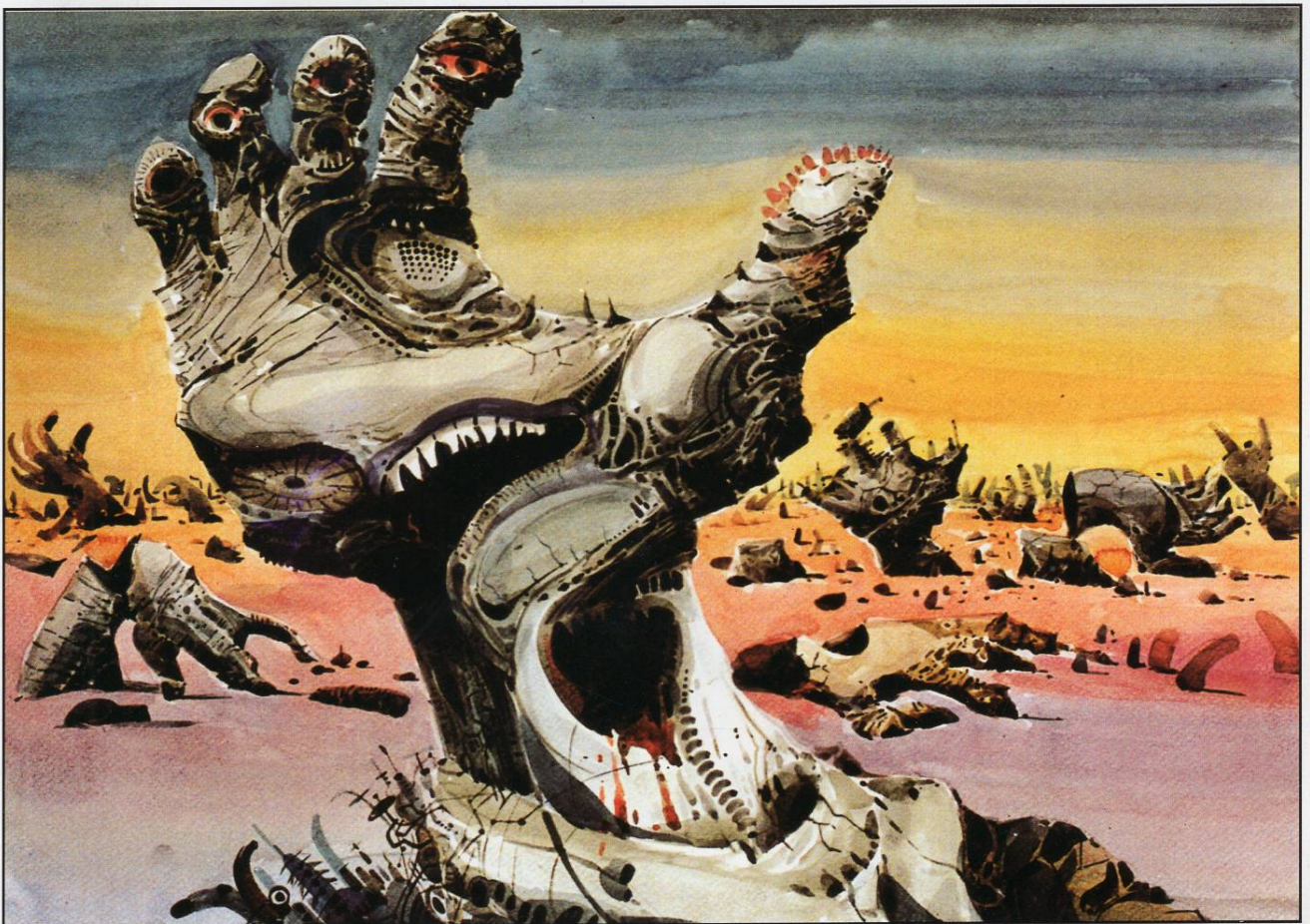
Крик од рачниој зглоб