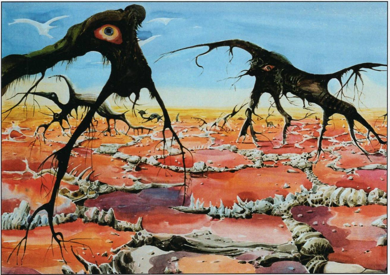
Мейморфоza на корењайи