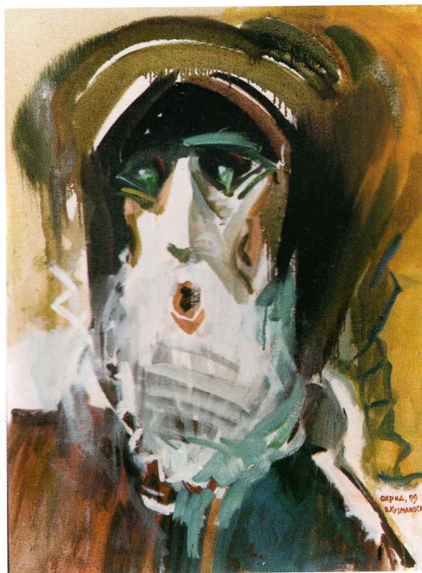
ПАВЛЕ КУЗМАНОВСКИ PAVLE KUZMANOSKI