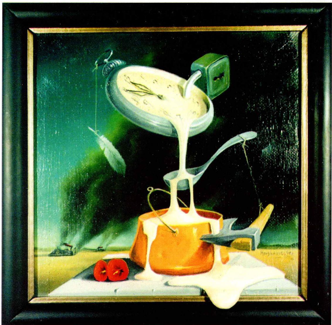
Синиша Стефановиќ Кашавалески, "Tempus Liquidum" Награда на КИЦ „Константин Мазев - Коце“