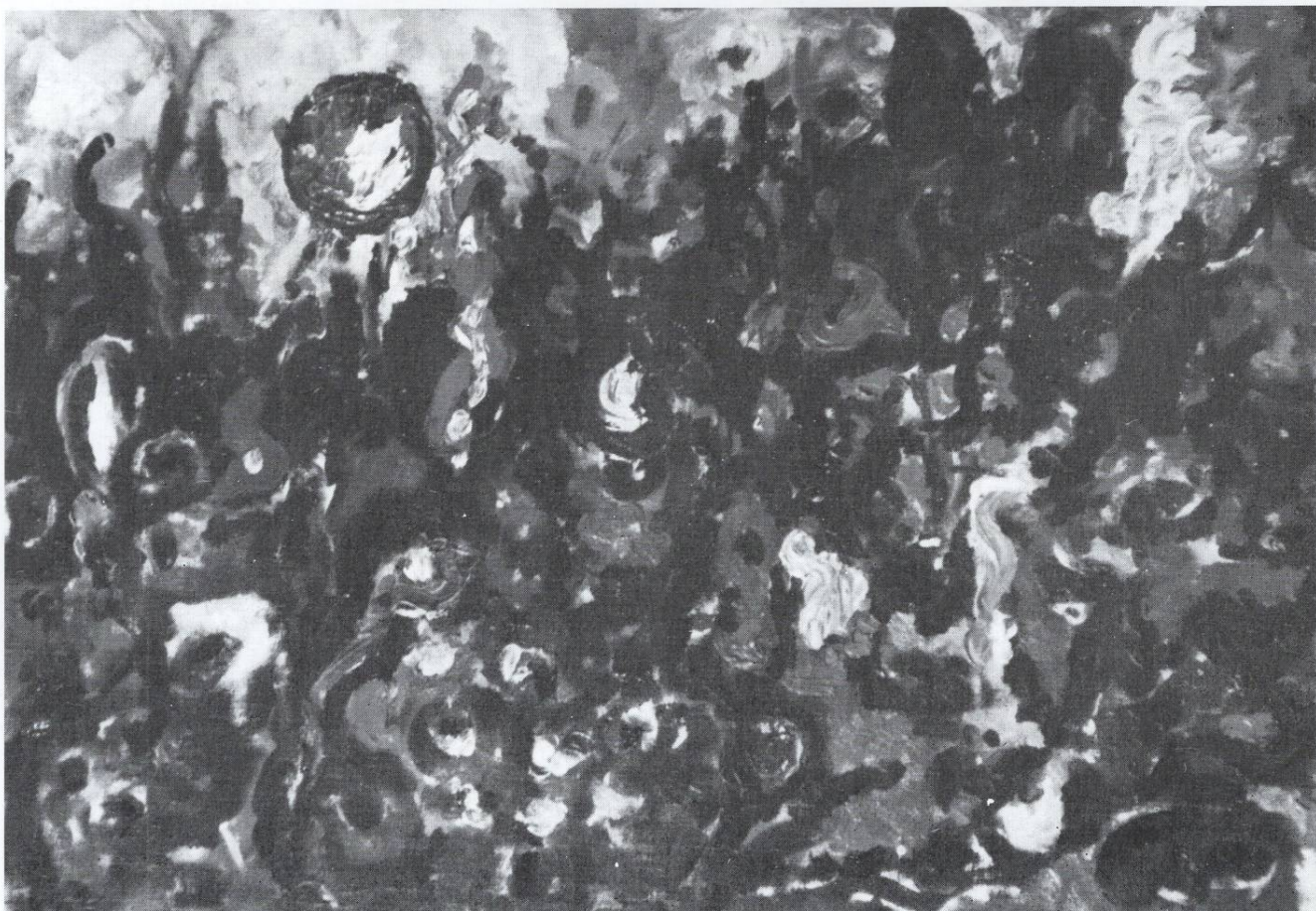
Мотив од Свети Јоаким Осоговски 1992