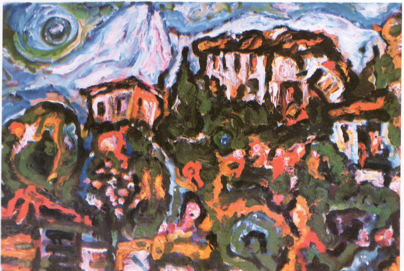
Мотив од Галичник 1992