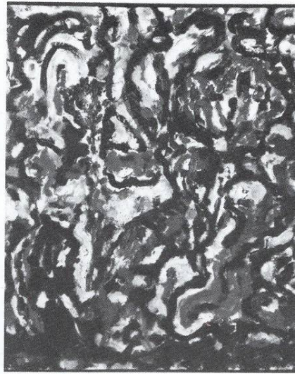
Пробив на светлината – Дојран 1992