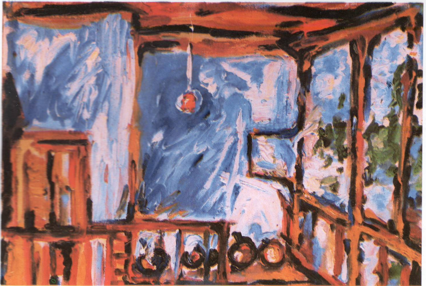
Чардах во Вељуса 1993