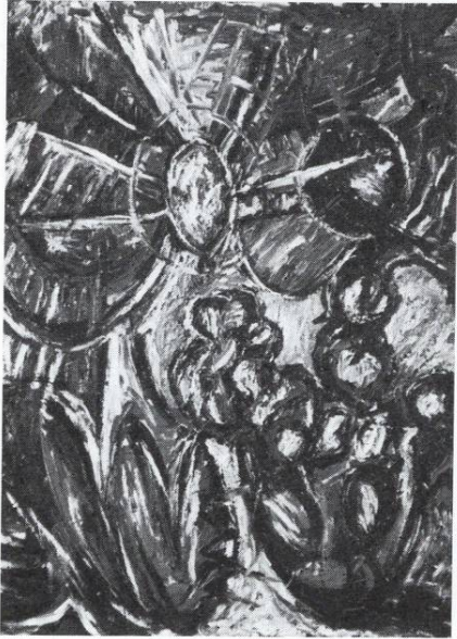
Цветови II 1994