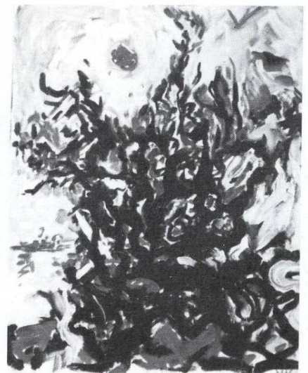
Дојранско интермецо 1992