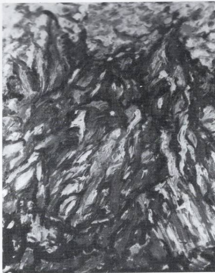
Ekspanzija vo crveno 1994