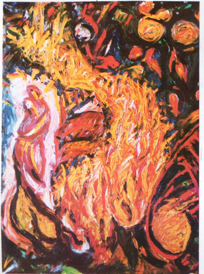
Допир на светлината 1994