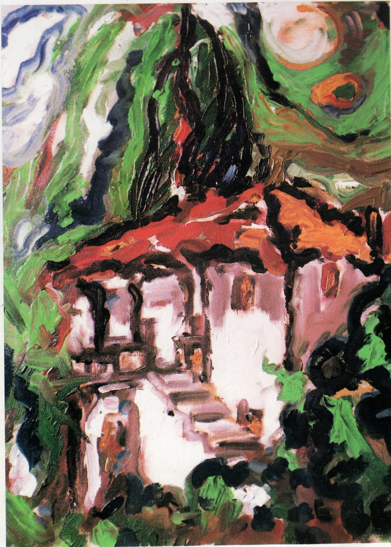
Мотив од Велуса 1993

НАРОДЕН МУЗЕЈ ГАЛЕРИЈА СТРУГА АВГУСТ 1994 ГОДИНА