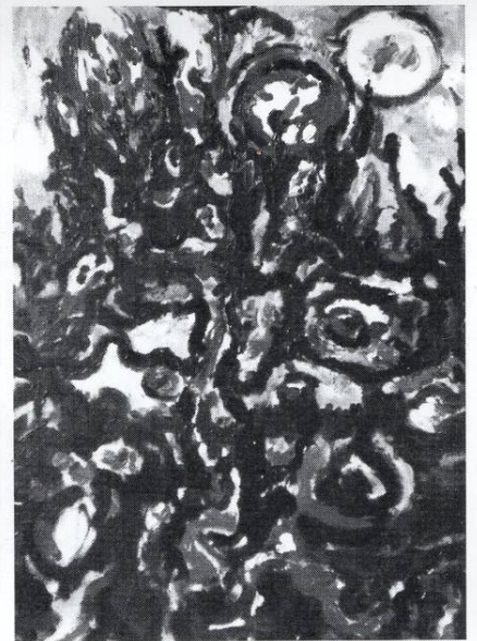
Od bavčata na Jordan I 1992