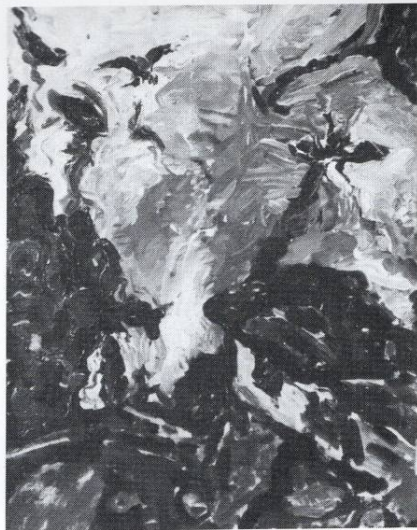
Pogled na Kaneo 1993