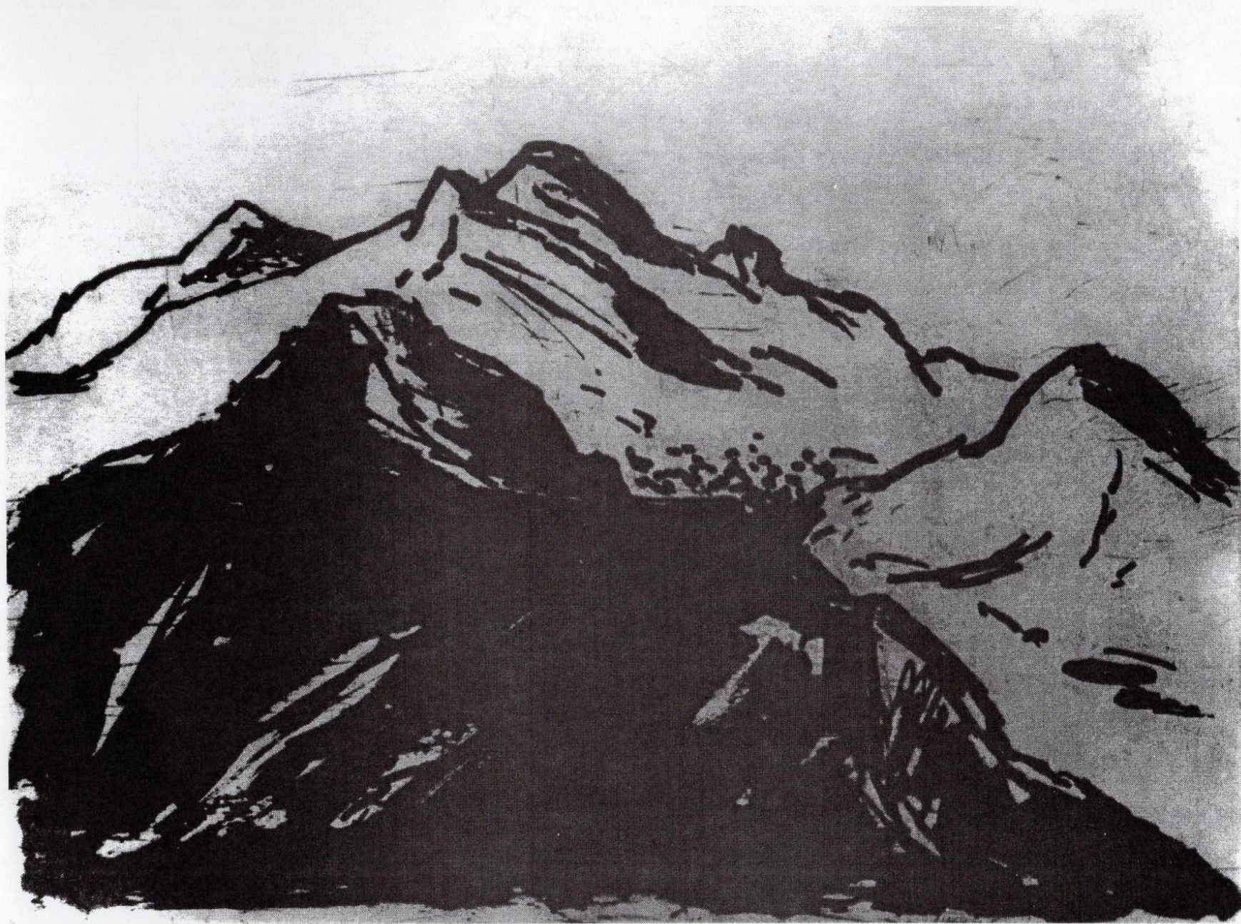
Од Златоврв, 1993, резерваш, етканица, 22,4x29,7см