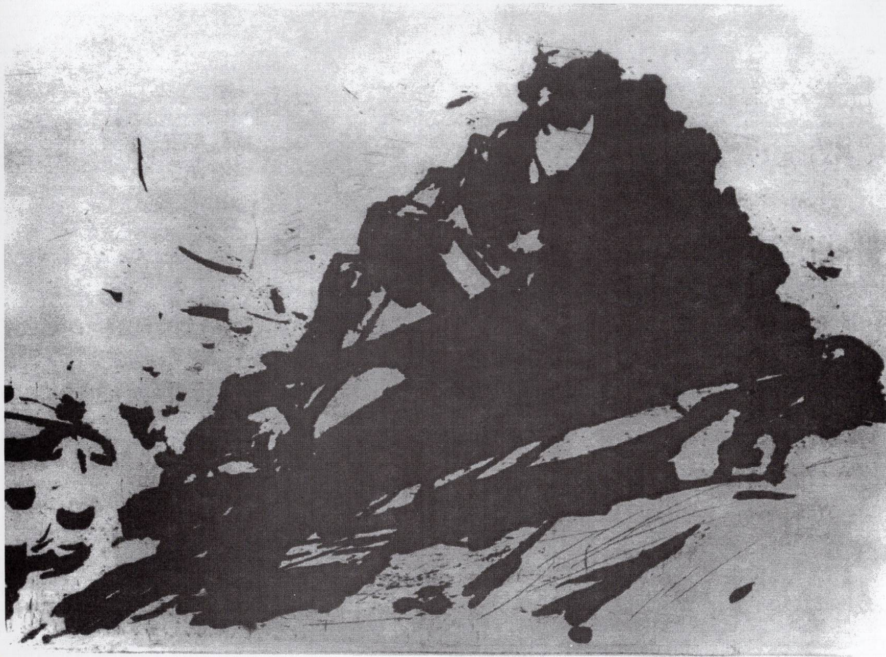
Златоврв, 1993, резерваш, етканица, 22,4x29,7см