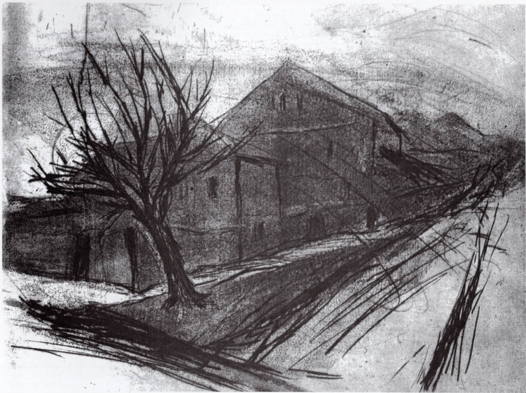
Прилепски пејзаж, 1991, резерваш, сува игла, 18,5x22см