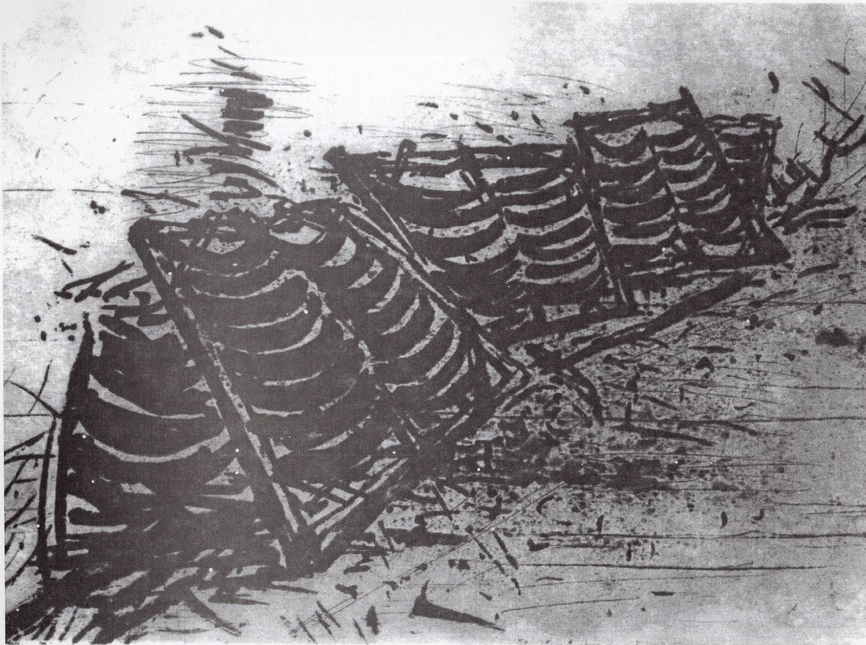
Тугун, 1991, резерваш, 19,5х30см