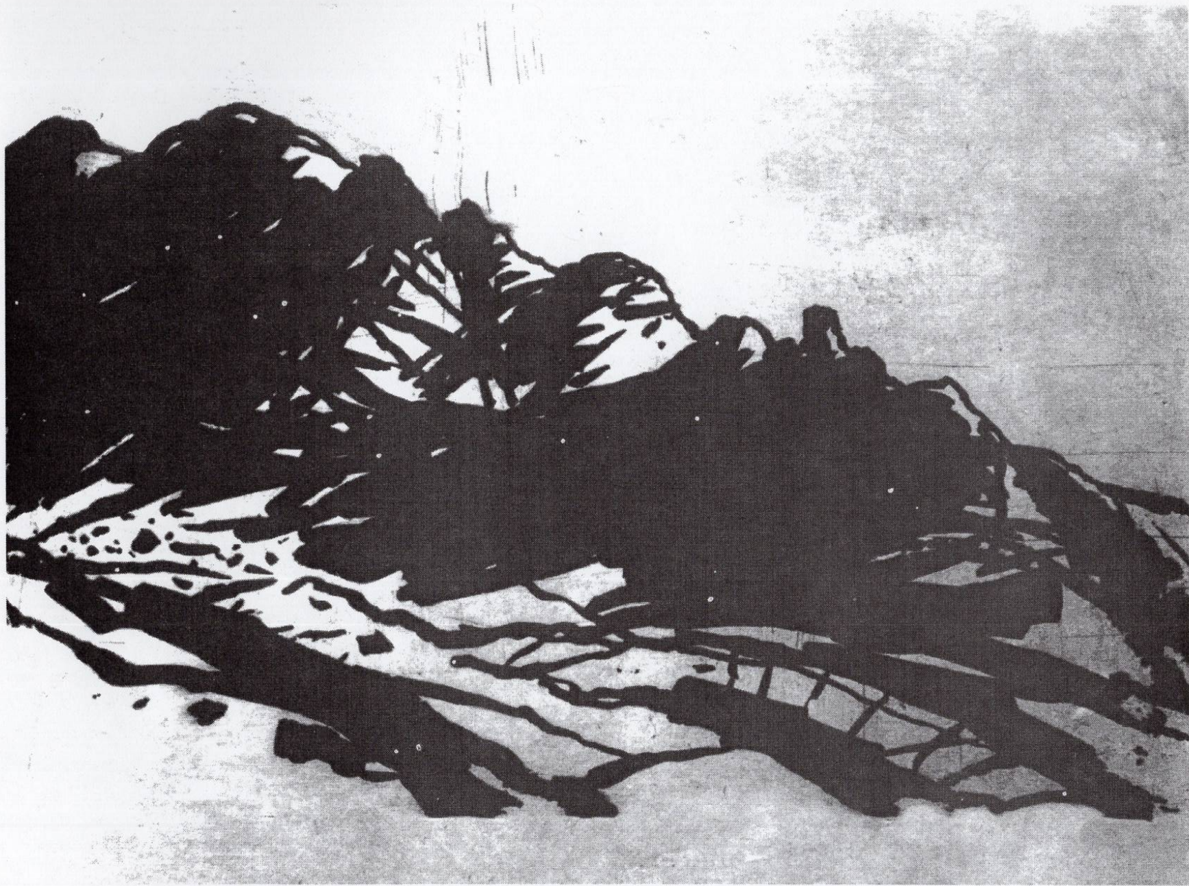
Селечка, 1994, резерваш, 30x44,7см