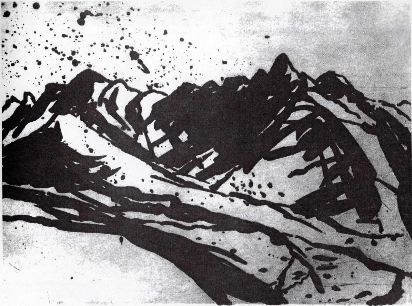
Прилепски пејзаж, 1994, резерваш, 25x35см