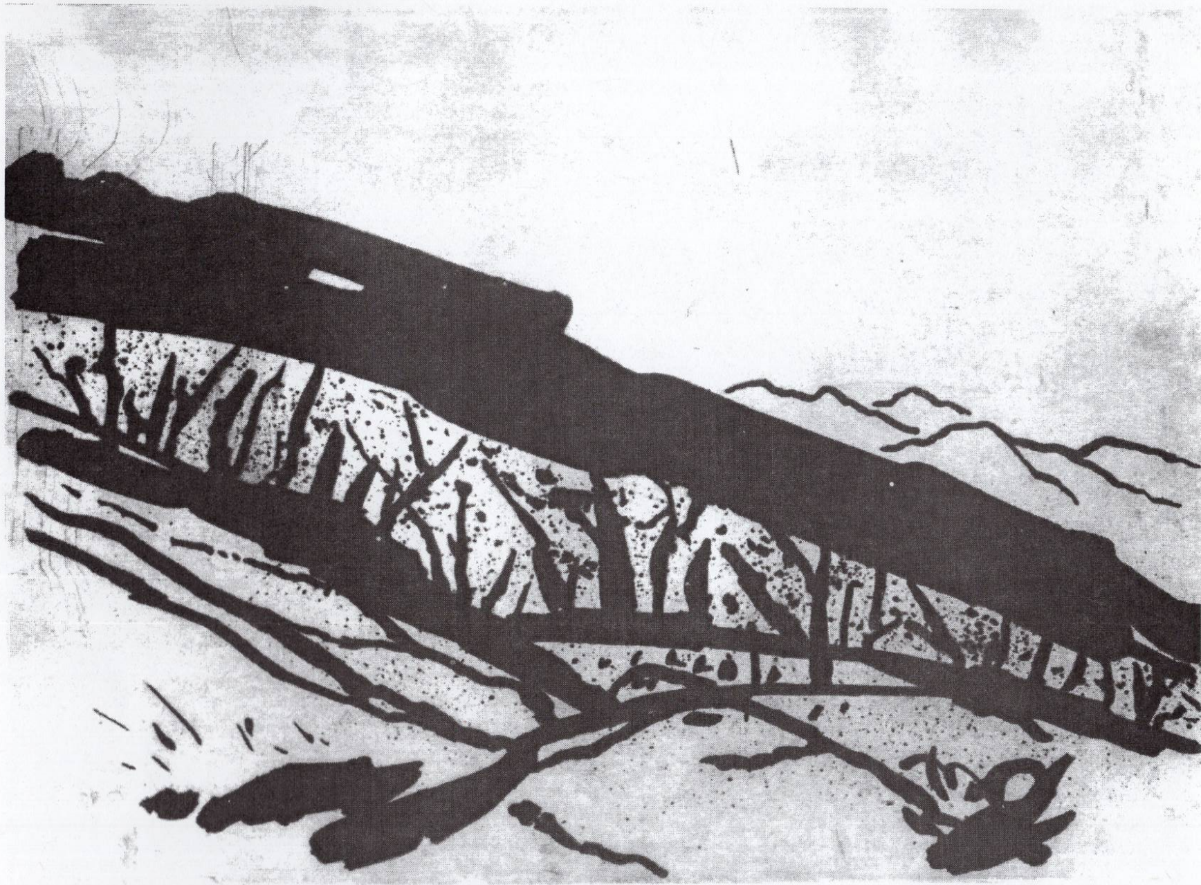
Белутина, 1994, резерваш, 30x40см