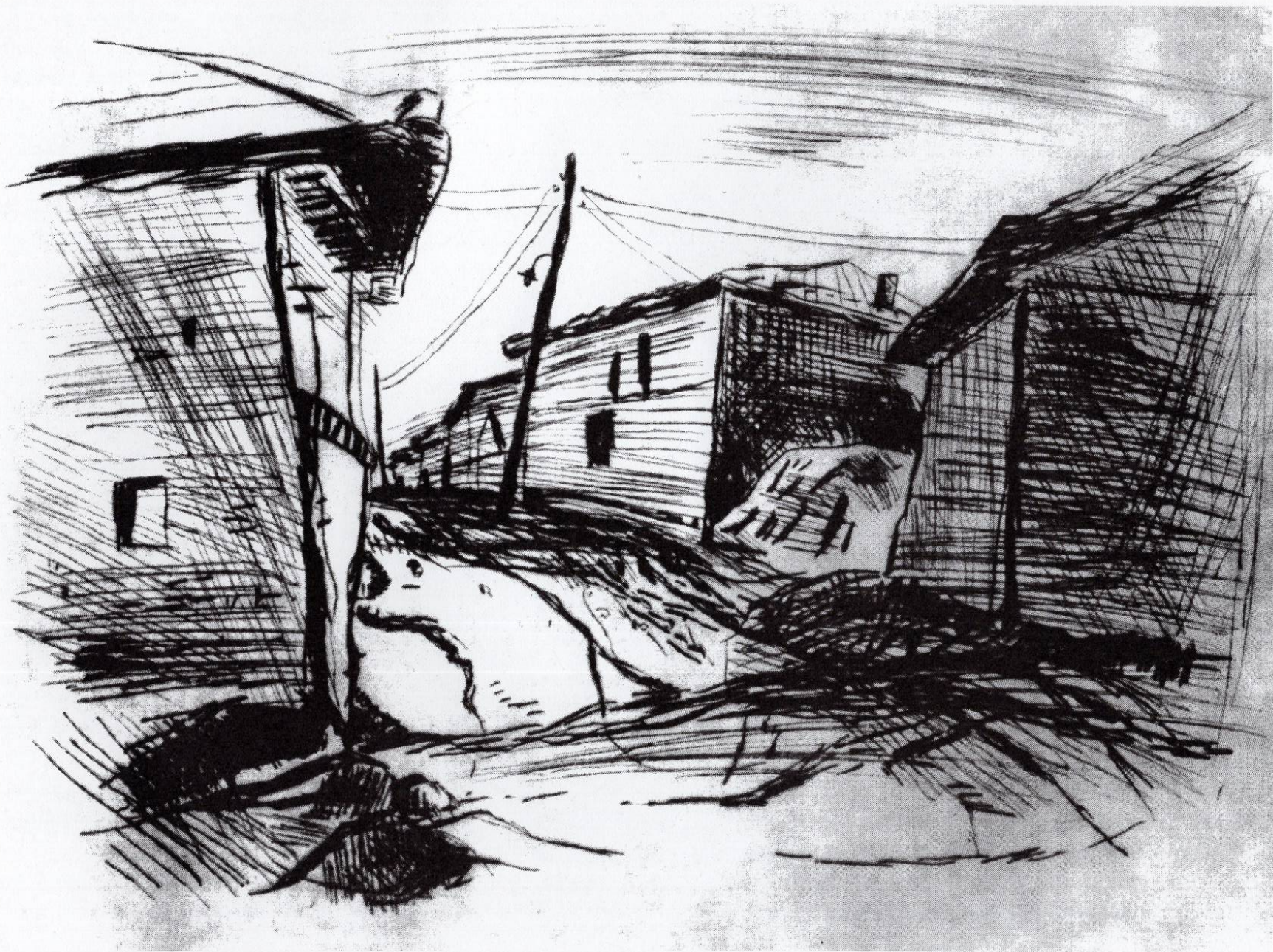
Улица, 1990, сува игла, 29,3x40см