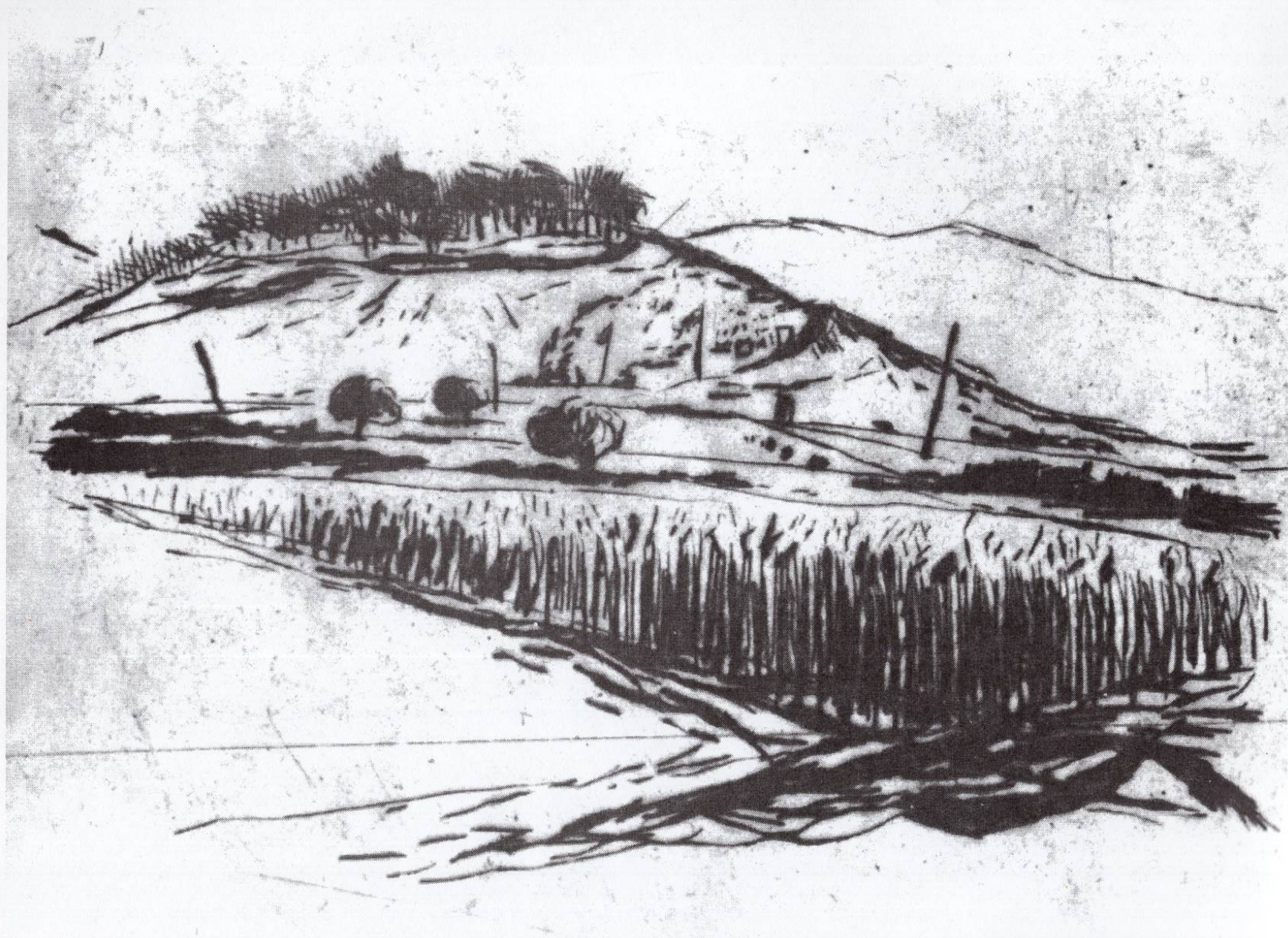
Рудина, 1990, сува игла, 16x20см