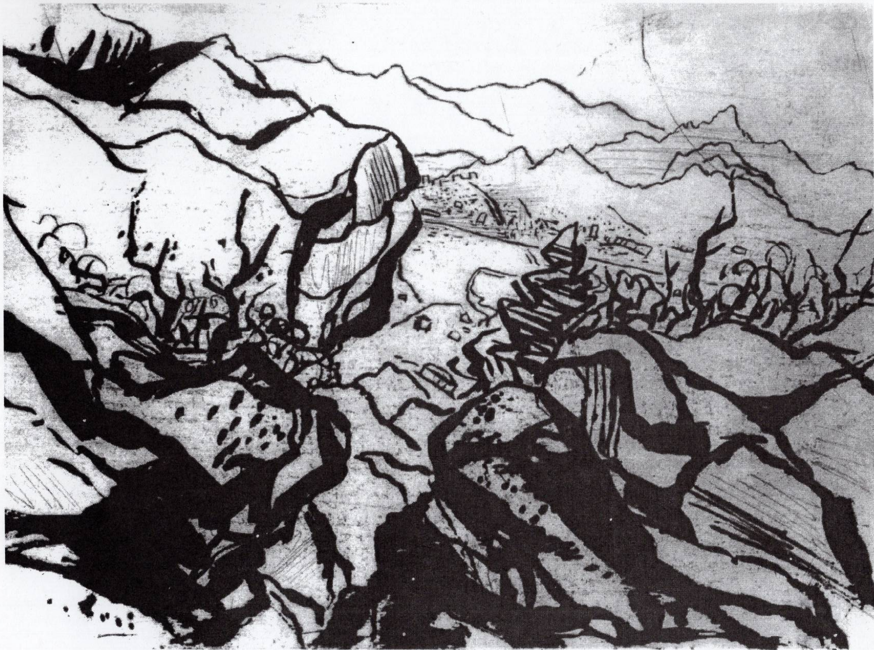
Скала, 1993, резерваш, сува игла, 24,8x35см