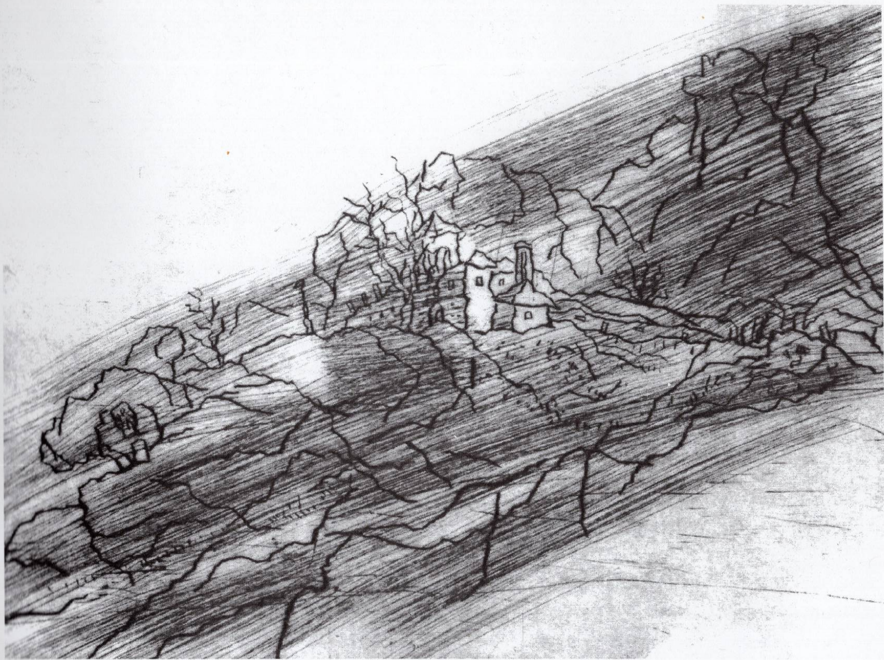
Трескавец, 1994, сува игла, 22,4x29,7см