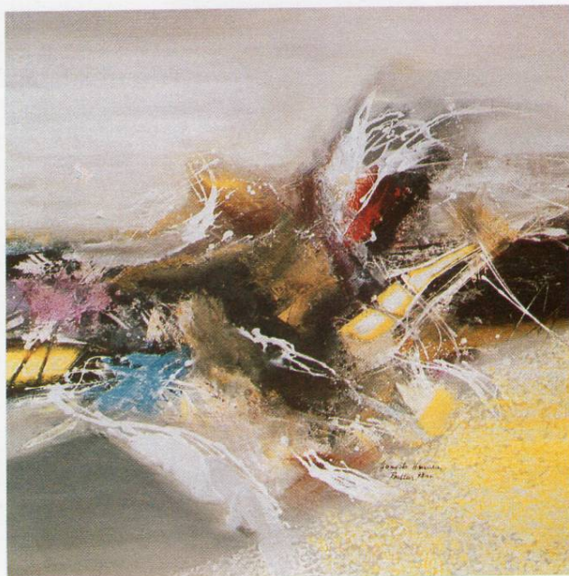
”Предел II“, масло на платно, 100x100 см, 1993 ”Landscape II“, oil on canvas, 100x100 cm, 1993