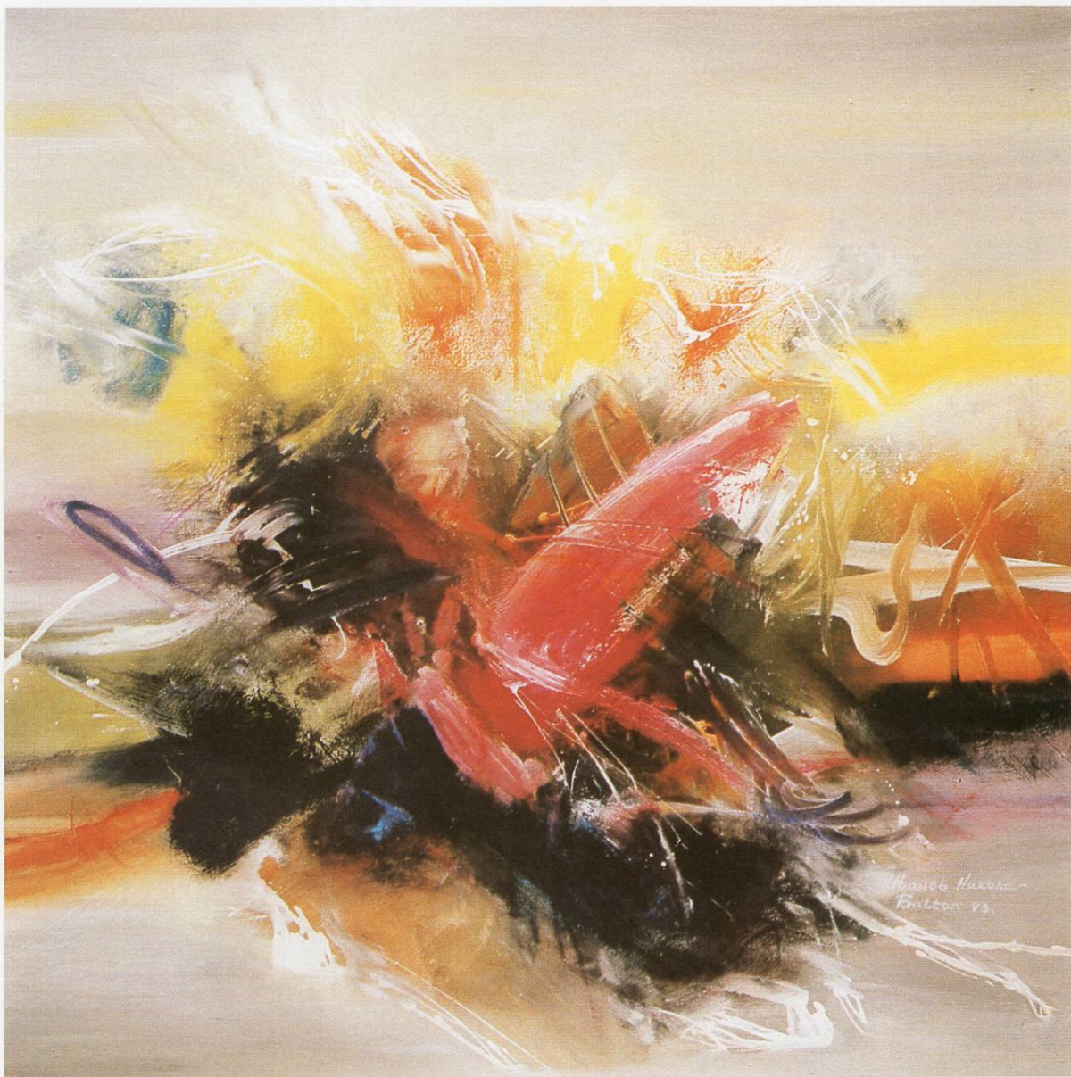
”Предел IV“, масло на платно, 100x100 см, 1993 ”Landscape IV“, oil on canvas, 100x100 cm, 1993