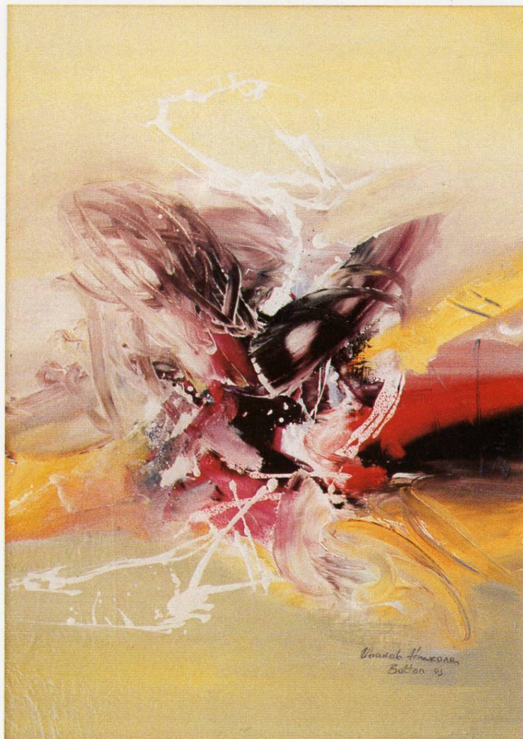
”Предел XV“, масло на платно, 60x50 см, 1993 ”Landscape XV“, oil on canvas, 60x50 cm, 1993