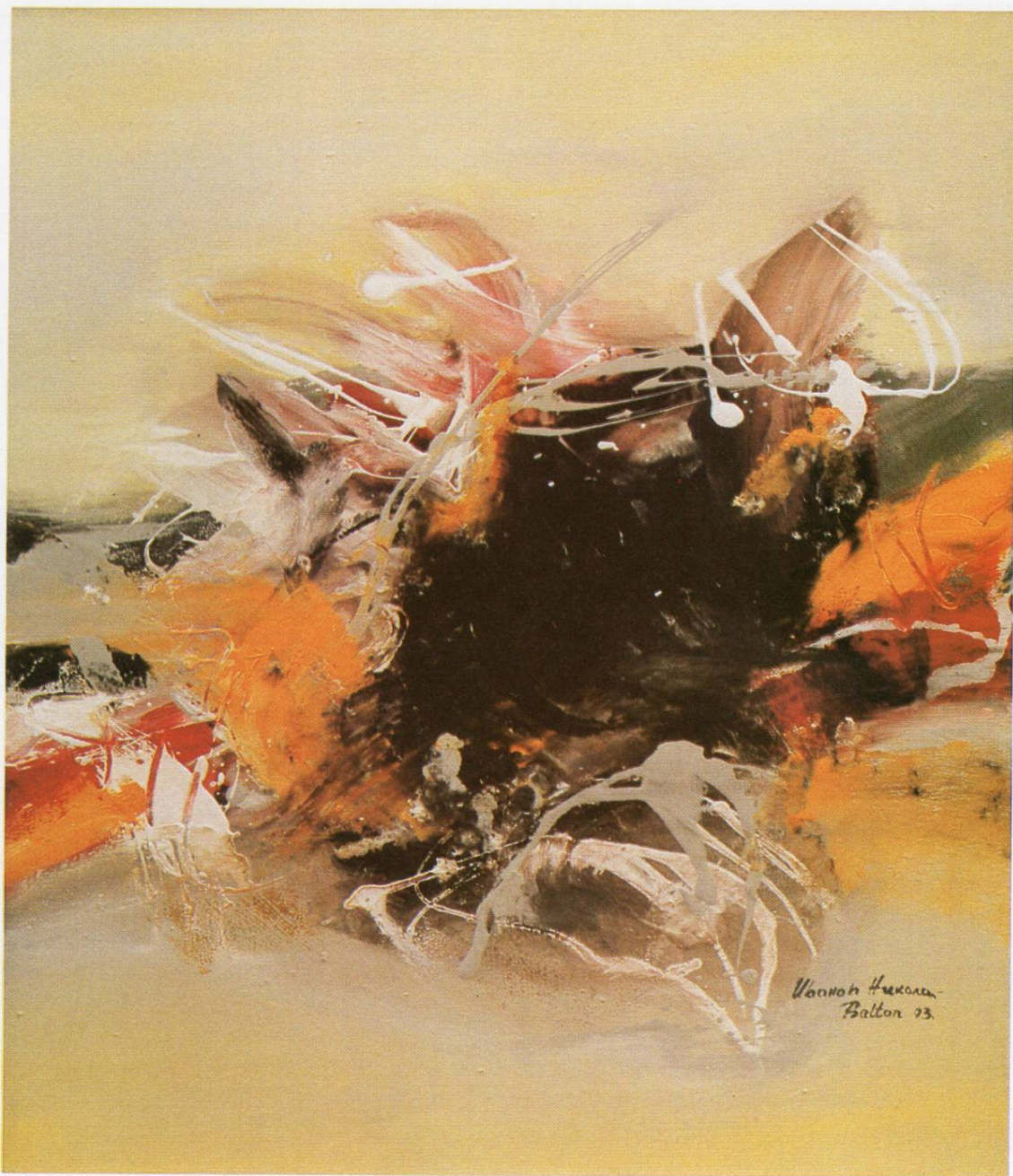
”Предел XII“, масло на платно, 60x50 см, 1993 ”Landscape XII“, oil on canvas, 60x50 cm, 1993