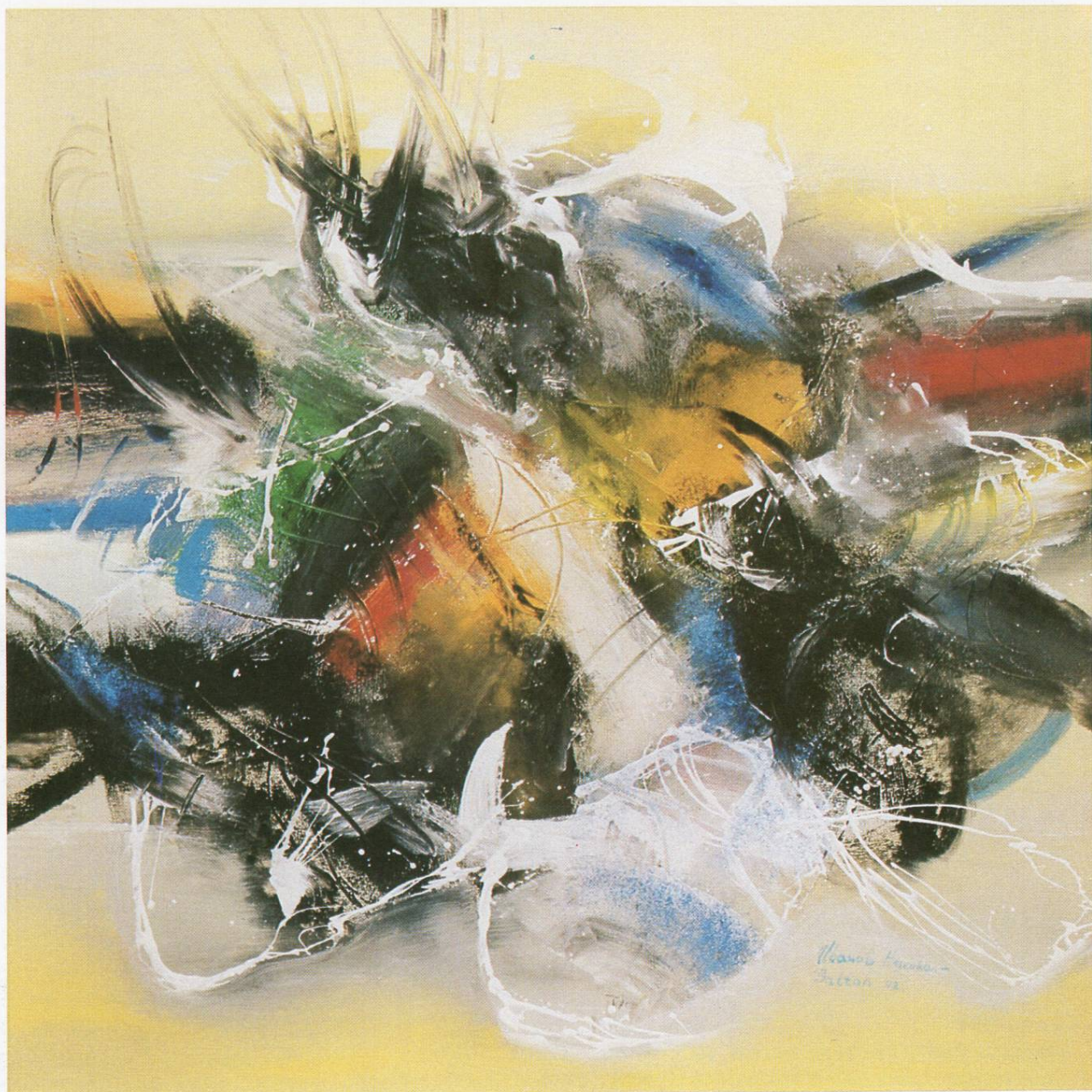
"Предел IX", масло на платно, 100x100 см, 1993 "Landscape IX", oil on canvas, 100x100 cm, 1993