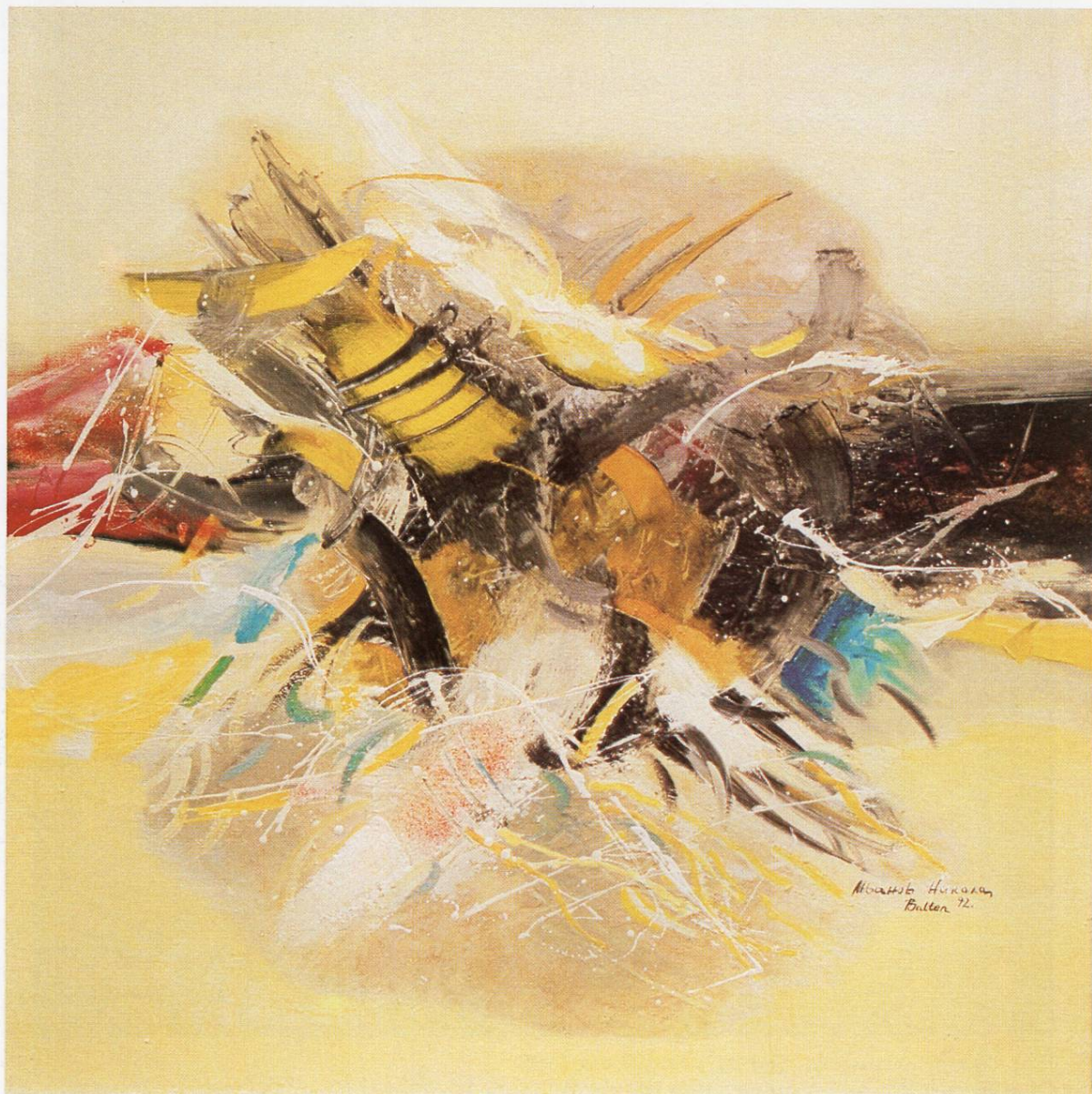
"Предел III", масло на платно, 100x100 см, 1993 "Landscape III", oil on canvas, 100x100 cm, 1993