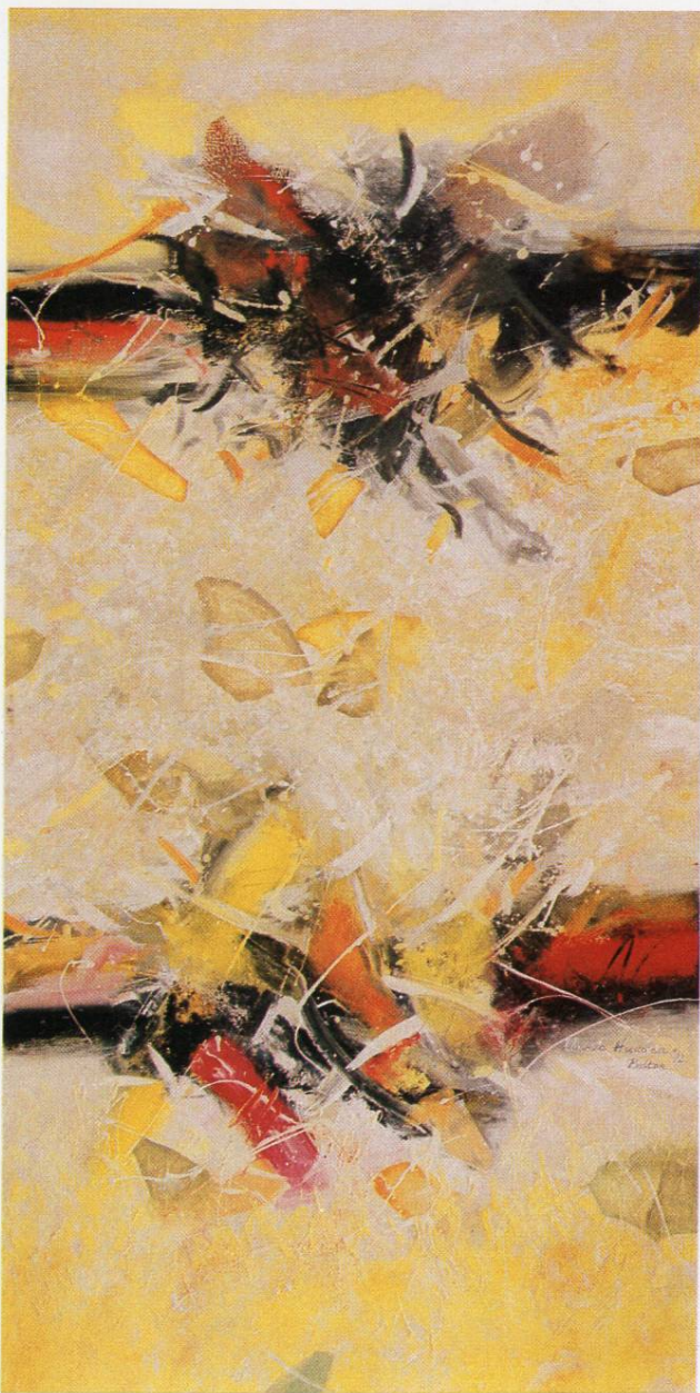
”Предел XI“, масло на платно, 160x80 см, 1992 ”Landscape XI“, oil on canvas, 160x80 cm, 1992