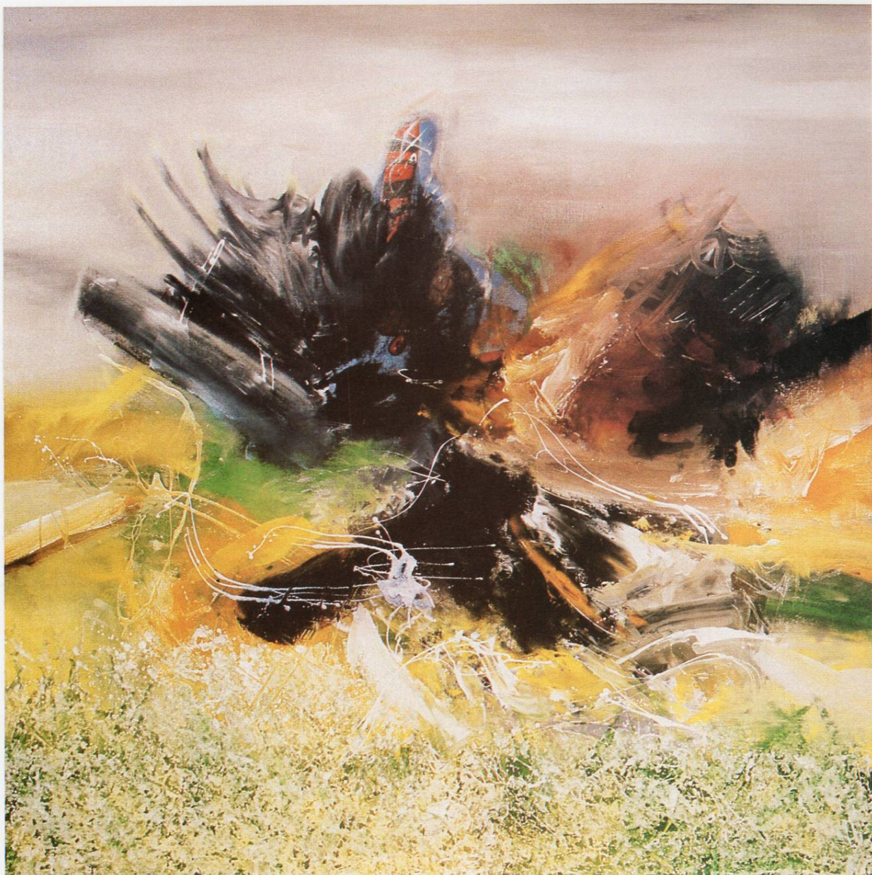
”Предел X“, масло на платно, 140x140 см, 1992 ”Landscape X“, oil on canvas, 140x140 cm, 1992