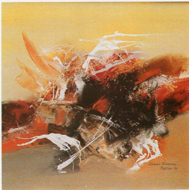
”Предел XIII“, масло на платно, 100x100 см, 1993 ”Landscape XIII“, oil on canvas, 100x100 cm, 1993