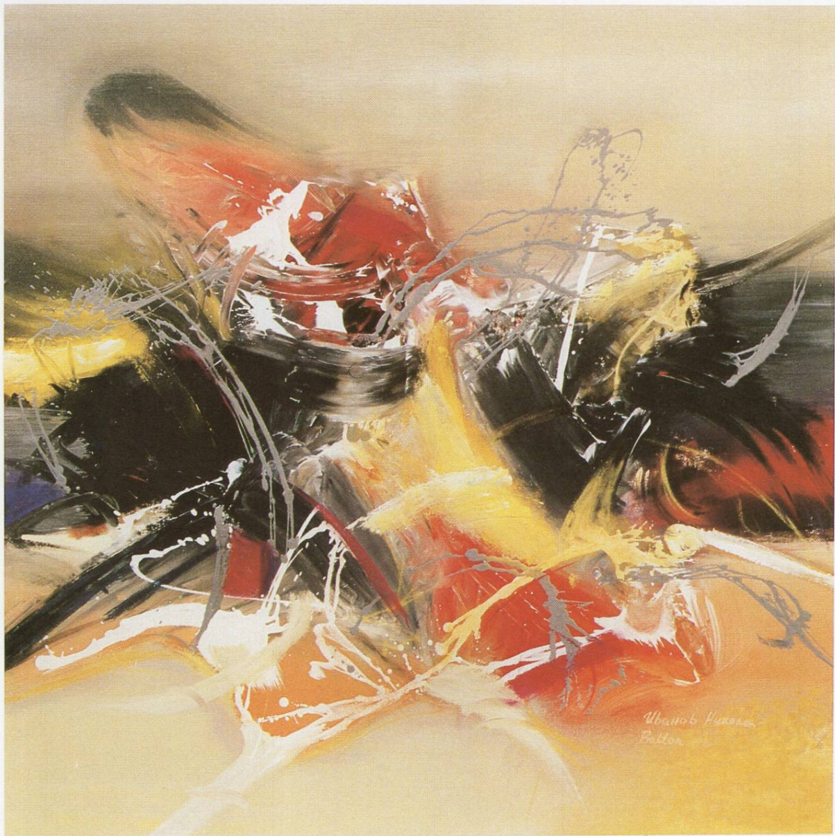
"Предел VII", масло на платно, 100x100 см, 1993 "Landscape VII", oil on canvas, 100x100 cm, 1993