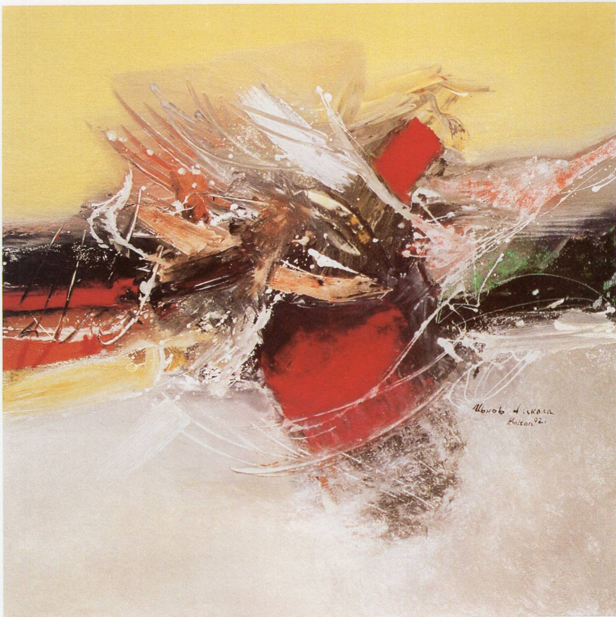
"Предел VIII", масло на платно, 100x100 см, 1992 "Landscape VIII", oil on canvas, 100x100 cm, 1992