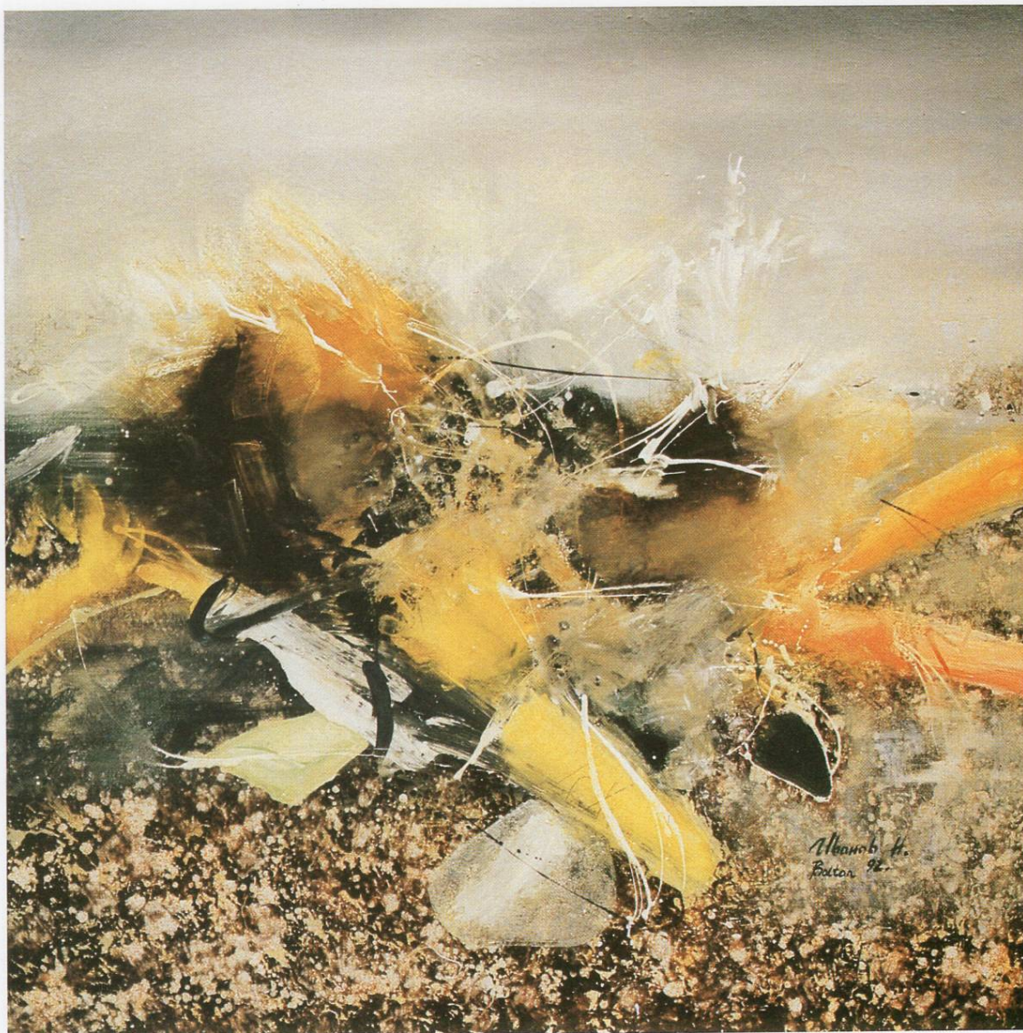
"Предел V", масло на платно, 100x100 см, 1992 "Landscape V", oil on canvas, 100x100 cm, 1992