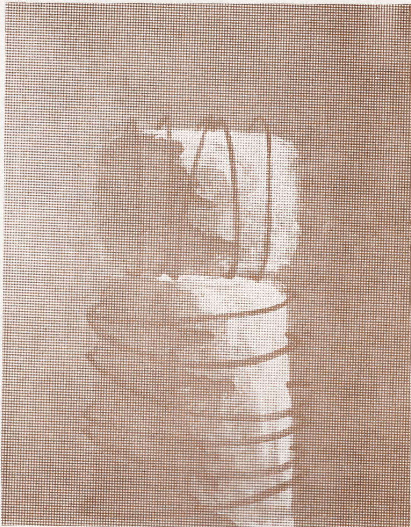
9. ОСТАТОЦИ ОД МИНАТОТО акрилик, 81 x 65 cm