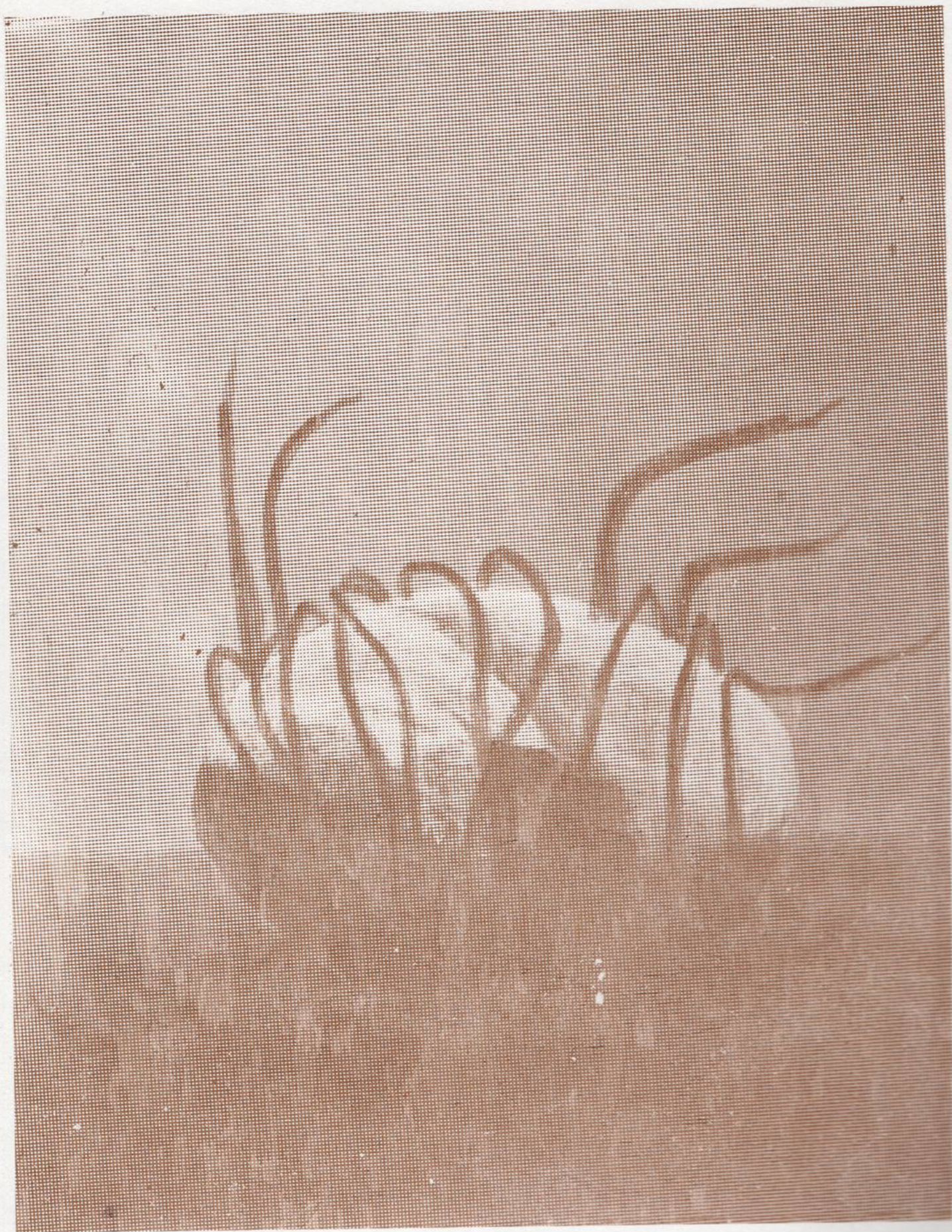
6. ФОСИЛ-1 акрилик, 81 x 65 см