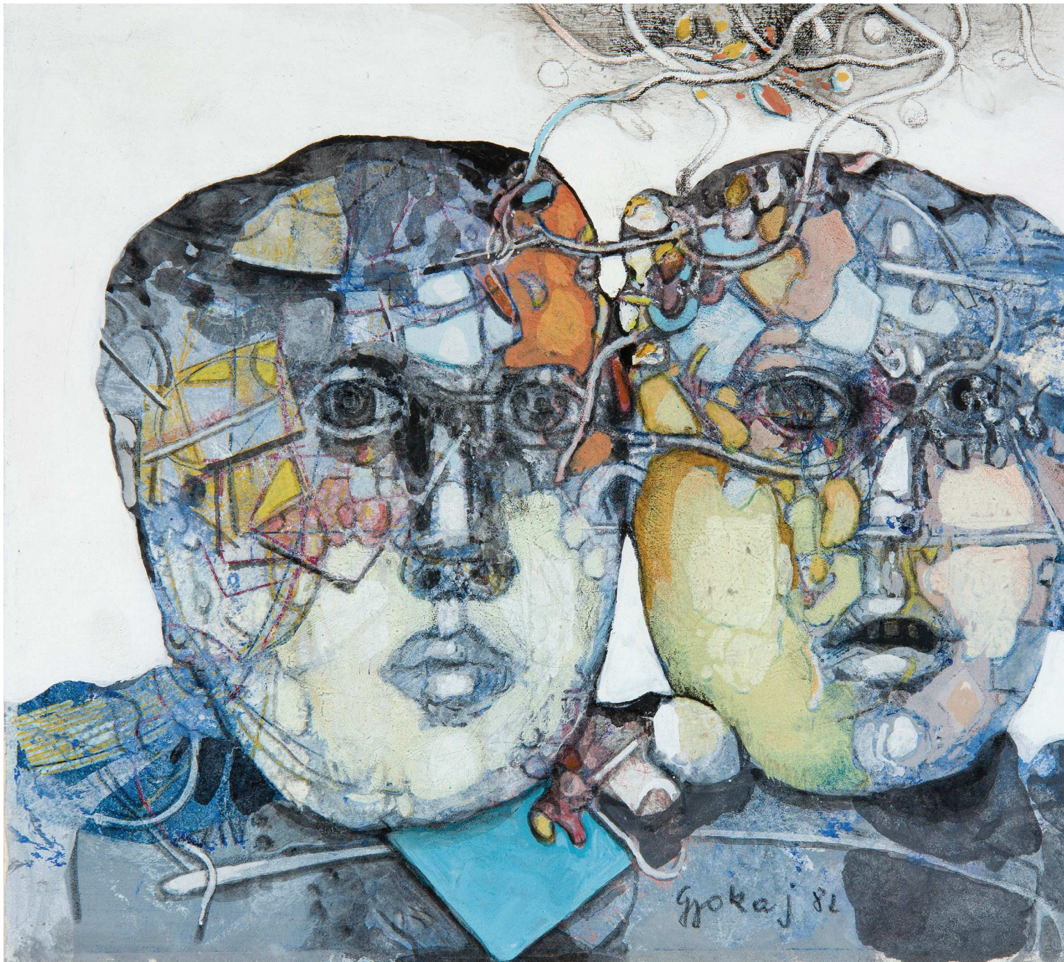
БЛИЗНАЦИ, комбинирана техника, 23x28.5, 1982, Галерија Конзул BINJAKËT, media të përziera 23x28.5, 1982, Galeria e Konsullit GEMINI, mixed media 23x28.5, 1982, Consul Gallery