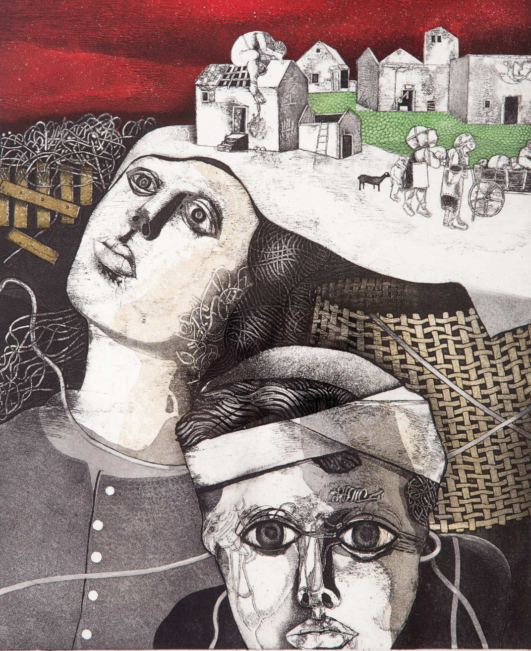
БЕГАЛЦИ, акватинта, 54x46, 1978, Музеи и галерији Подгорица REFUGATË, aquatint, 54x46cm, 1978, Podgorica Muzetë dhe Galeritë REFUGEES, aquatint, 54x46cm, 1978, Podgorica Museums and Galleries