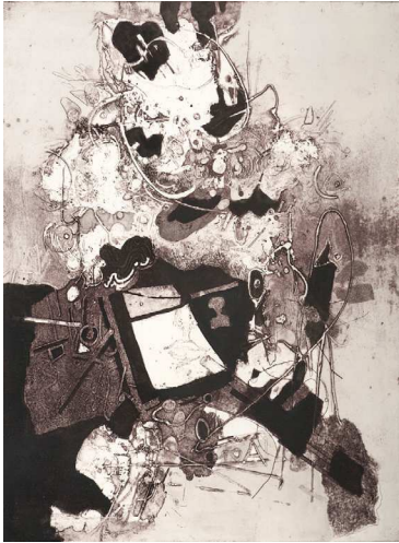
АРВАНТИНА, акватинта, 60x45, 1989, Центар на современата уметност Црна Гора ARVANTINA, aquatint, 60x45, 1989, Qendra për Art Bashkëkohor të Malit të Zi ARVANTINA, aquatint, 60x45, 1989, Center for Contemporary

Без наслов, длабок печат-комбинирана техника, 59x49,5, приватна сопственост