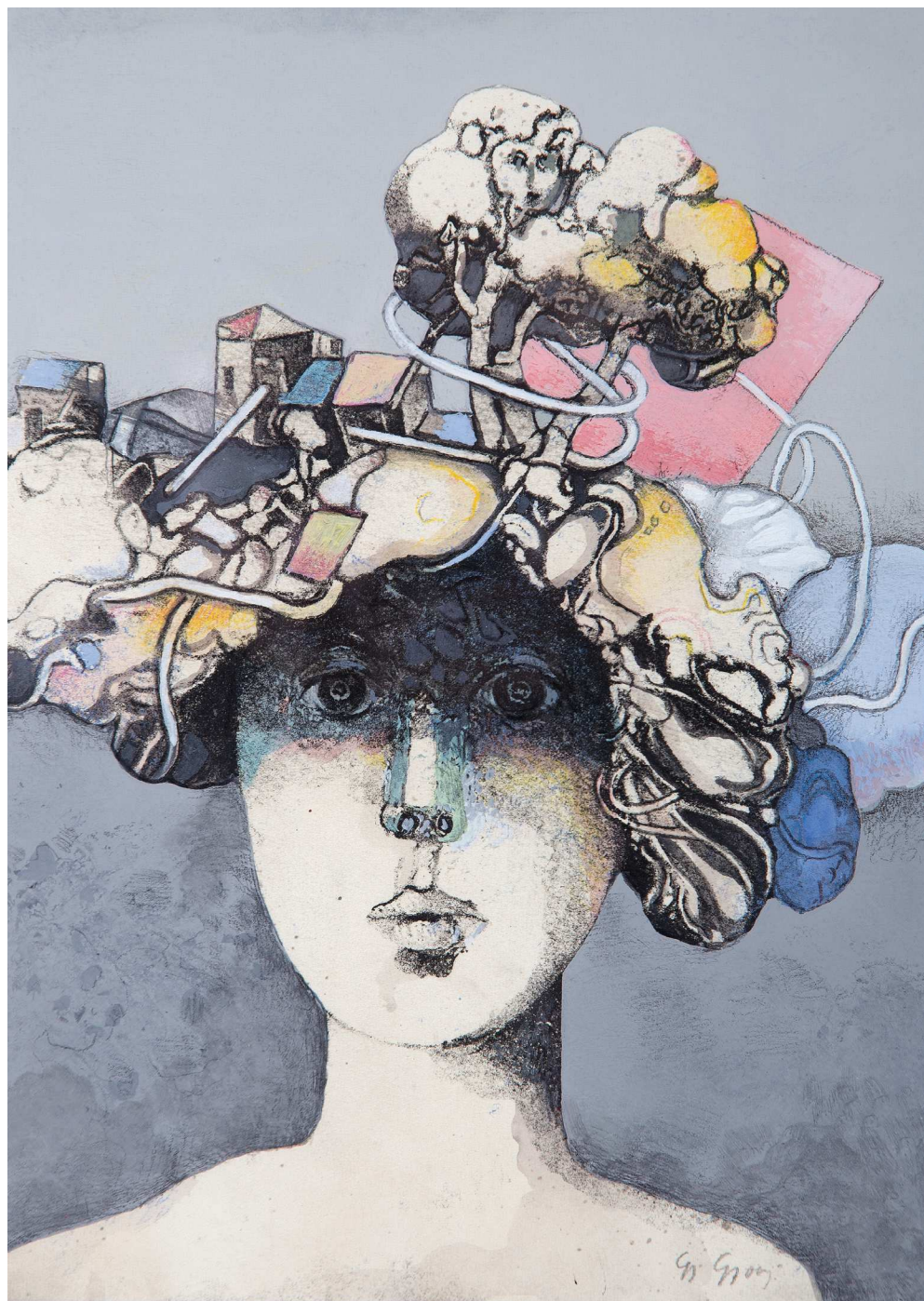
ГЛАВА, комбинирана техника, 32x23,5, 1981, Музеи и галери Подгорица KOKË, teknikë e kombinuar, 32x23.5cm, 1981, Muzetë dhe Galeritë në Podgoricë HEAD, combined technique, 32x23.5cm, 1981, Podgorica Museums and Galleries