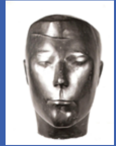
Borka Avramova “Jure Kaštelan”, patinirani gips, 1959. Vlasnik: Međunarodna galerija portreta Tuzla. Utvrđen nestanak prilikom popisa 2011. godine. Prijava podnesena MUP-u TK. Djelo se nalazi na spisku INTERPOL-a od 2018.

U slučaju krađe kulturnog dobra koje ima status nacionalnog spomenika Bosne i Hercegovine, muzejima i galerijama se preporučuje da obavijeste i Komisiju za očuvanje nacionalnih spomenika Bosne i Hercegovine. Nadležna policijska služba je dalje dužna obavijestiti NCB Interpol Sarajevo i Graničnu policiju.