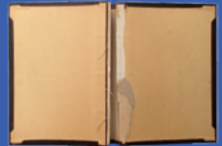
Inventarna knjiga , “Kolekcija jugoslovenskog portreta”, Inventarna knjiga koja predstavlja primarnu službenu evidenciju, pronađena prilikom popisa 2011. godine u Međunarodnoj galeriji portreta Tuzla.