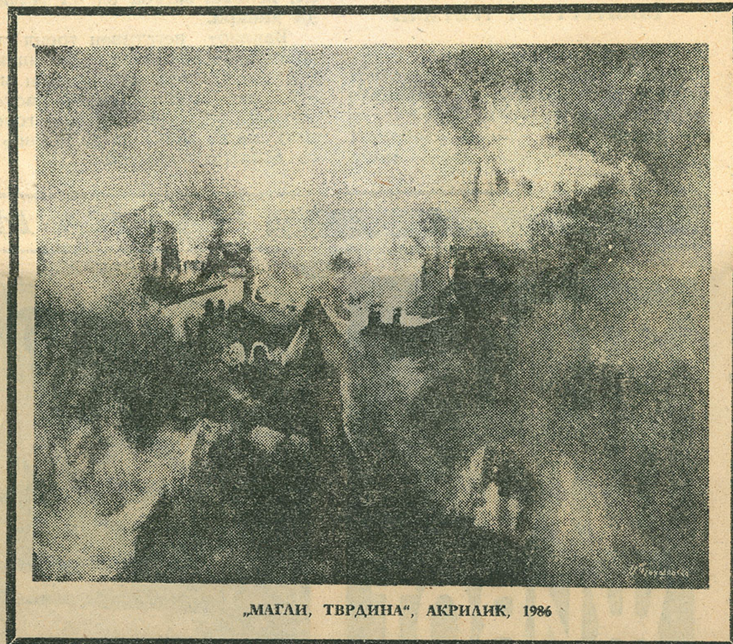
„МАГАН, ТВРДИНА“, АКРИЛК, 1986

● Вие цели 17 години се бавите со сликарство, а дури лани ја имавте првата самостојна изложба на слики. Зошто толку доцна настапите пред јавноста?