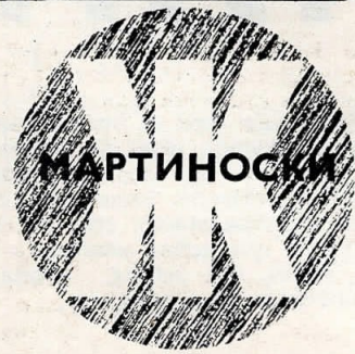
МАРТИНОСКИ: НОКНИ СВИРАЧИ (1934—36)

„За изложбата на нашиот талентиран сликар Никола Мартиноски во Загреб, во салонот „Улрих“, владее големо интересирање и има изгледи дека неговата изложба за Загреб ќе биде некој вид уметничка сензација.“