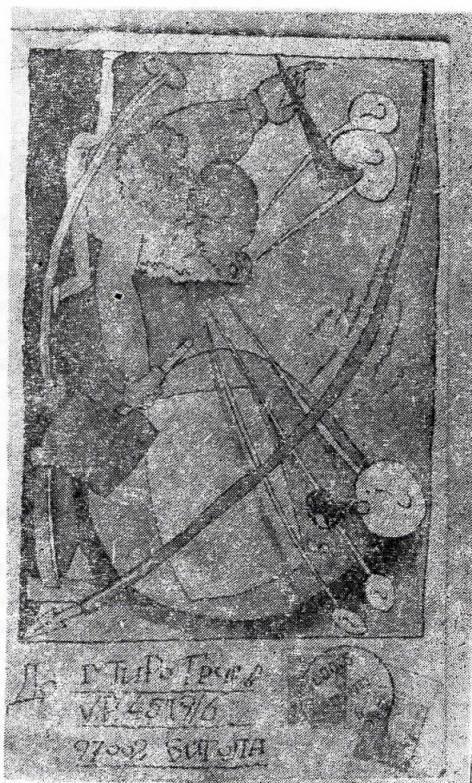
Мејл-артот на Грчев