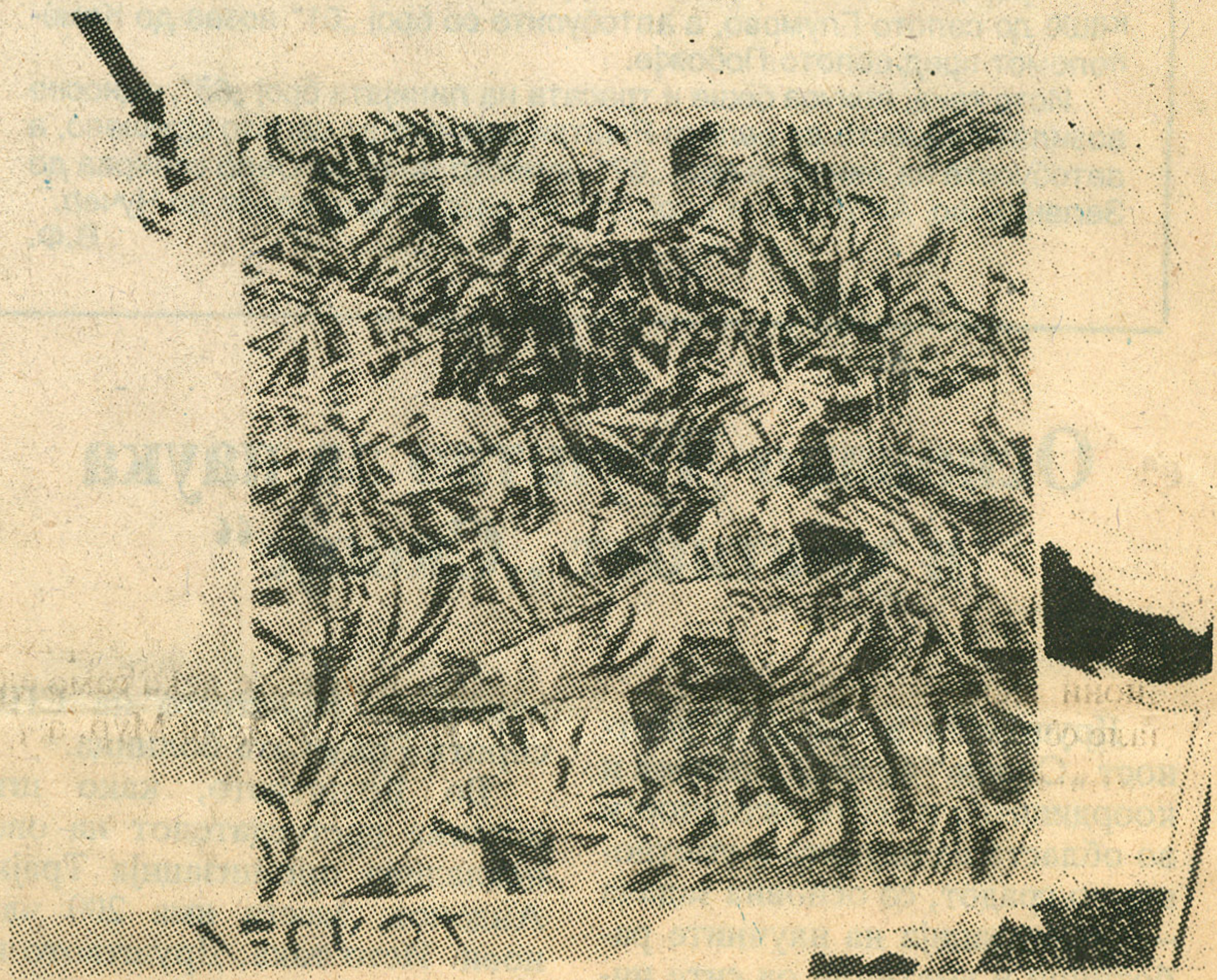
Лидија Вуиски („Димче Николов“): Движење, 1990, линорез