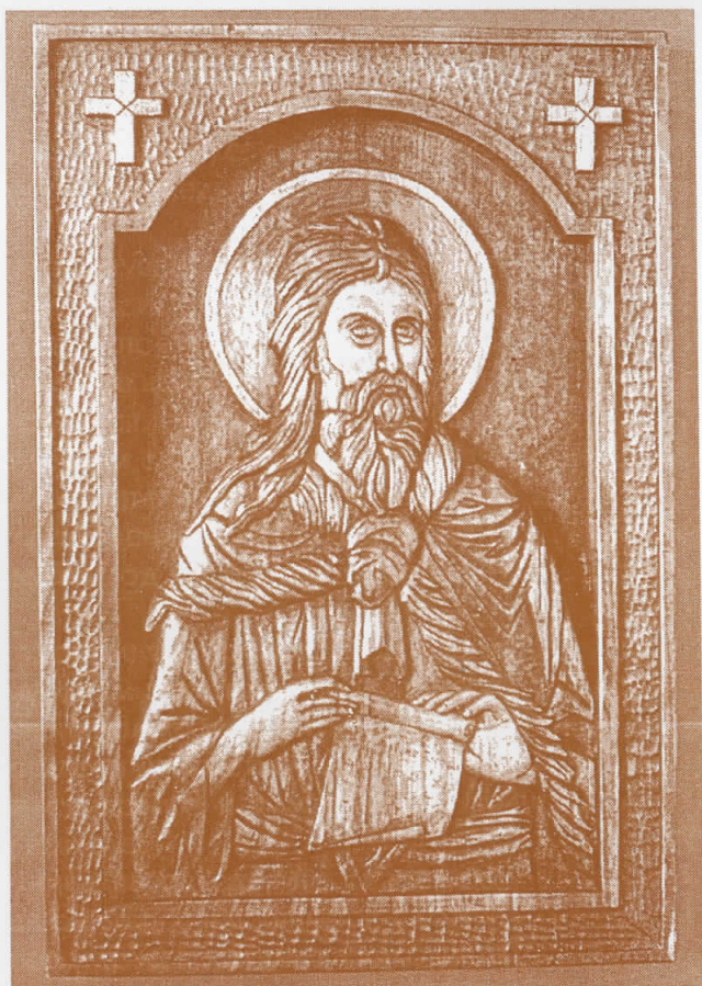
Св. Илија 50x30x4