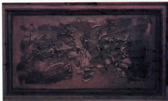
Кафена етида, масло, 1989, 55 x 35 cm

The boat sails, the consciousness flies. The breath in the air, the violinist obsesses. I imagine the friends. Strange night. An etude serves here. I waite in front of Gates.