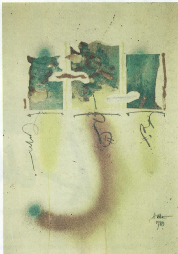
Житие VI, комб. тех. 1989, 50 x 70 cm

By listening myself, him, I travel, we hover often, by cry or laugh, in rhythm: colour or black and white. The brush under the nail. Colourful skin. New lifestory - small.