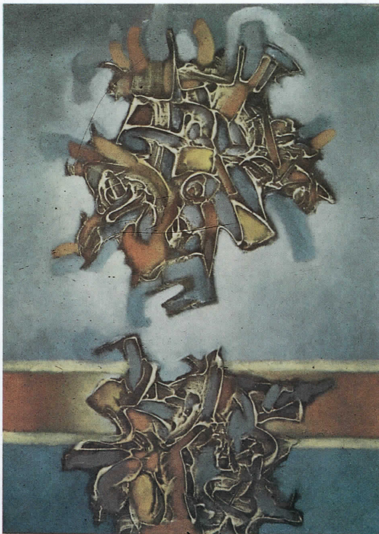
Спој, масло, 1990, 40 x 60 cm