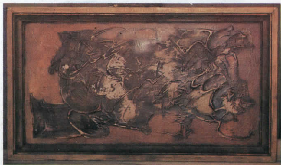
Црвена етида, масло, 1989, 55 x 35 cm

In fact I have a need to lie permanently my first or my second I. I make pressure on the consciousness, it responds physically.