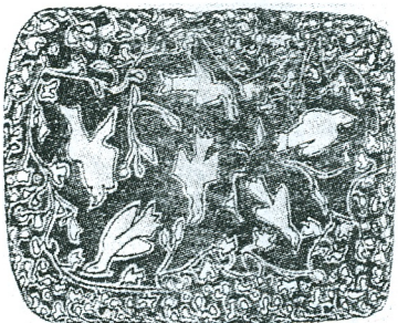
Dimče Protuder: Crtež (grupa »Danas«)

cionalno folklornih podataka, dok se kasnije okrenuo čisto, geometrijskoj formi i sugestiji simbola. Nalazeći u magiji kruga svjedočanstva o vlastitom razmišljanju o postanku i počelu, Korubin najnovijom izložbom pročišćava svoju sintaksu, iako je ona još uvijek opterećena balastom.