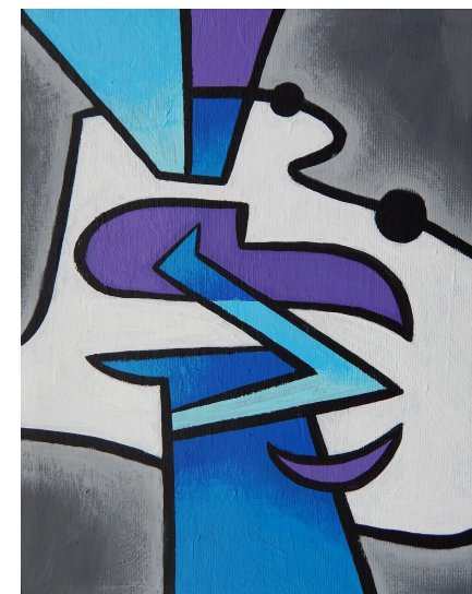
Таа на прошетка, 24 x 19 см акрил на платно