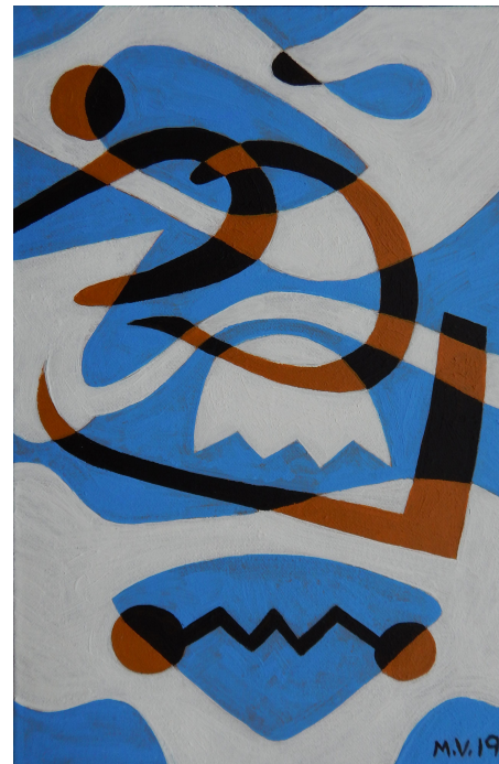
Форми над градот, 29 x 19 см акрил на платно