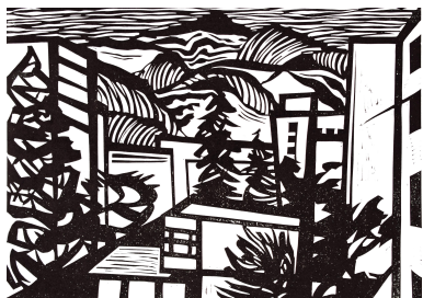
Поглед кон врвот, 36 x 50 см линорез

Ако наивноста на повторувањето на линијата и формата ја земеме како богатство од младешка перцепција, брзата ликовна реакција како темпераментна игра, тогаш можеме да ја славиме уметноста на посебните изрази. На Марко Вујисиќ му посакуваме со свежината на размислување од оваа изложба да созрева и на некои други теми, проблеми, медиуми.