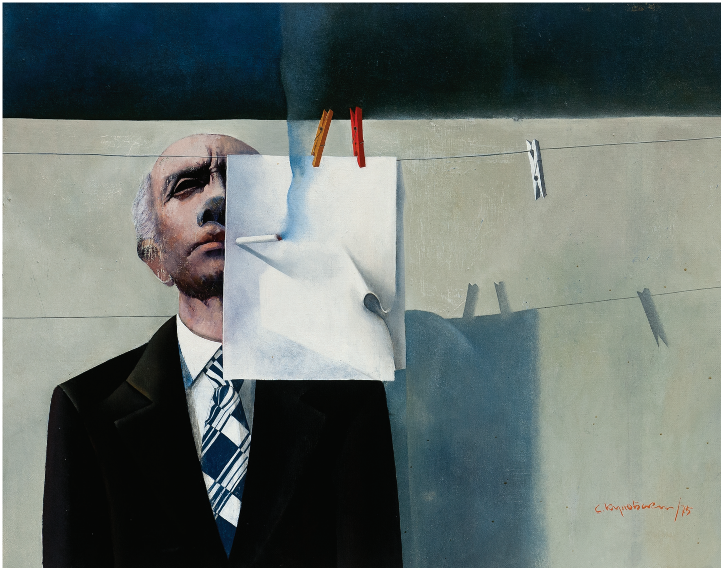
Автопортрет со цигара, 1975 Масло на платно, 80 x 102 Self-portrait with Cigarette, 1975 Oil on canvas, 80 x 102