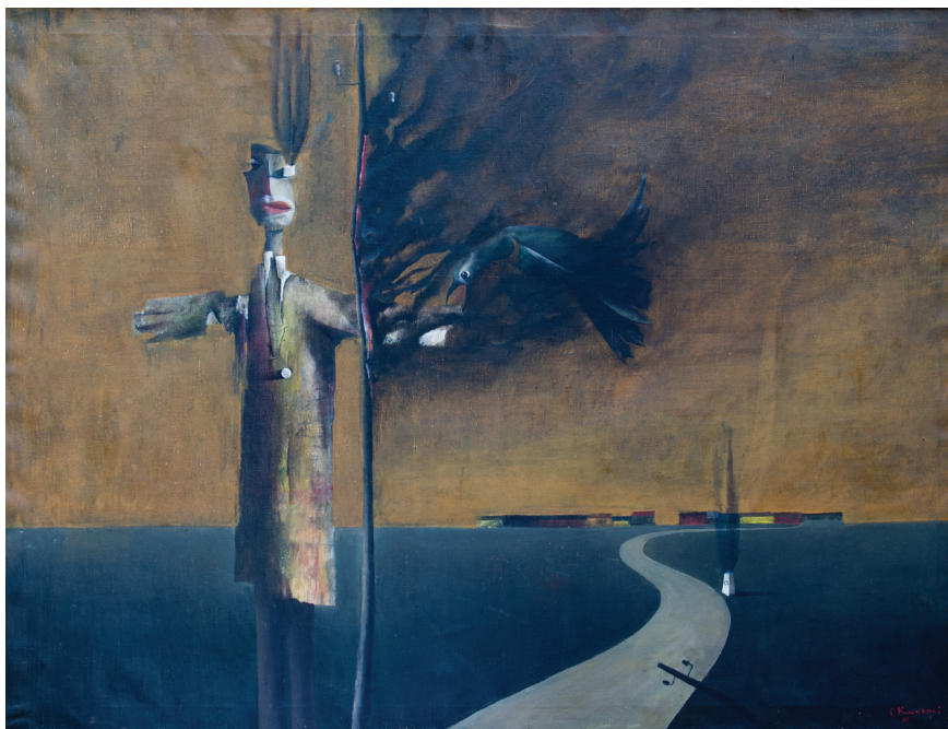
Композиција – Страв , 1961 Масло на платно, 110 x 149 Composition - Fear , 1961 Oil on canvas, 110 x 149