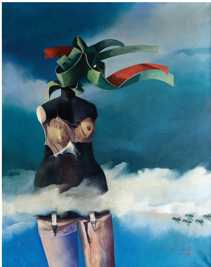
Залуден предизвик, 1977 Масло на платно, 76 x 100 Vain Challenge, 1977 Oil on canvas, 76 x 100