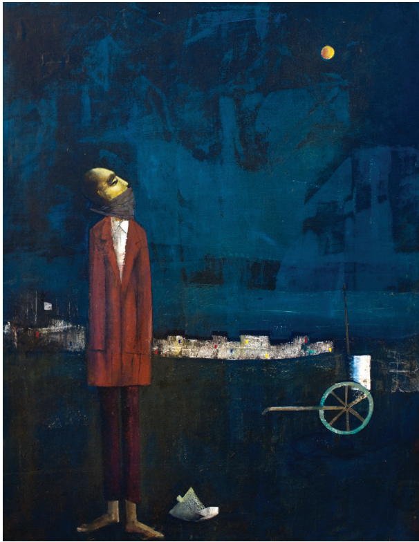
Грипозна нощ , 1958 Масло на платно, 74 x 94 Influenza Night , 1958 Oil on canvas, 74 x 94