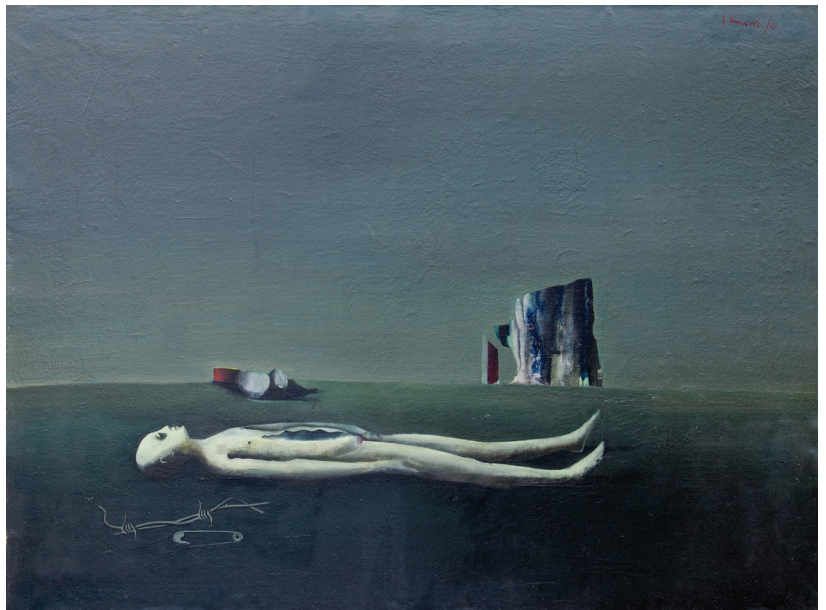
Логор , 1960 Масло на платно, 82 x 111 Camp , 1960 Oil on canvas, 82 x 111