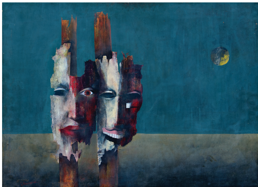
Маски , 1964 Масло на платно, 64,5 x 75 Masks , 1964 Oil on canvas, 64.5 x 75