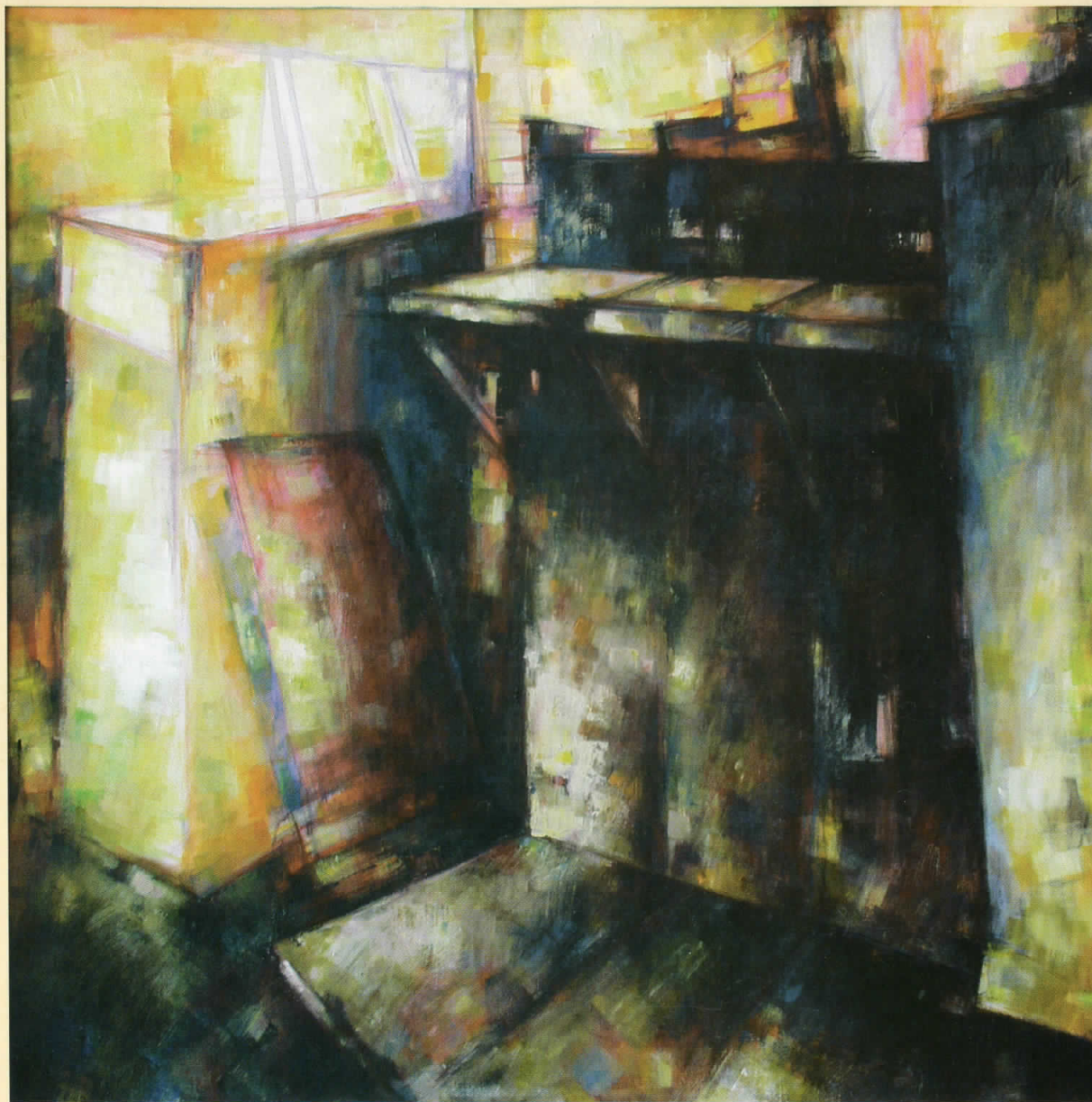
НАТАША МИЛОВАНЧЕВ NATAŠA MILOVANČEV