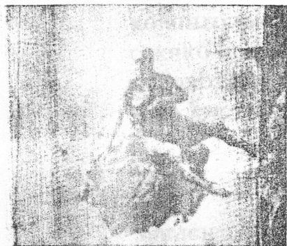
o Odalović: "Kraj", 1994.