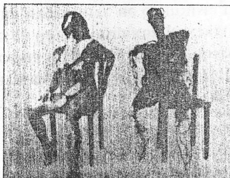
Karanović Branimir: "Trudnica", 1993.