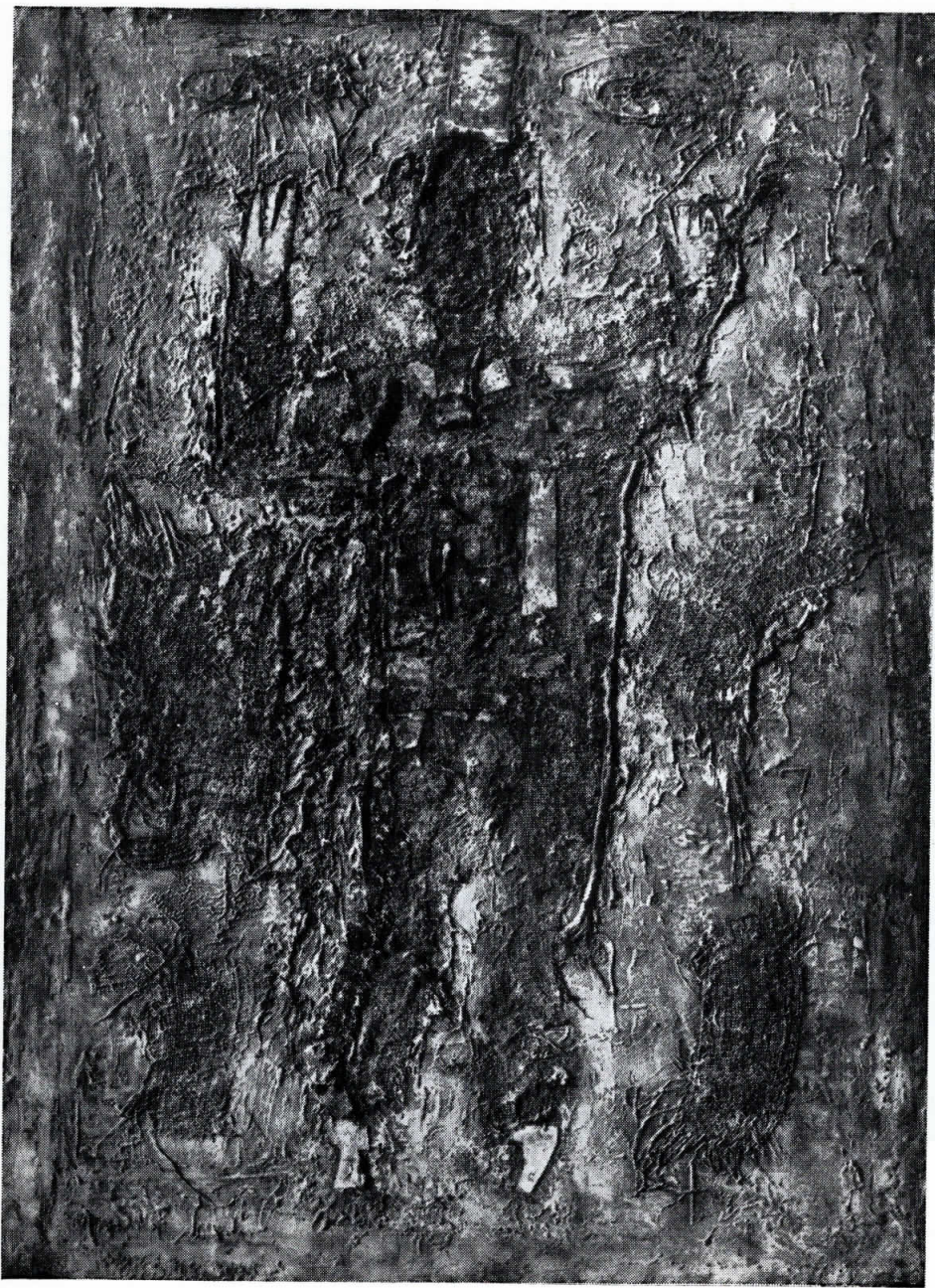
Предраг Гол, Старење на комедиантот, 1964