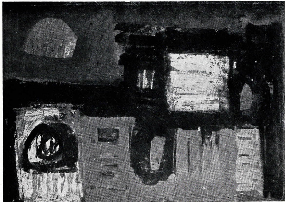
n Homan: Kompozicija II