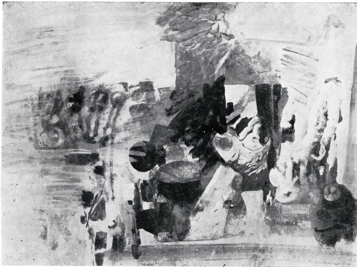
Lei Mojin: Na obali mora

LEI MOJIN: NA OBALI MORA LEI MOJIN: NA OBALI MORA LEI MOJIN: NA OBALI MORA