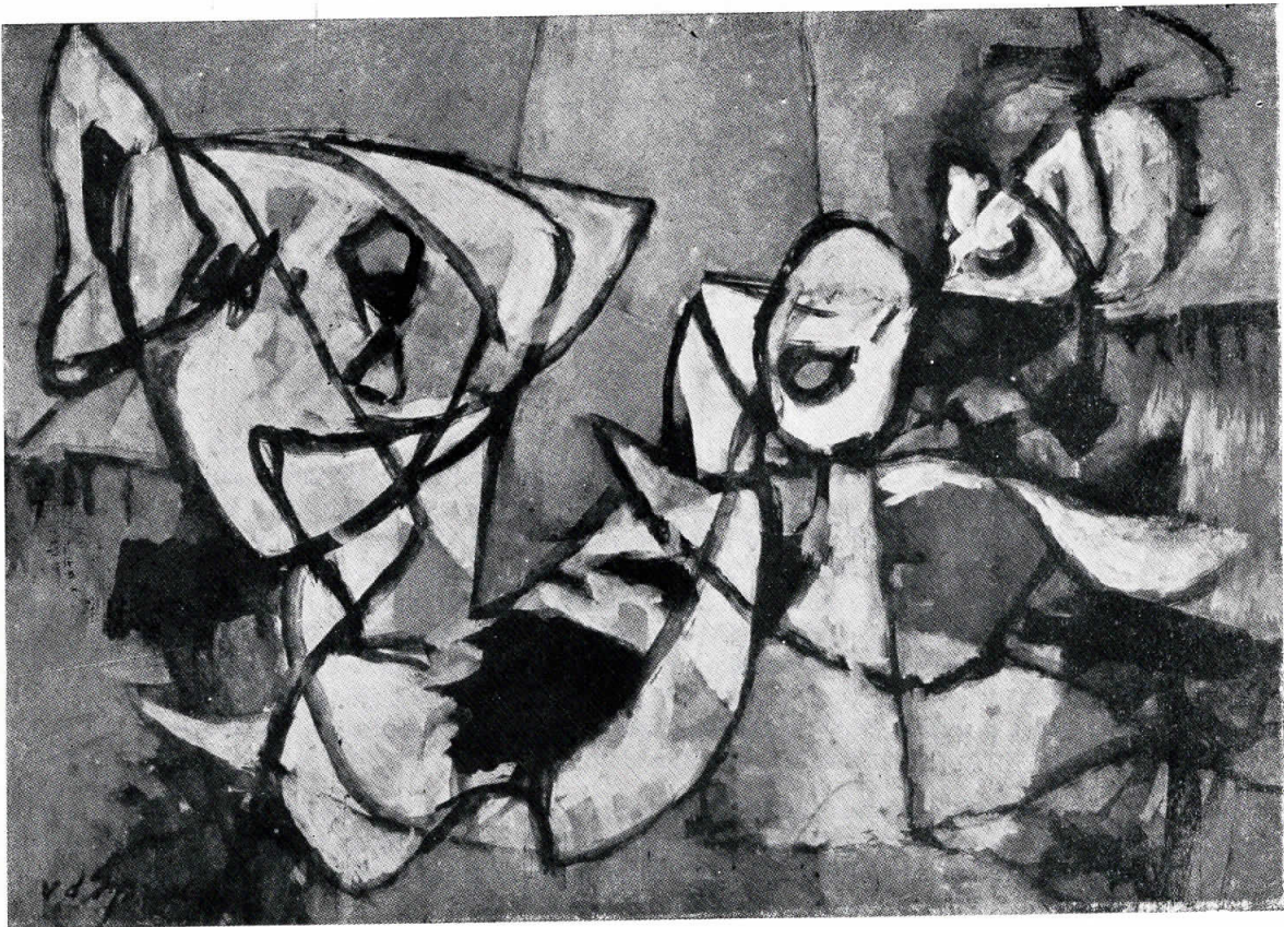
H. M. van der Spoel: Mrtva priroda