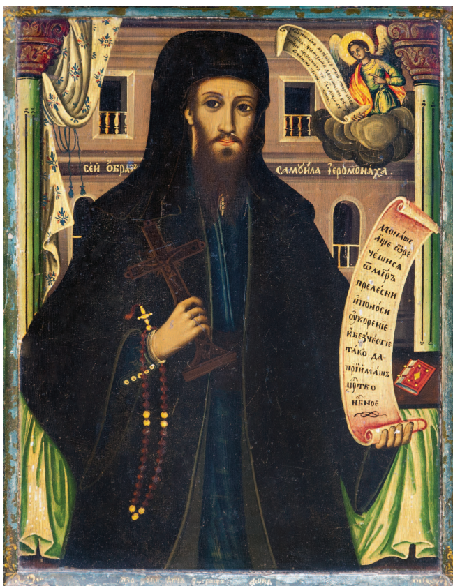
ДИМИТРИЈА КРСТЕВИЌ, ДИЧО ЗОГРАФ / ДИМИТРИЈА КЌРСТЕВИЌ ZOGRAFI DIÇO / ДИМИТРИЈА КРСТЕВИЌ, DICO ZOGRAPH Портрет на Јеромонах Самоил / Portreti i murgu Samoil / Portrait of the priest- monk Samoil, 1854

Director of the National Gallery of Macedonia