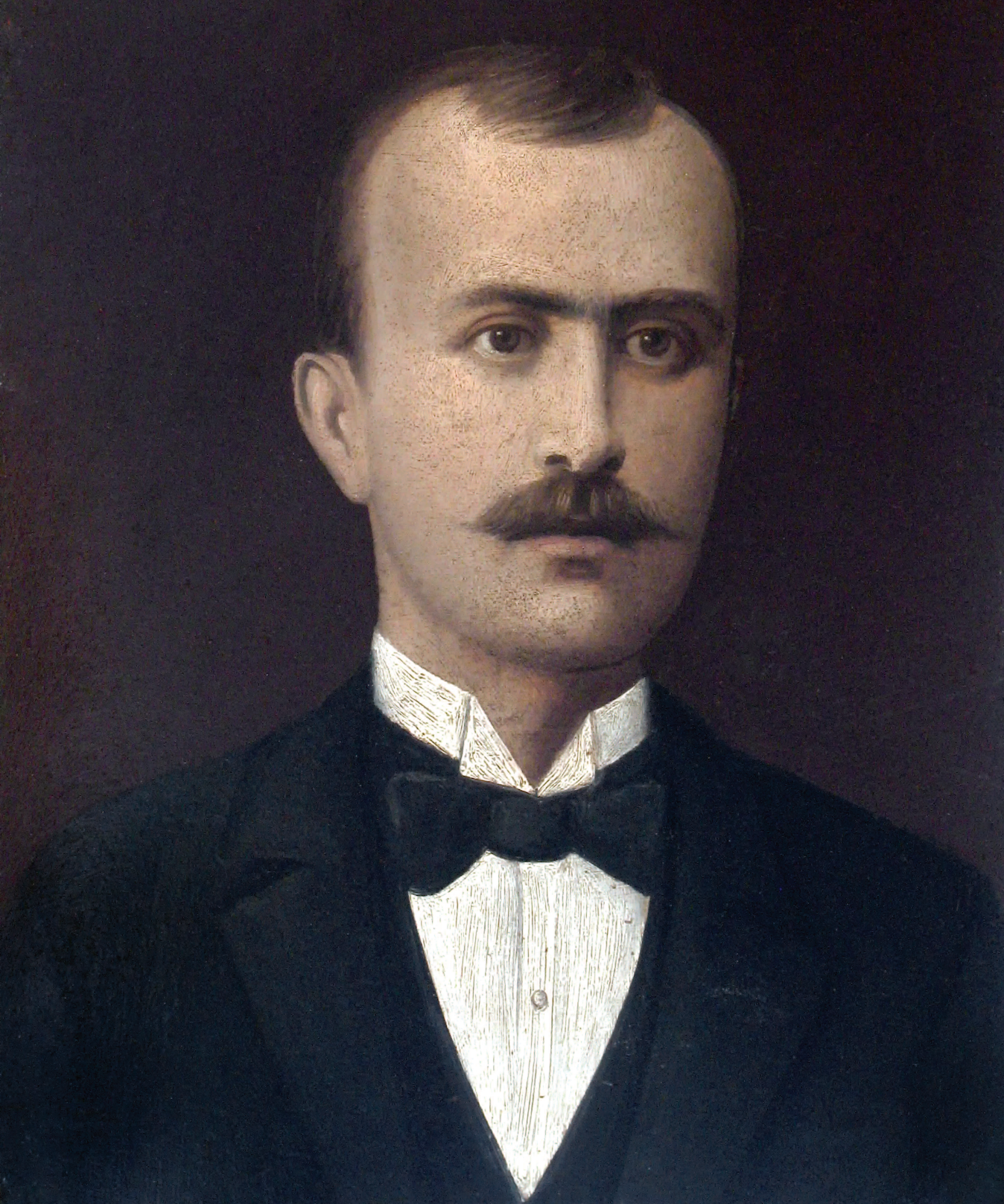
ДИМИТАР АНДОНОВ ПАПРАДИШКИ / DIMITAR ANDONOV PAPRADISHKI / DIMITAR ANDONOV PAPRADISHKI Портрет на Ангелко Андонов 1900/1 Portreti i Angjellko Andonov Portrait of Angelko Andonov