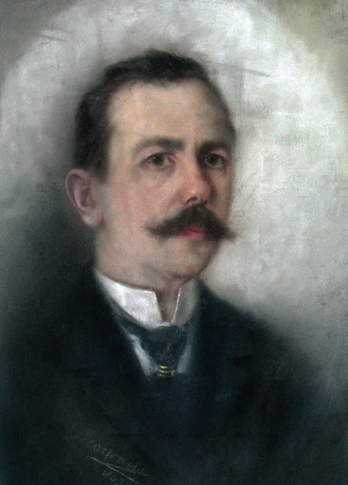
КОСТА ШКОДРЕАНУ KOSTA SHKODREANU KOSTA SKODREANU Автопортрет, 1902 Autoportret Self-Portrait