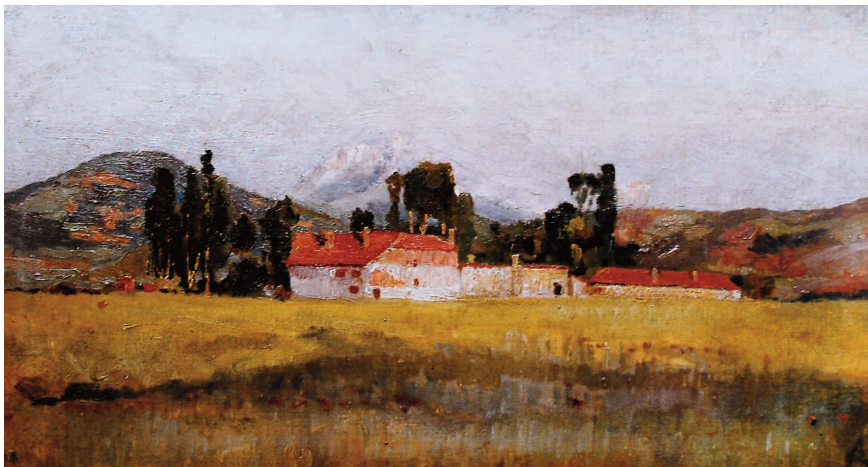
ДИМИТАР АНДОНОВ ПАПРАДИШКИ / DIMITAR ANDONOV PAPRADISHKI / DIMITAR ANDONOV PAPRADISHKI