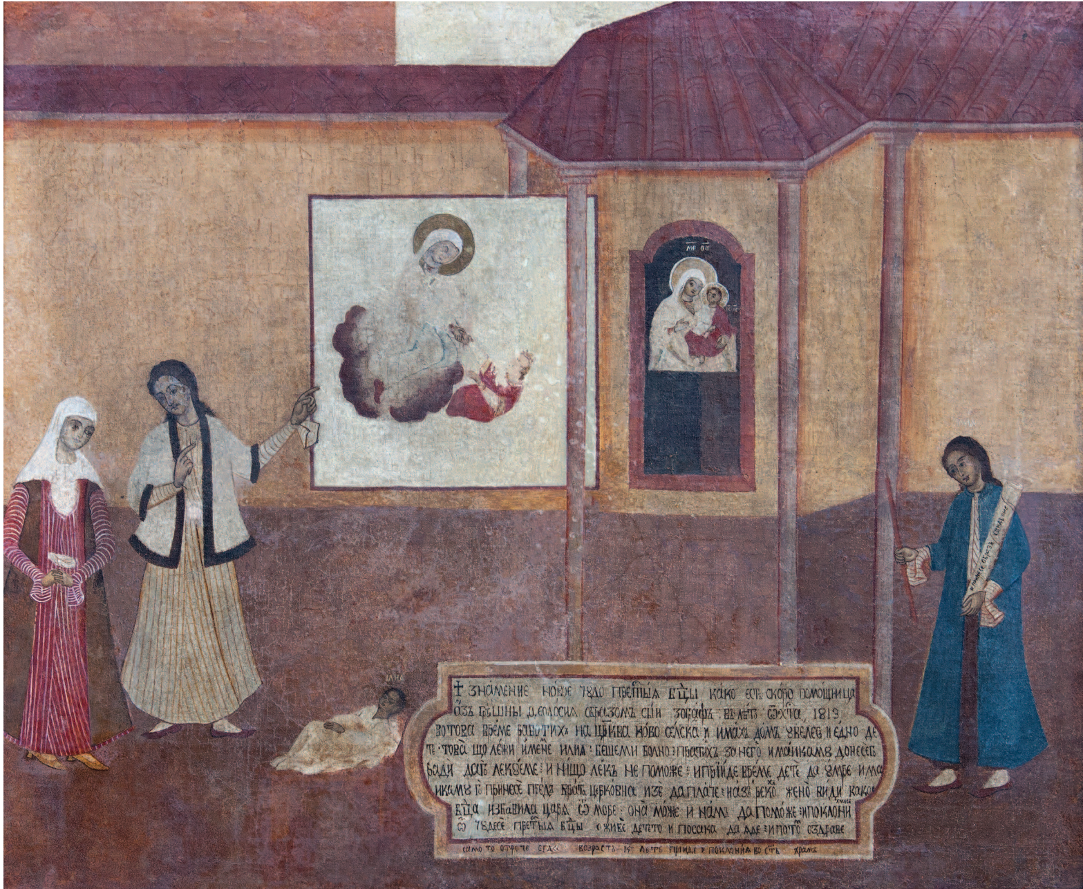
ТЕОДОСИЈ ЗОГРАФ / TEODOSIJ ZOGRAF / THEODOSY ZOGRAPH

Појавата на новото чудо на Пресвета Богородица / Shfaqja e mrekullisë së re të Shën Mërisë / The Appearance of the New Miracle of the Holy Virgin, 1813 (1828)