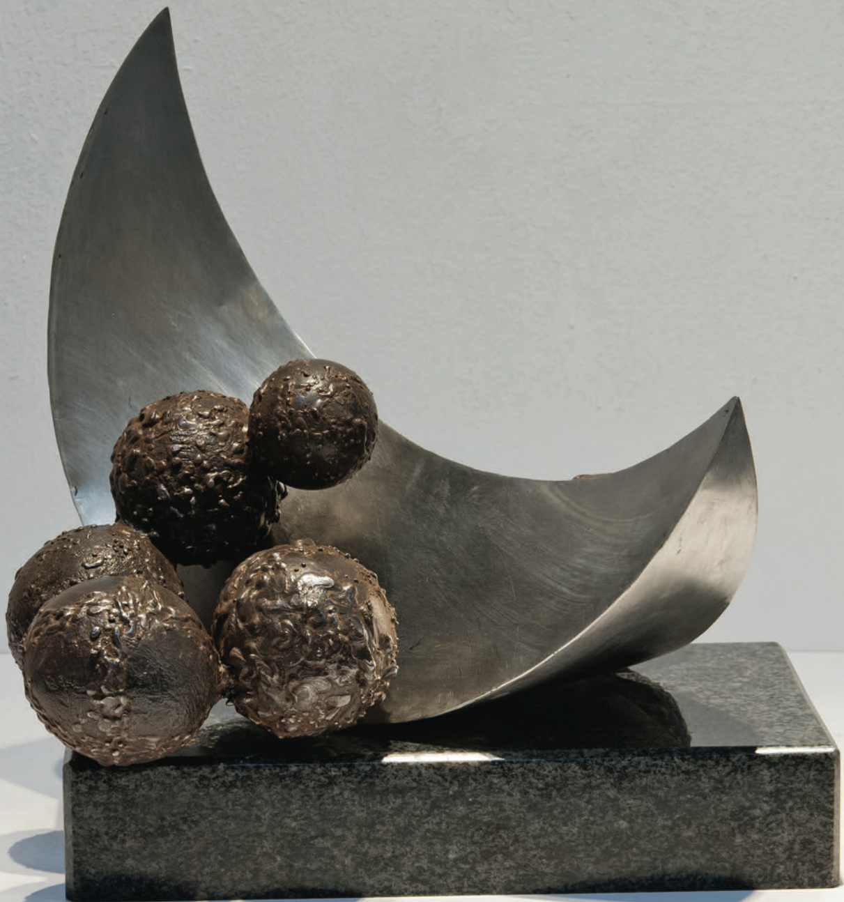
Мртва природа / Natyra e qetë / Still life, 2003

железо, инокс и гранит / hekur, inoks dhe granit / iron, stainless steel and granite, 34,5x31x31 cm