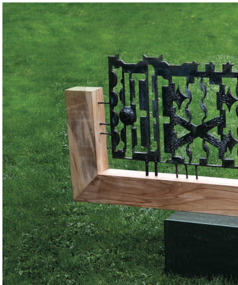
Игра на форми / Lojë formash / Play of forms, 2013, желез