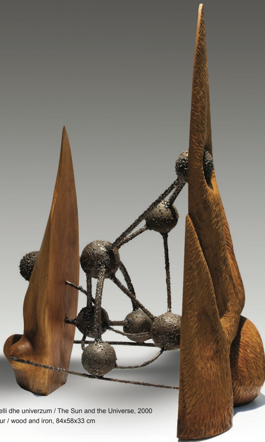
Сонцето и универзумот / Dielli dhe univerzum / The Sun and the Universe, 2000 дрво и железо / dru dhe hekur / wood and iron, 84x58x33 cm