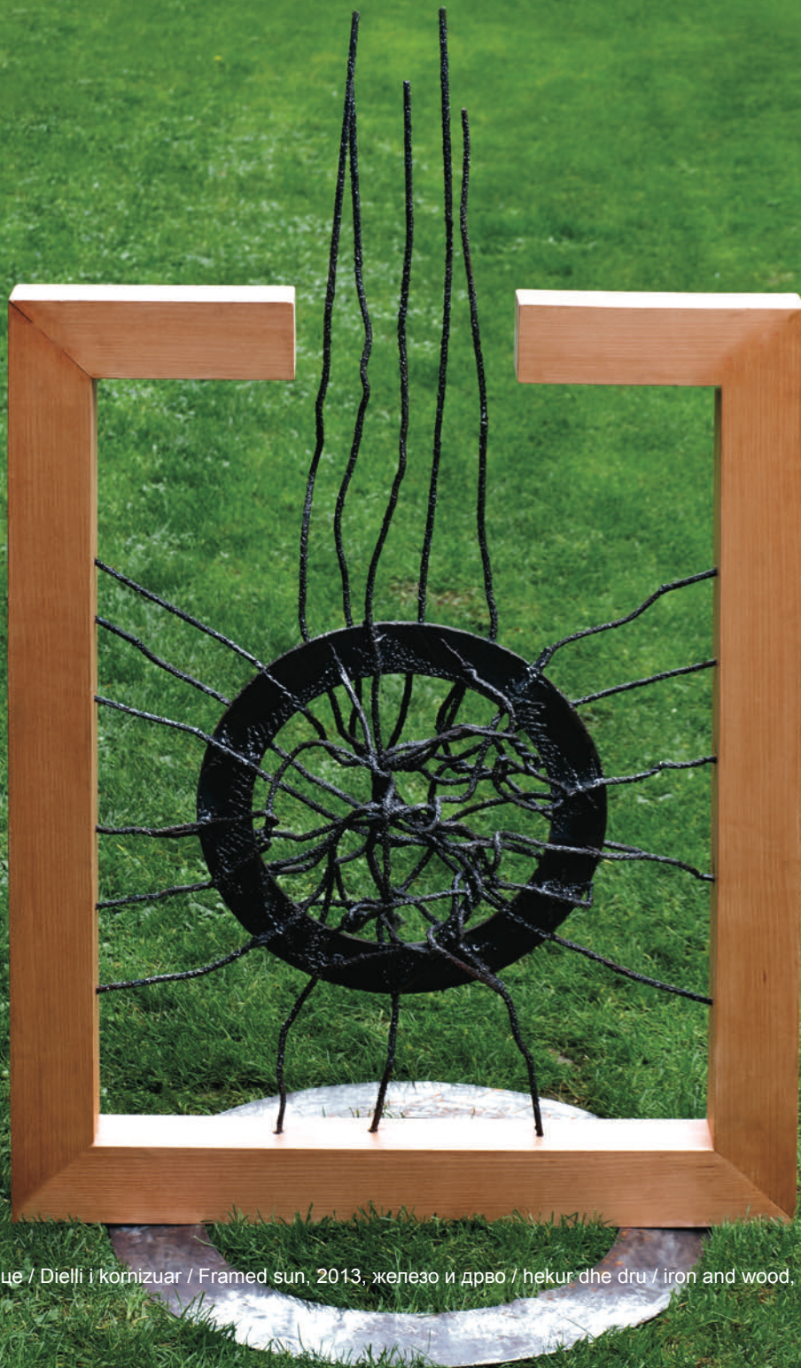
Враменото сонце / Dielli i kornizuar / Framed sun, 2013, железо и дрво / hekur dhe dru / iron and wood, 158x105x22 cm