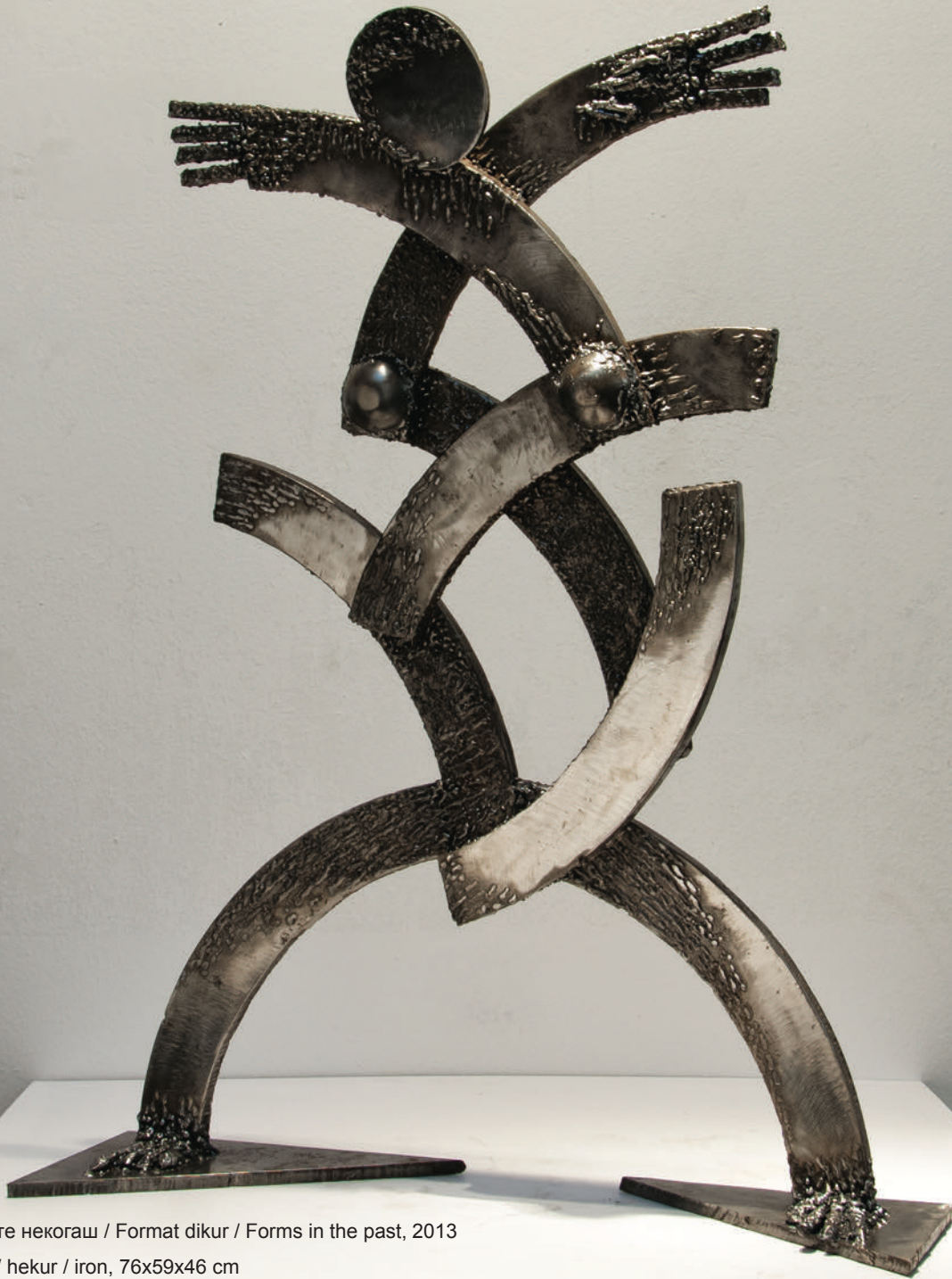
Облиците некогаш / Format dikur / Forms in the past, 2013 железо / hekur / iron, 76x59x46 cm