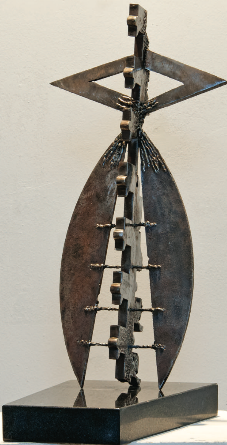
Традиција / Tradita / Tradition, 2013 железо и гранит / hekur dhe granit iron and granite, 65x40x25 cm