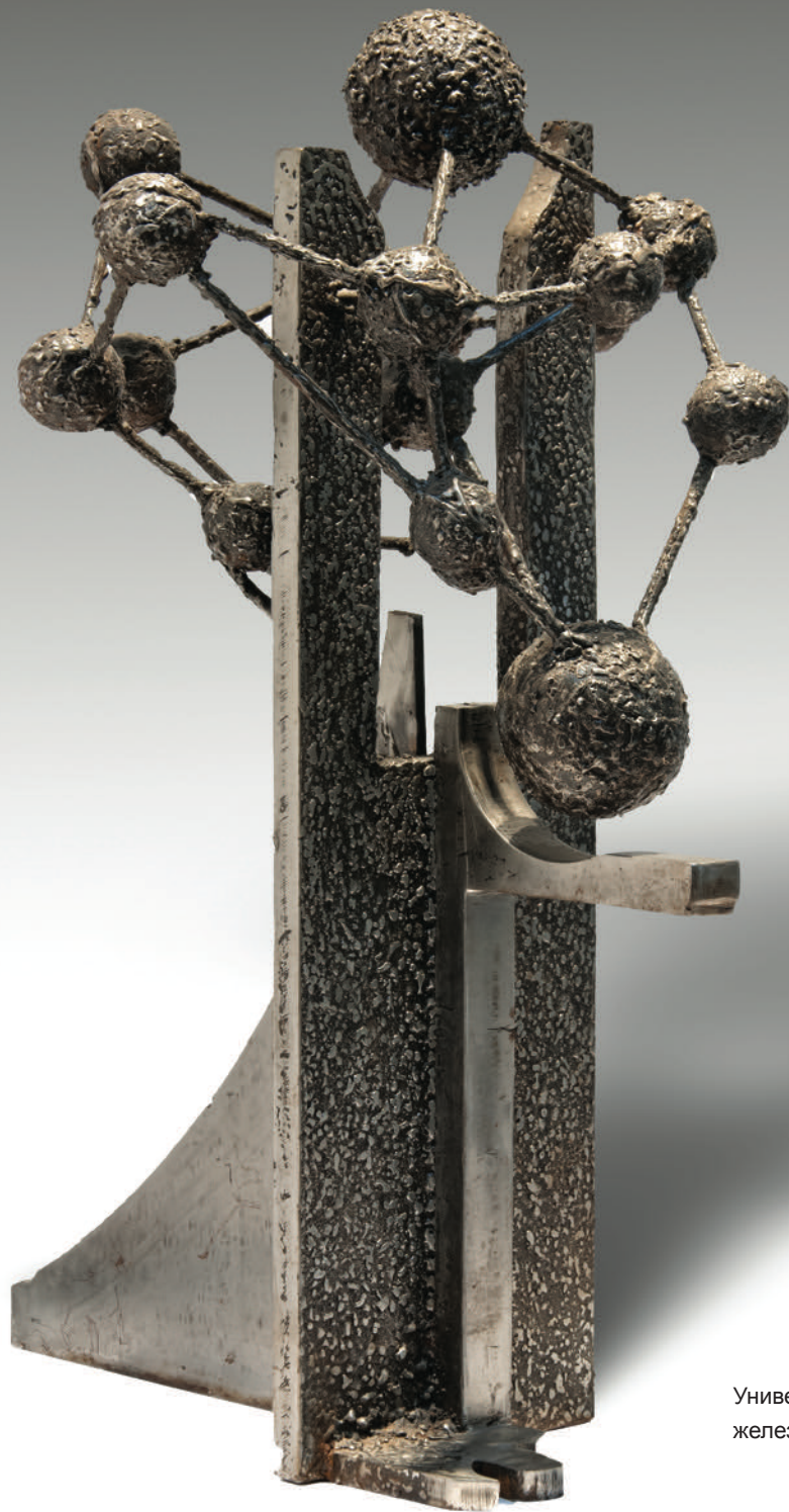
Универзум / Univerzumi / Universe, 2002 железо / hekur / iron, 63x43x33 cm