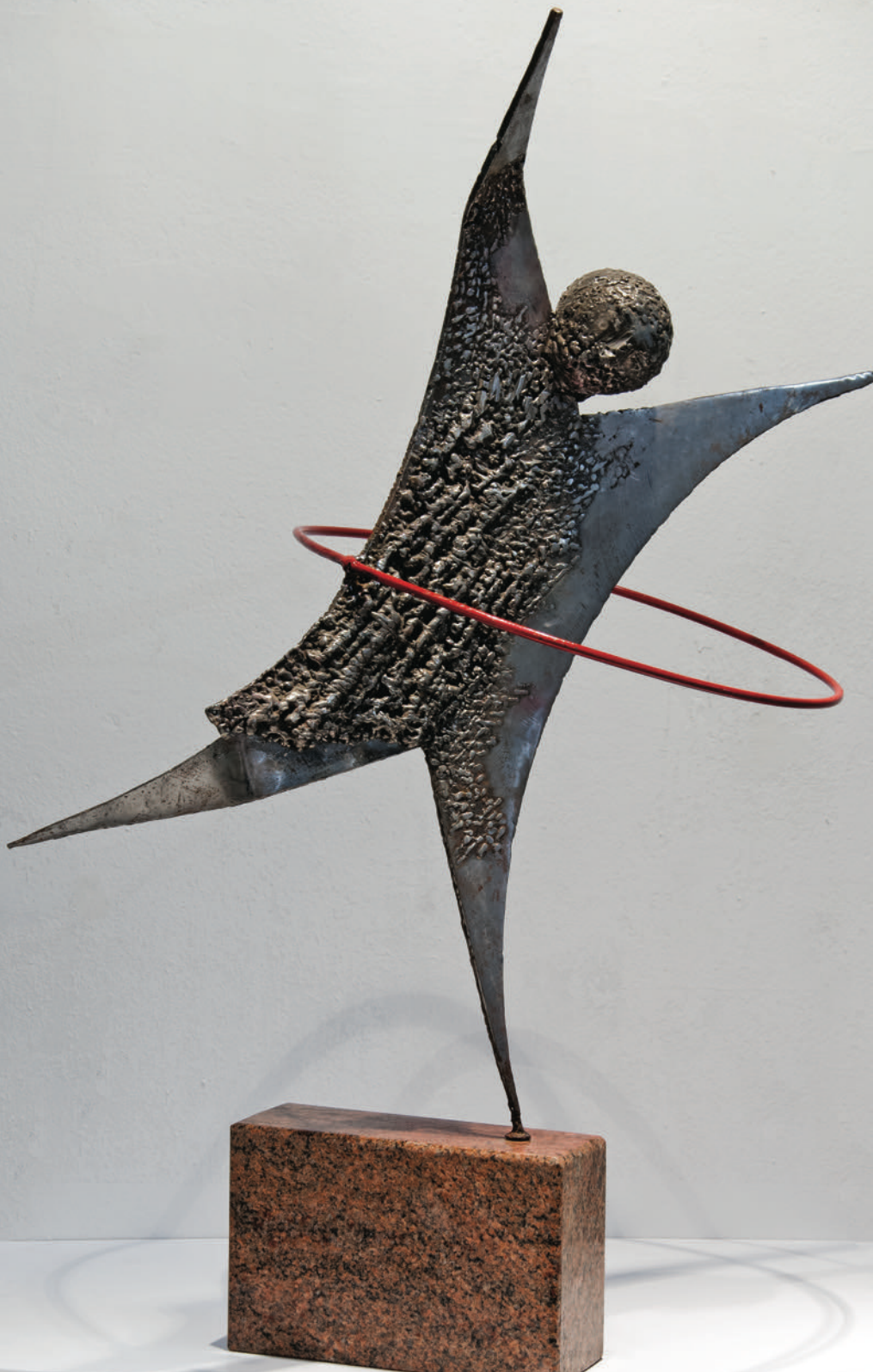
Танчарка / Valltarja / Dancer, 2000 железо и гранит / hekur dhe granit iron and granite, 86x66x38 cm