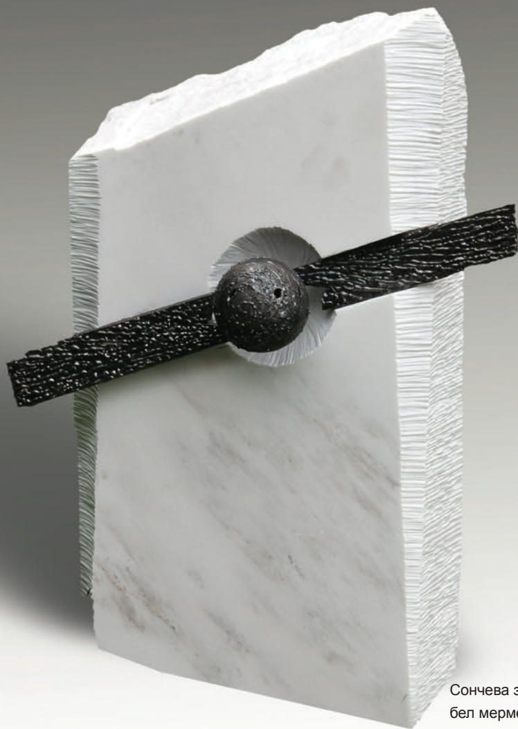
Сончева зеница / Bebëza e bebzë / Sun pupill , 2013 бел мермер и железо / mermer i bardhë dhe hekur / white marble and iron , 62x50x20 cm