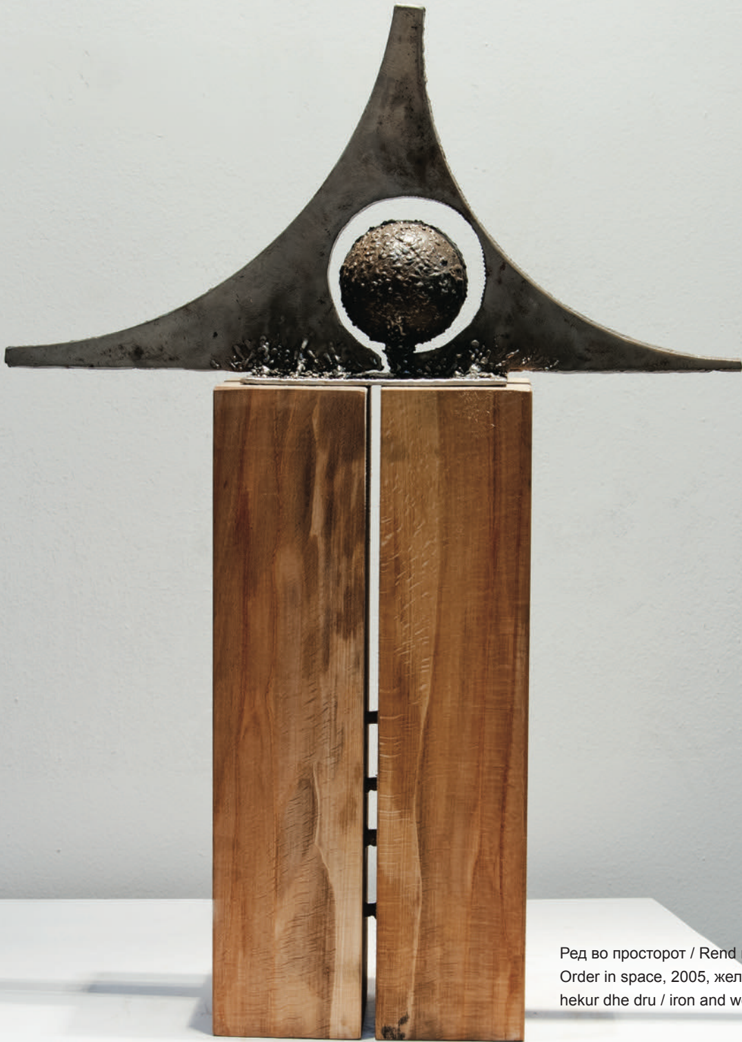
Ред во просторот / Rend në hapësirë Order in space, 2005, железо и дрво hekur dhe dru / iron and wood, 79x57x14 cm