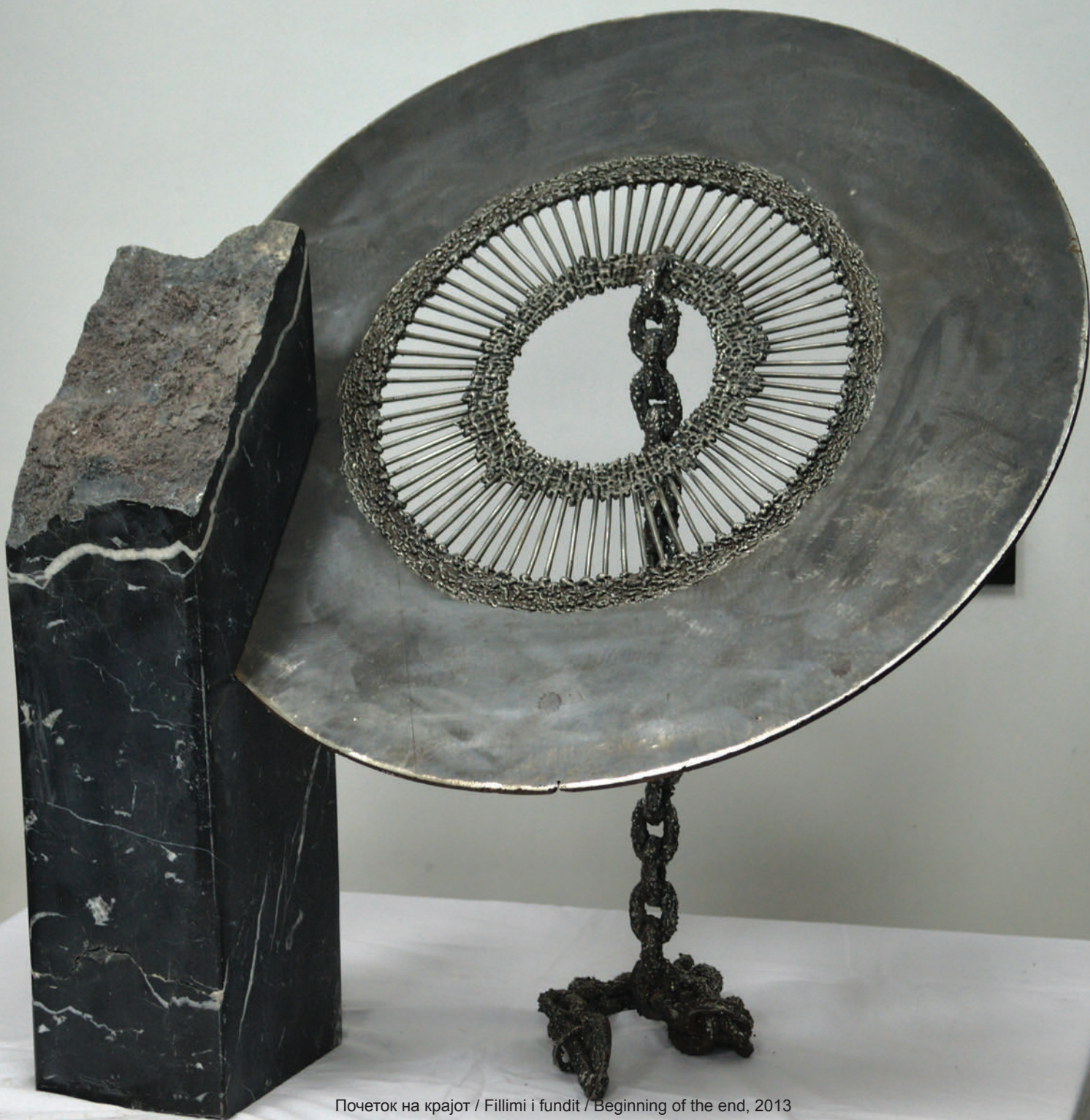
Почеток на крајот / Fillimi i fundit / Beginning of the end, 2013 железо и црн мермер / hekur dhe mermer i zi / iron and black marble, 77x72x67 cm