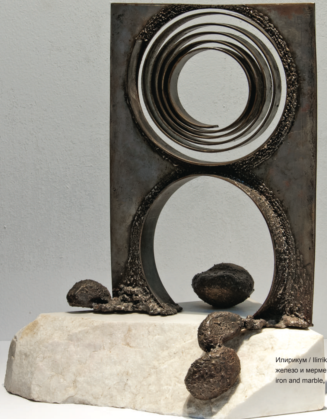
Илирикум / Ilirikum / Illyricum, 2005 железо и мермер / hekur dhe mermer iron and marble, 56x45x30 cm