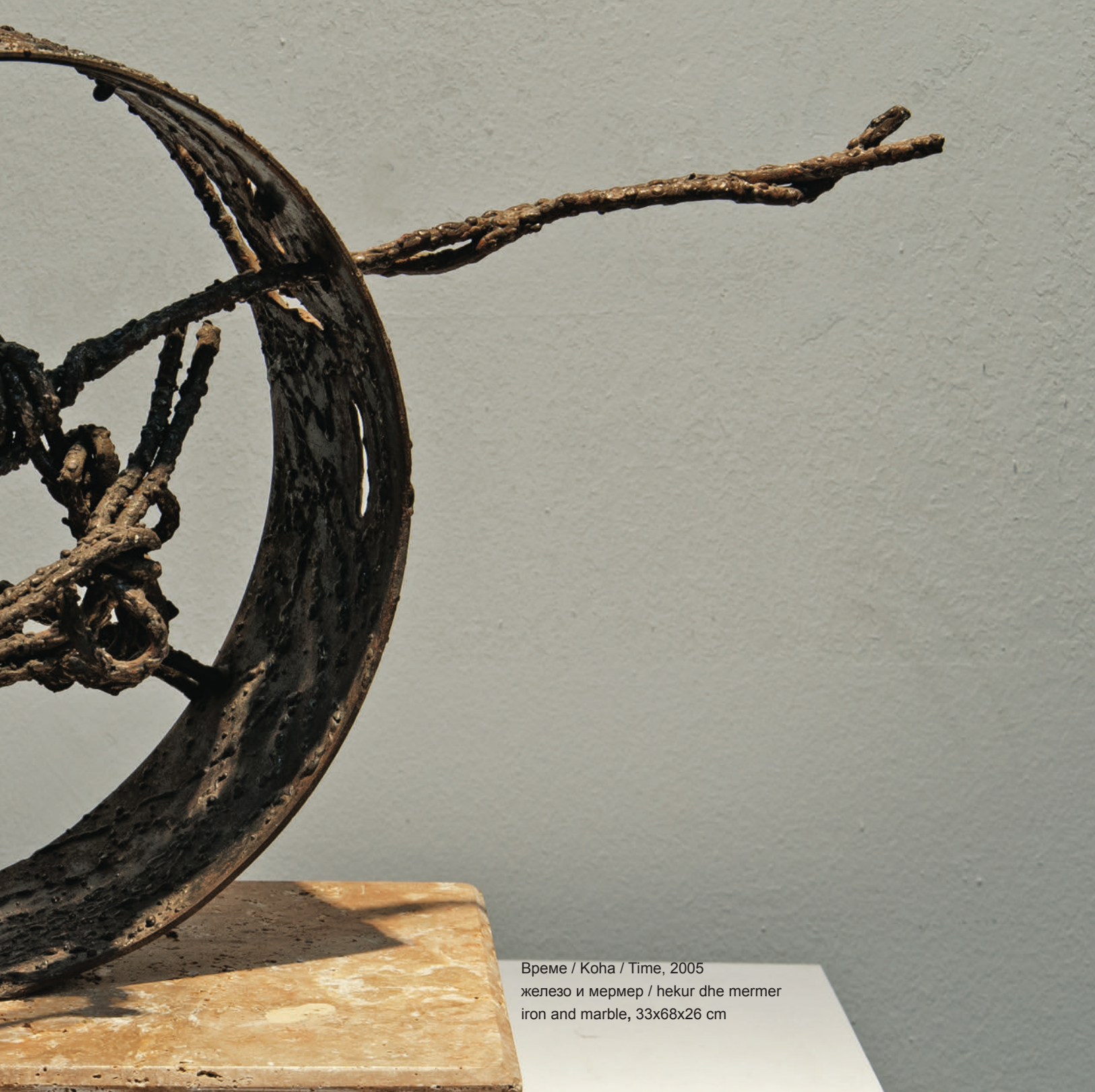
Време / Koha / Time, 2005 железо и мермер / hekur dhe mermer iron and marble, 33x68x26 cm