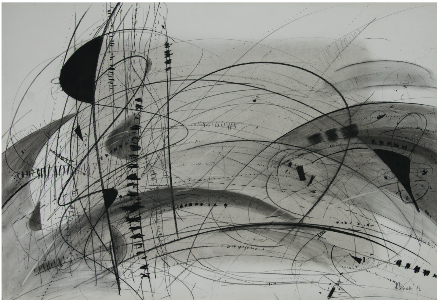
Од циклусот Асоцијации / From the Cycle Associations , 2012 јаглен / charcoal, 70x100 cm