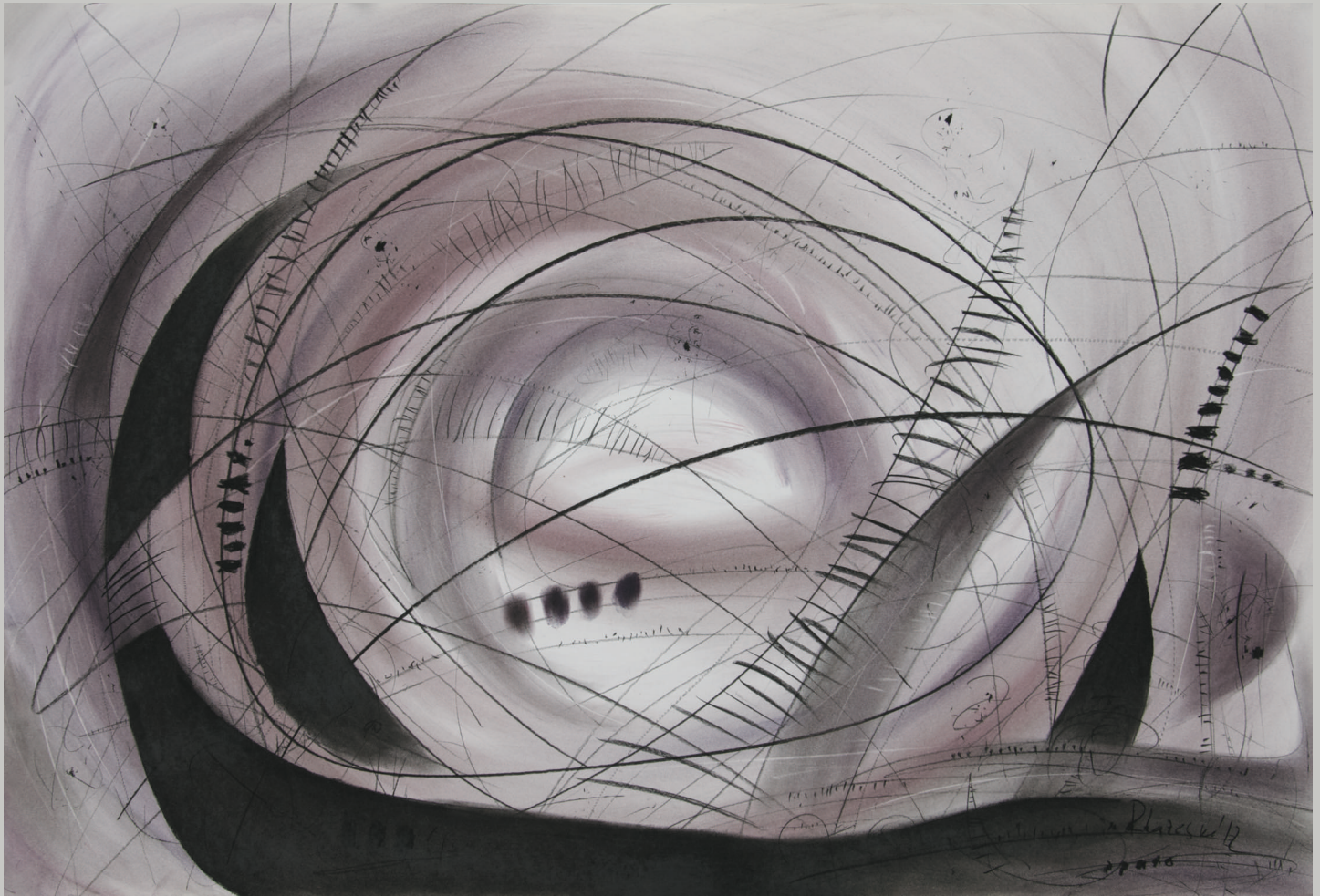
Од циклусот Асоцијации / From the Cycle Associations , 2012 јаглен и пастел / charcoal and pastel, 70x100 cm