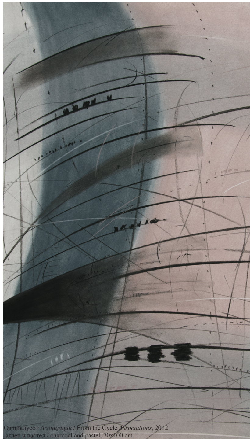
Од циклусот Асоцијации / From the Cycle Associations , 2012 јаглен и пастел / charcoal and pastel, 70x100 cm