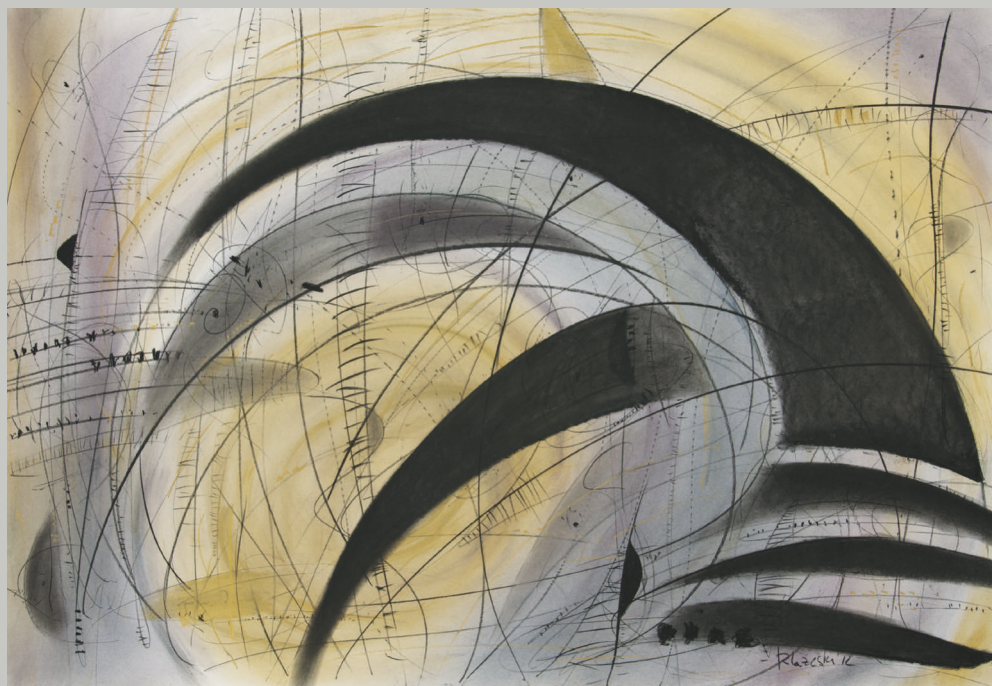
Од циклусот Асоцијации / From the Cycle Associations , 2012 јаглен и пастел / charcoal and pastel, 70x100 cm