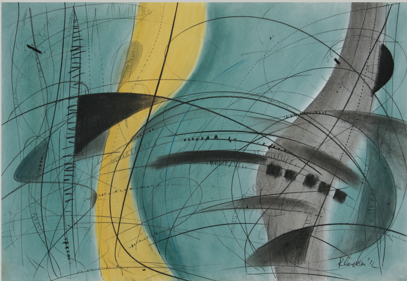
Од циклусот Асоцијации / From the Cycle Associations, 2012 јаглен и пастел / charcoal and pastel, 70x100 cm