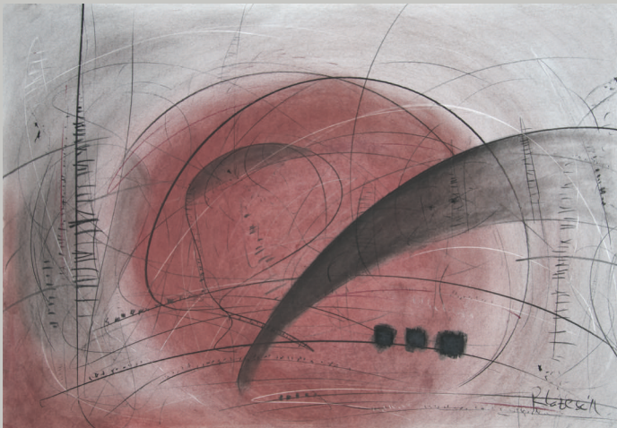
Од циклусот Асоцијации / From the Cycle Associations , 2012 јаглен и пастел / charcoal and pastel, 70x100 cm

Линијата во нејзините дела е во исто време силна и лирична, моќна и нежна, динамична и смирена, апстрактна и наративна. Овој иреален ликовен свет на спонтани, брзи, непосредни линии е во директна корелација со графички третираните форми и тонски решенија, од чија привидна меѓусебна спротивност се раѓа природна урамнотеженост и богатство, што го карактеризира специфичниот ликовен израз на Росица Лазеска.