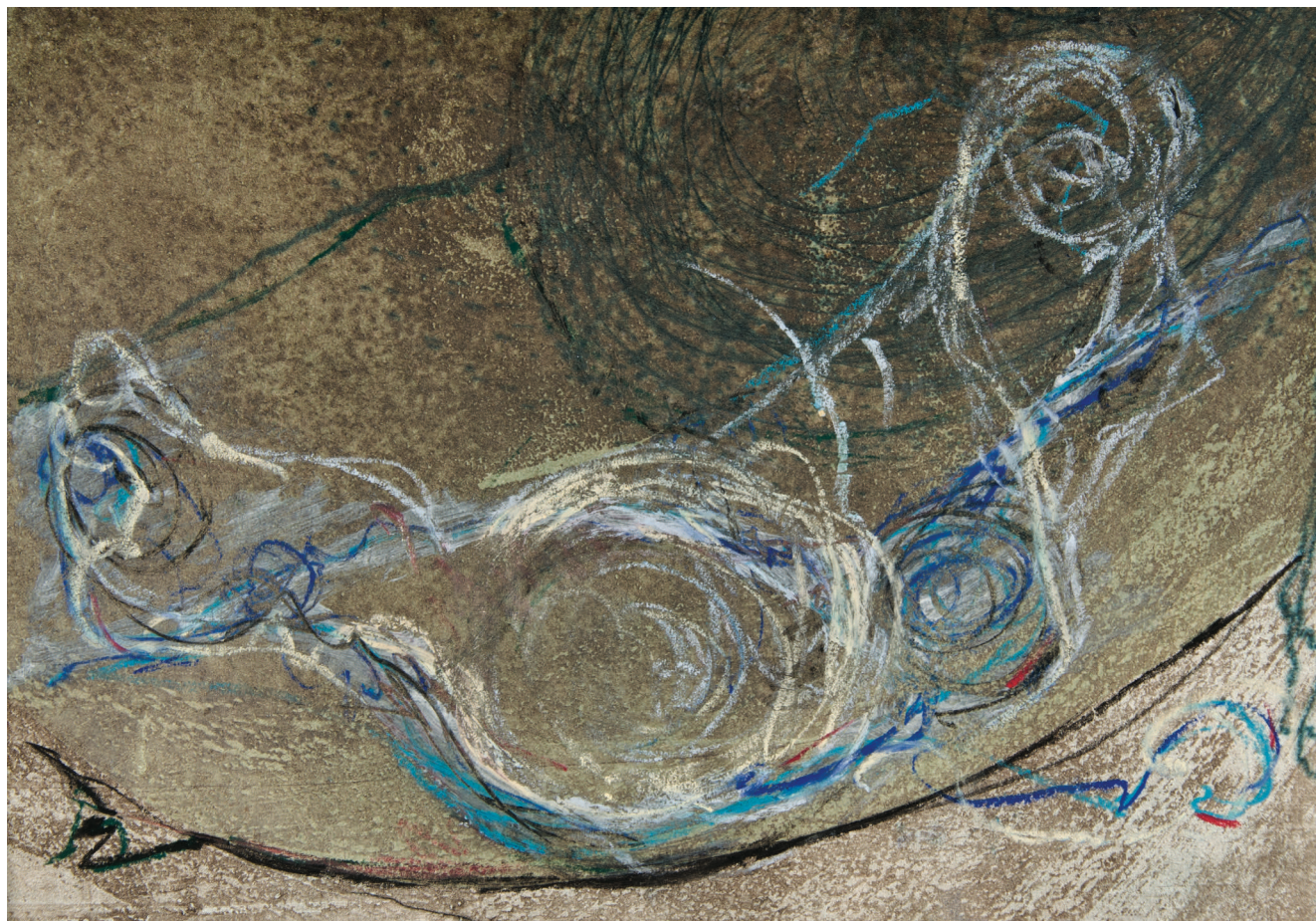
Без наслов, 2012, комбинирана техника на хартија Untitled, 2012, mixed media on paper