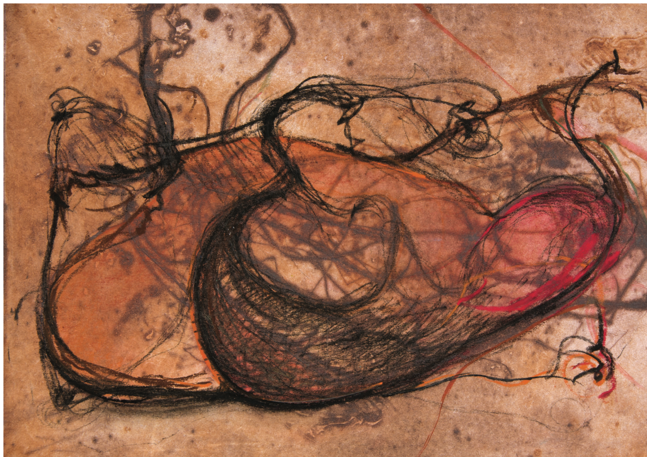
Без наслов, 2012, комбинирана техника на хартија Untitled, 2012, mixed media on paper