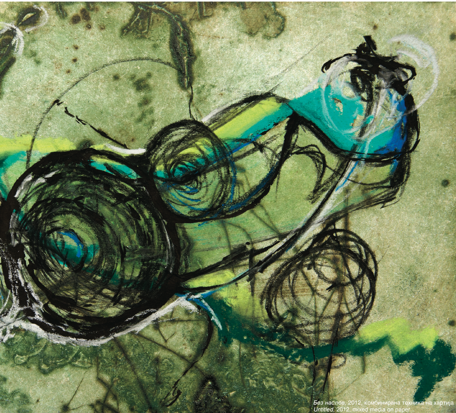
Без наслов, 2012, комбинирана техника на хартија Untitled, 2012, mixed media on paper