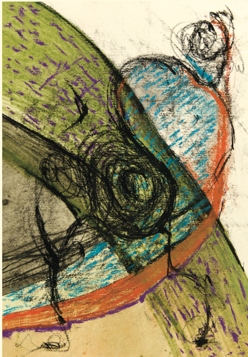
Без наслов, 2012, комбинирана техника на хартија Untitled, 2012, mixed media on paper