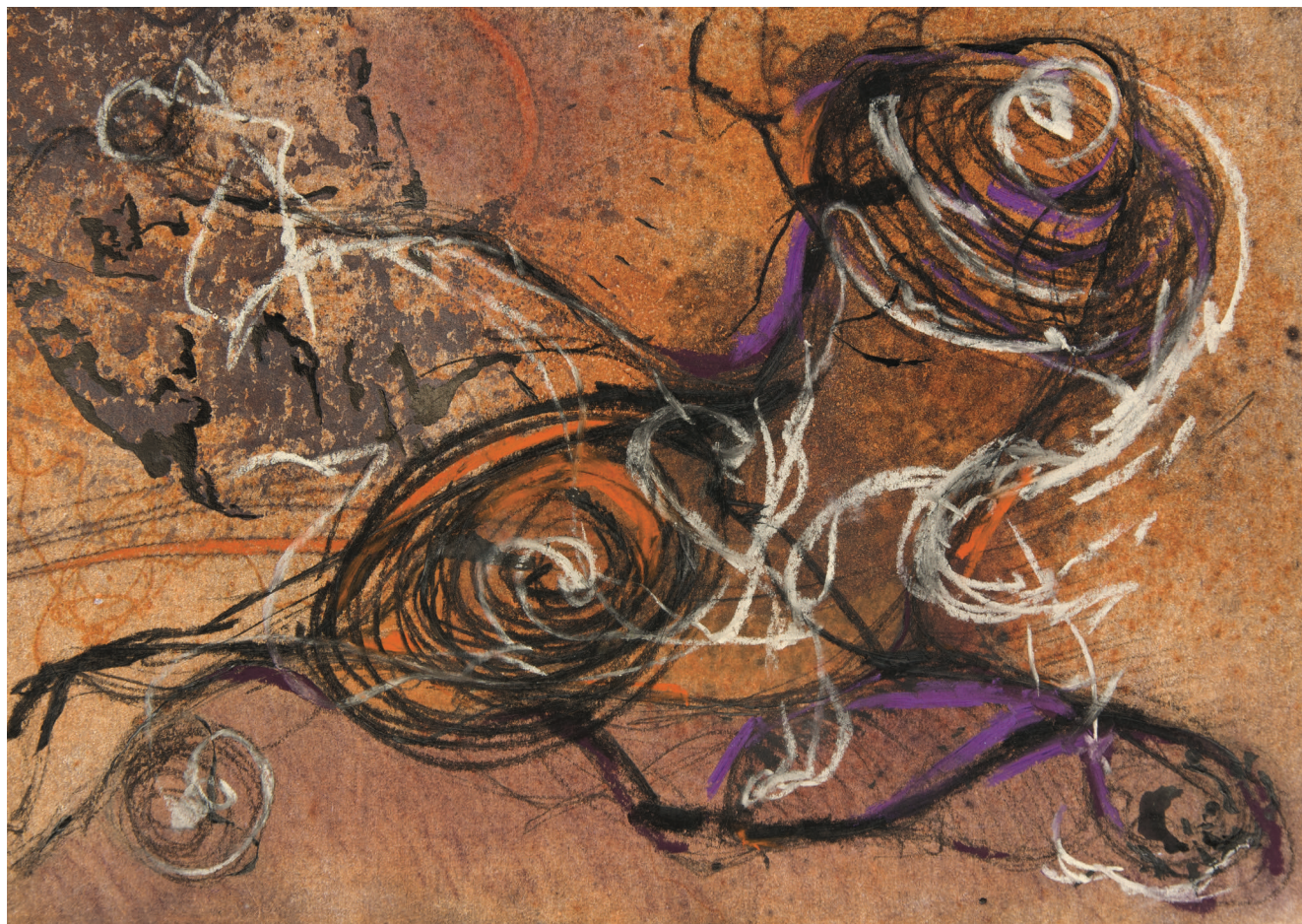
Без наслов, 2012, комбинирана техника на хартија Untitled, 2012, mixed media on paper