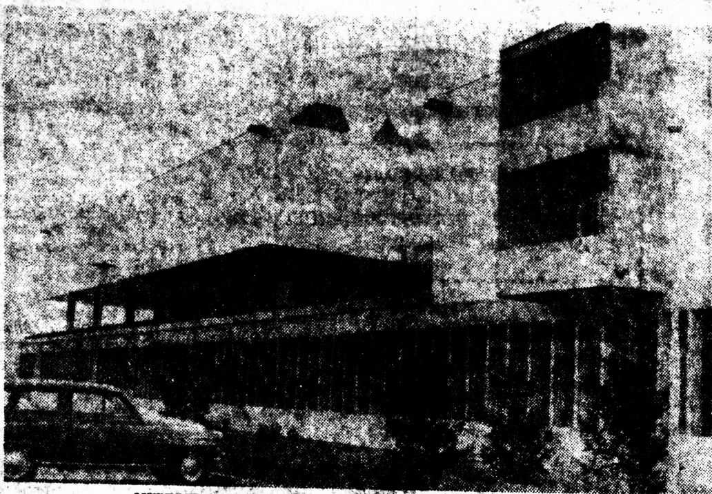
МУЗЕЈОТ НА СОВРЕМЕНАТА УМЕТНОСТ. КОНЕЧНО, СМЕСТЕН ВО ИМПОЗАНТНИОТ ОБЈЕКТ НА КАЛЕТО