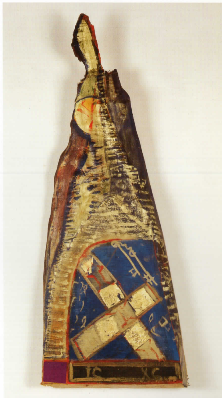
Симнување во ад / Descending to Inferno, 1998