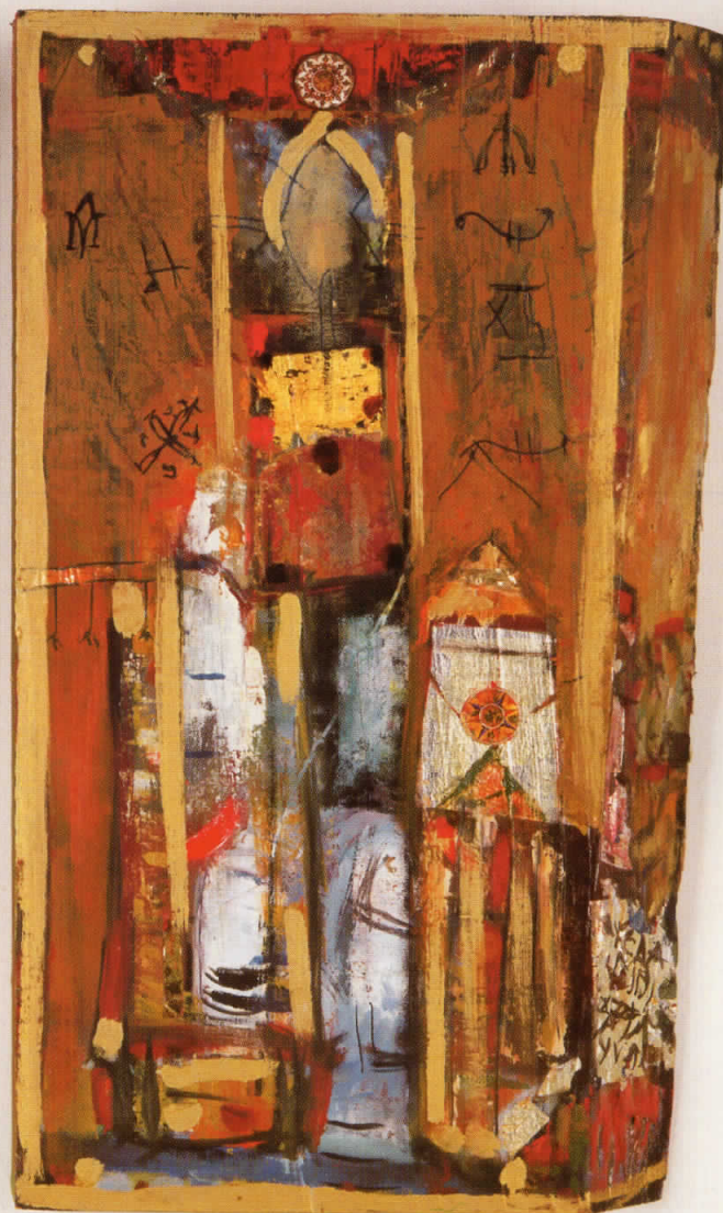
Апостол Тадиј / Apostle Tadius, 1997/98