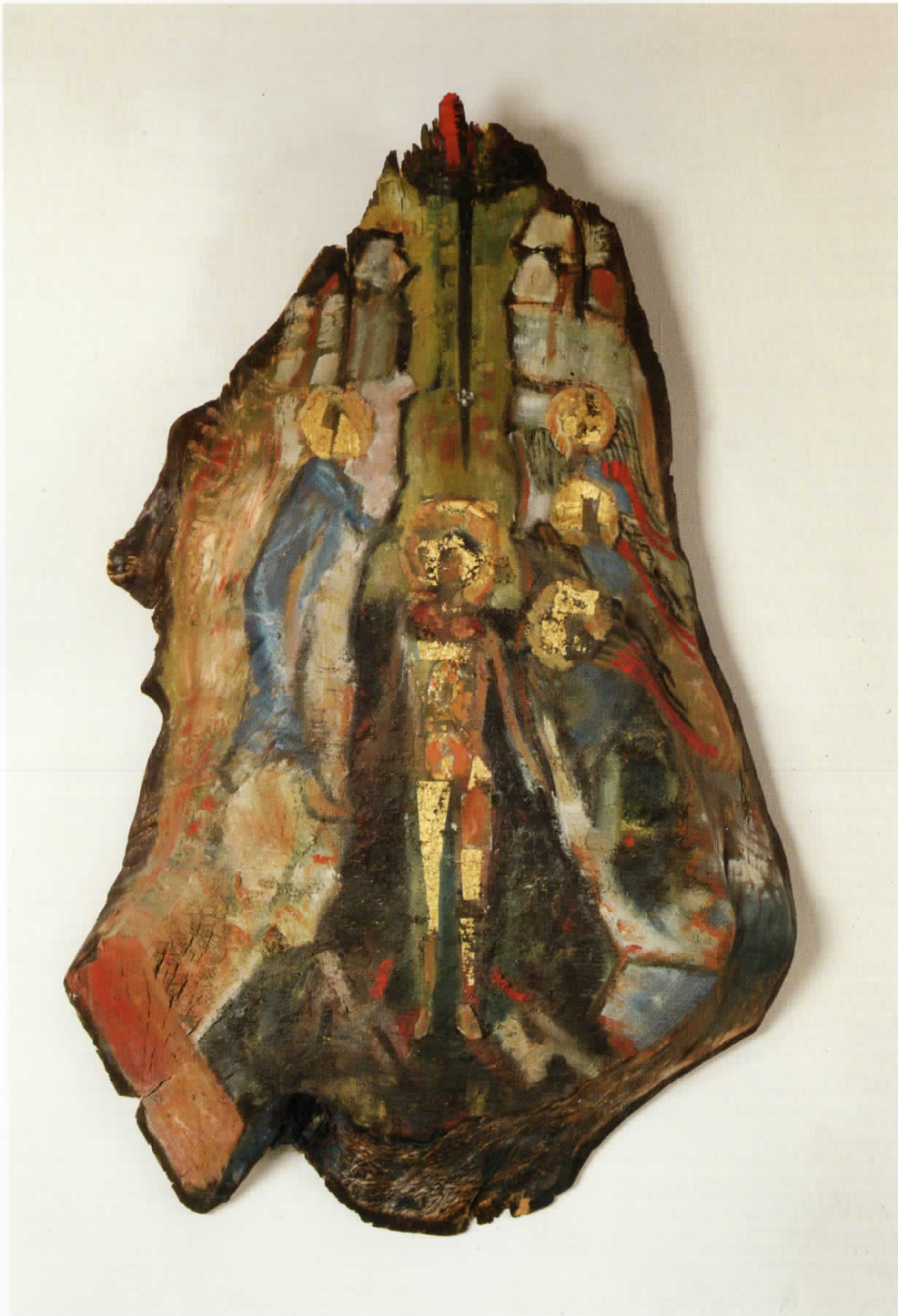
Крштевање Христово / The Baptizing of Christ, 1997