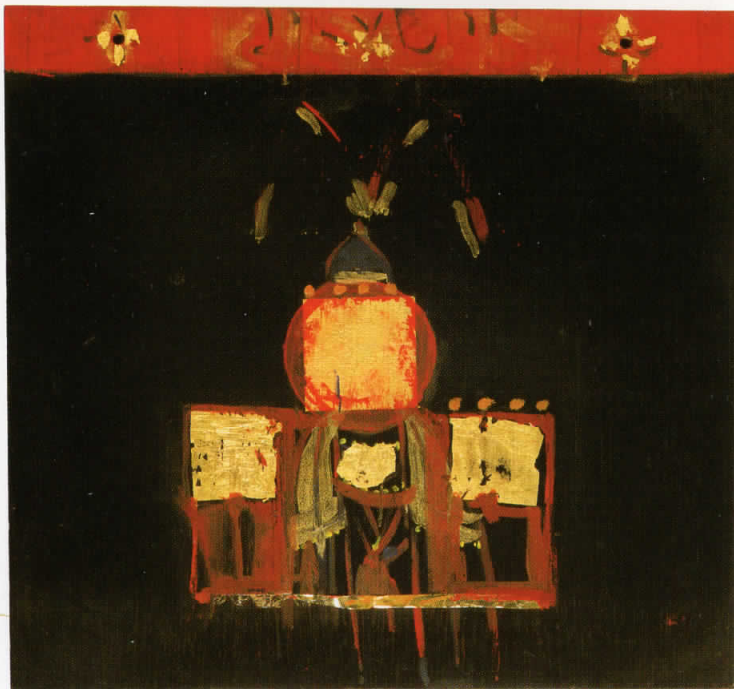
Второ златно доба / The Second Golden Age, 1998