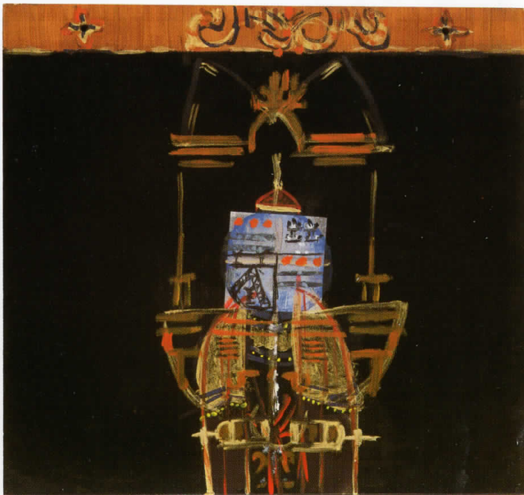
Македонска ренесанса / Macedonian Renaissance, 1998