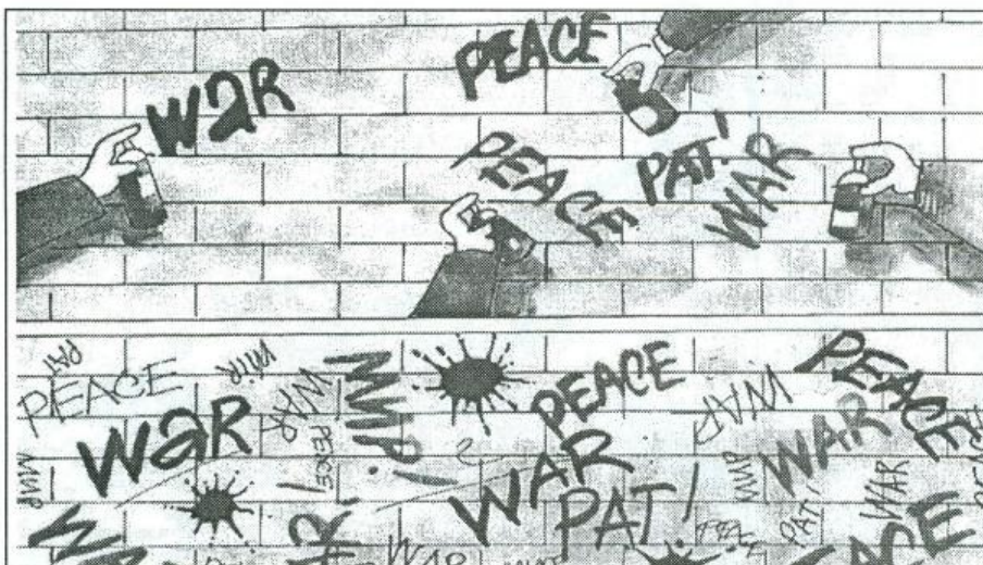
МУХИТИН КОРОГЛУ (ТУРЦИЈА) 35-СВЕТСКА ГАЛЕРИЈА НА КАРИКАТУРИ • 2003 Г.

ги спомнав претходно, а тоа е од жанрот што се опфаќа како тема претежно мирот-против војната и зачувување на човековата околина. Инаку, може да се каже дека се