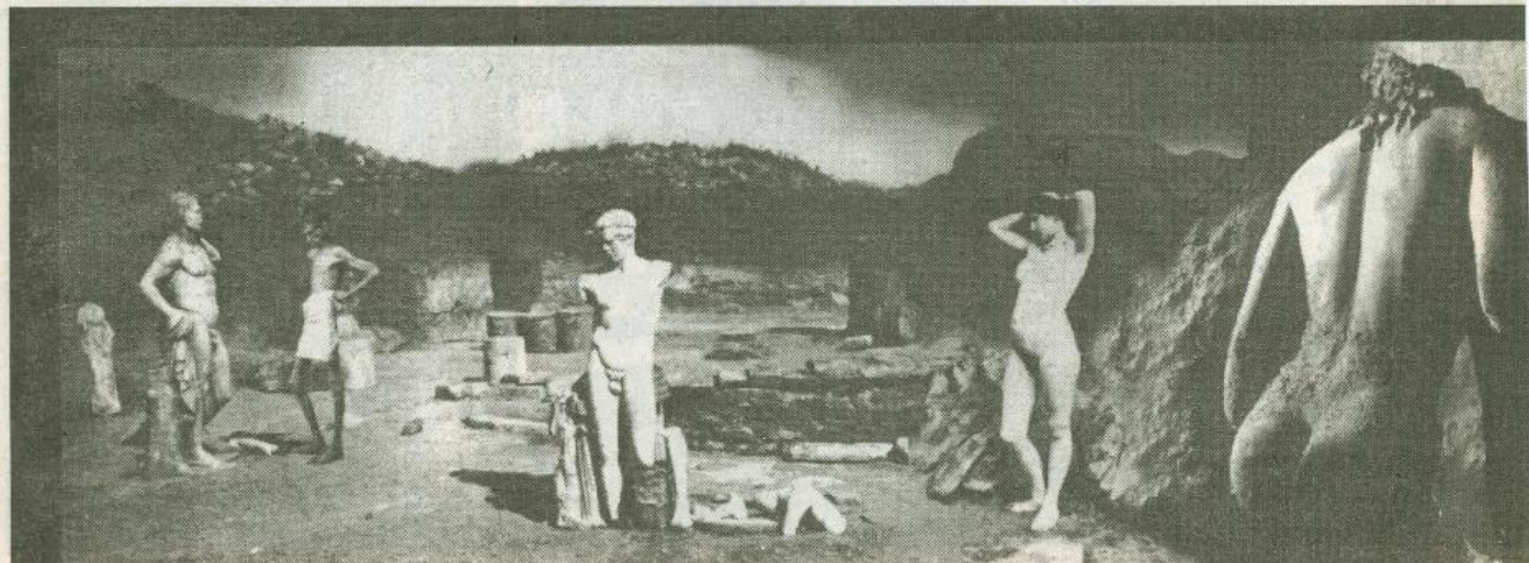
У М Е Т Н О С Т А Е Ф О Р М А Н А К А Т А Р З А