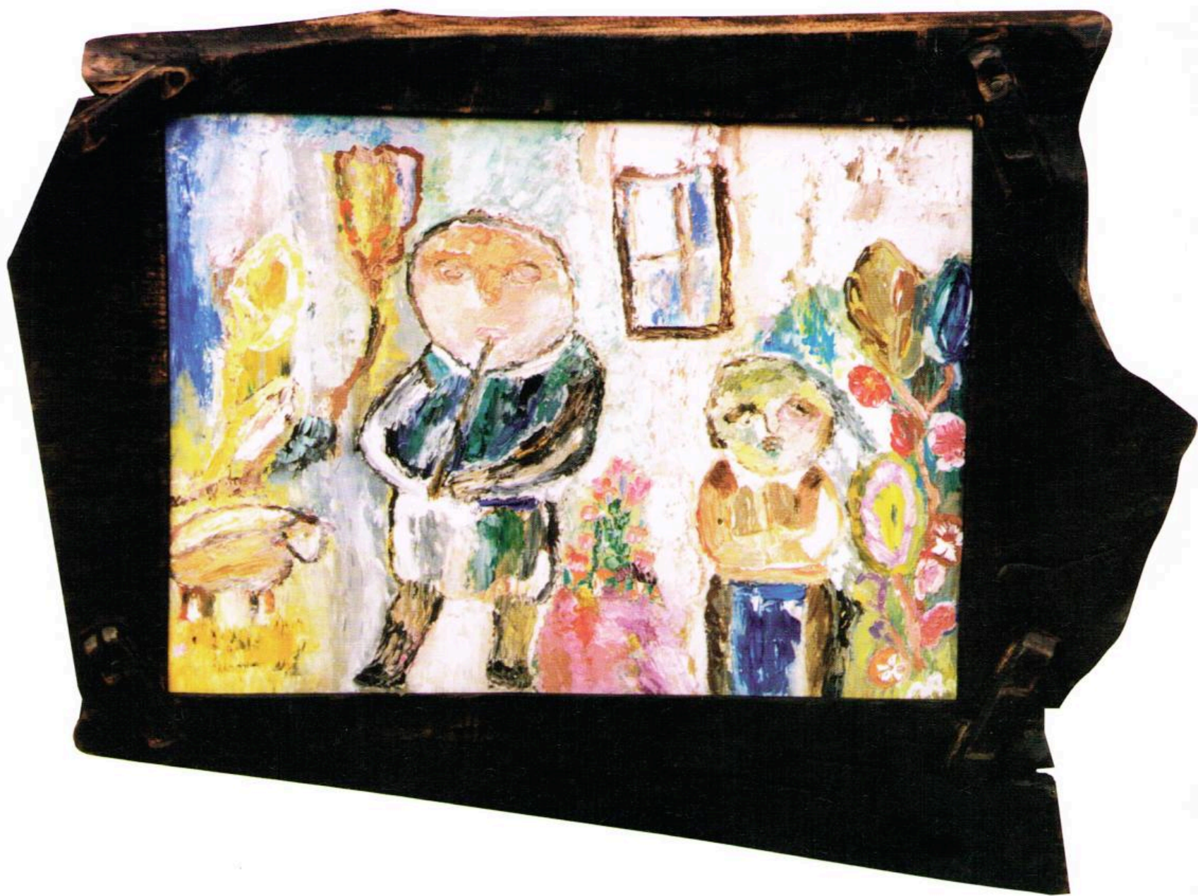
Кар. бр. 1 Cat. No 1