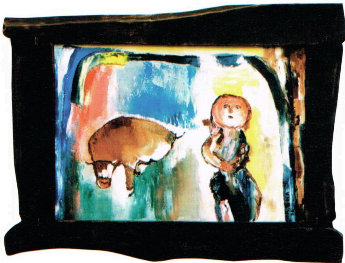
Kat. бр. 13 Cat. No 13