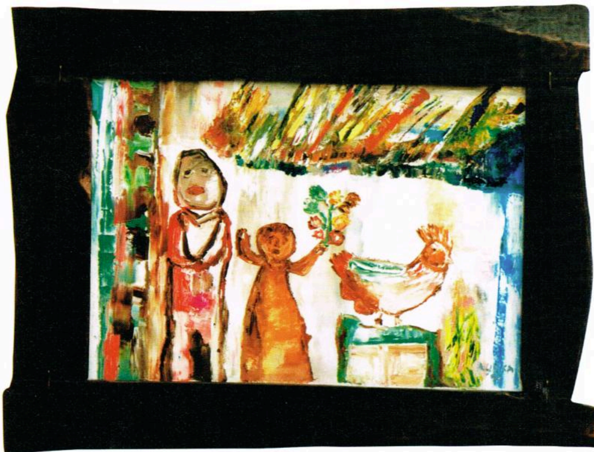
Kat. 6p. 7 Cat. No 7

Ljupka appeared in Macedonian art life in the early 1990s, her style quickly attracting the attention of critics and the public. She exhibited at the Museum of Naive Art in Jagodina for the first time at Seventh of Naive Art, on which occasion the judges awarded her honorary mention for the works exhibited. At this year's Eighth Biennial she drew attention with three of paintings.