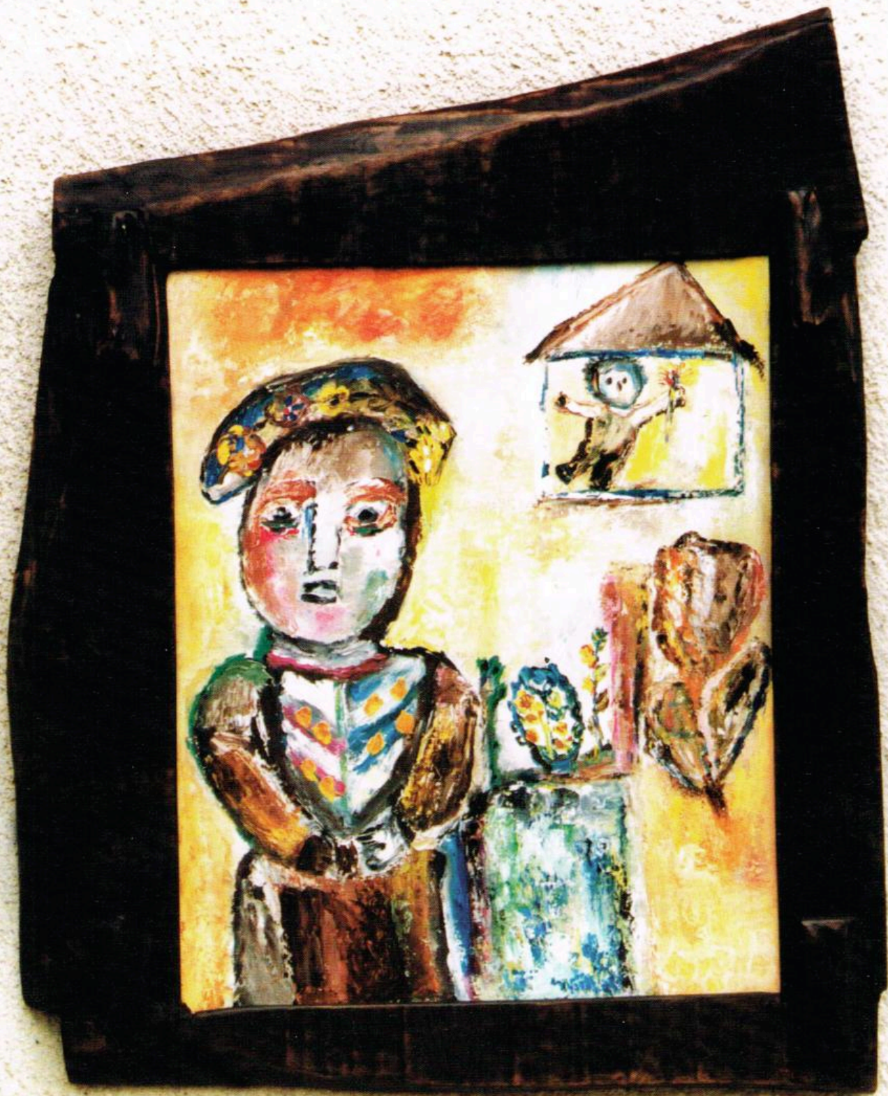
Кар. 6р. 12 Cat. No 12