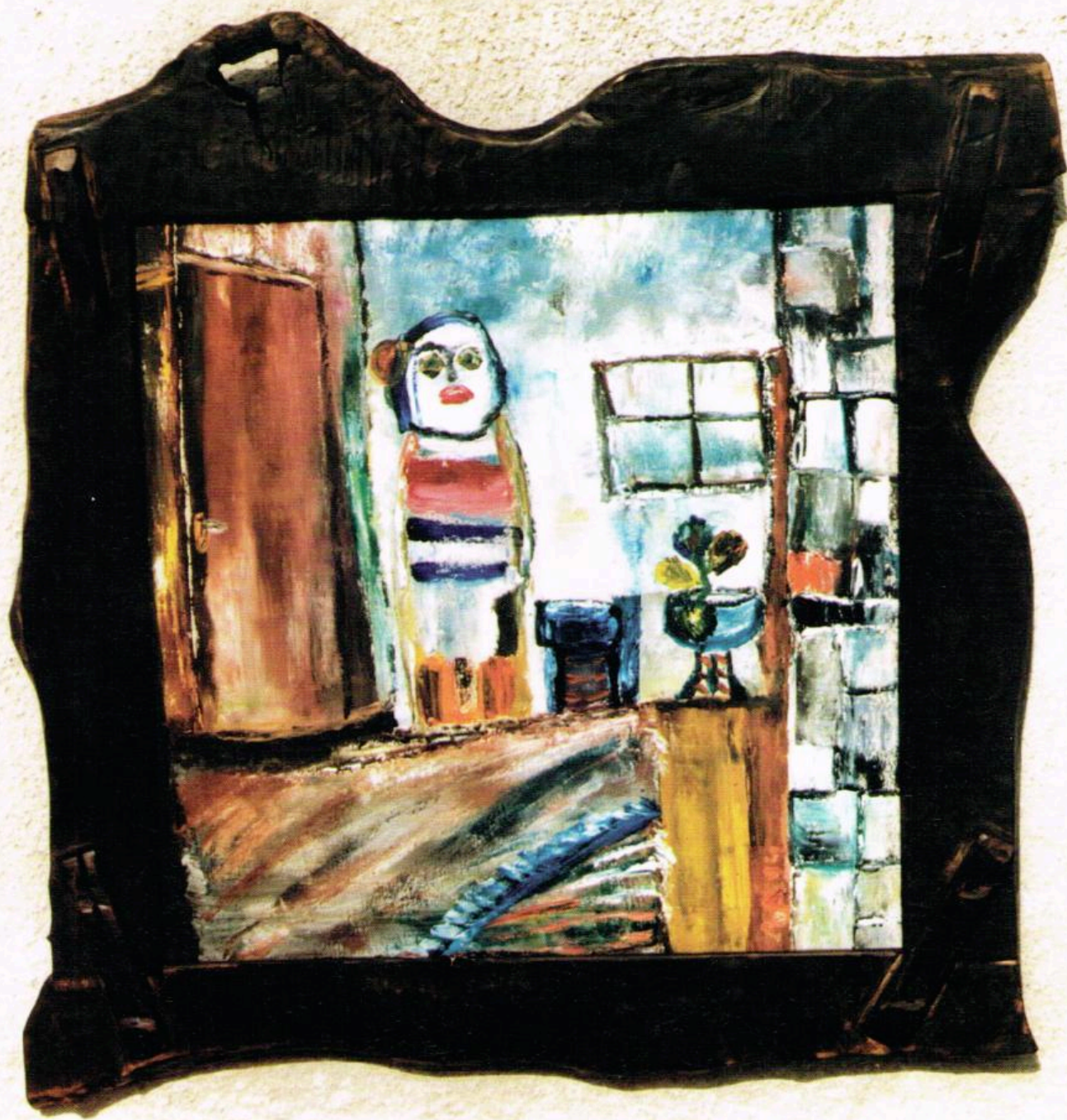
Кат. бр. 5 Cat. No 5