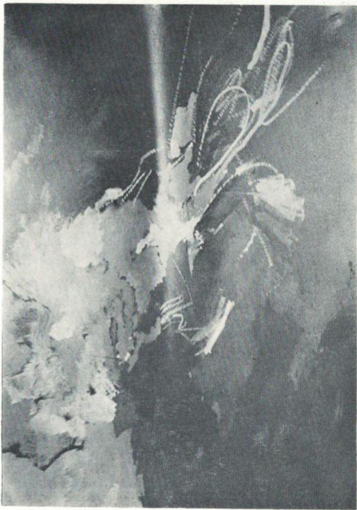
Црно-сиво-сјајна дијагонала, 1986., 96 x 62 x 10 цм