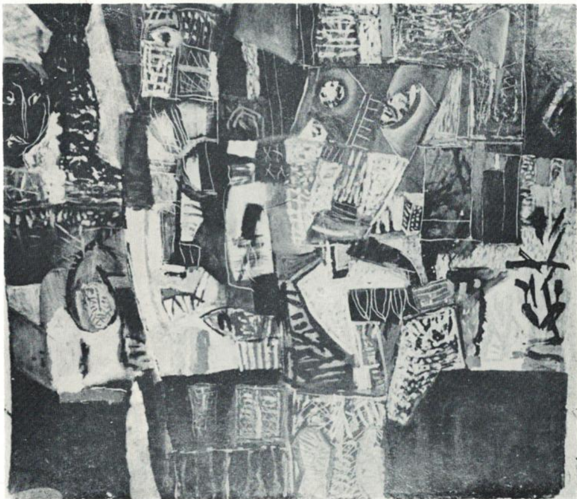
Без наслов, 1985., 70 x 60 цм