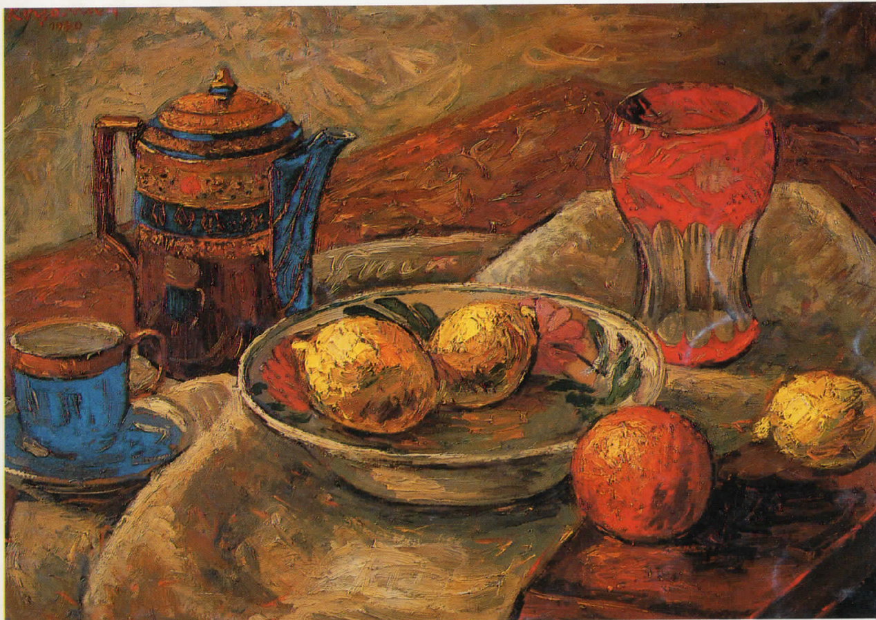
МРТВА ПРИРОДА, 1940