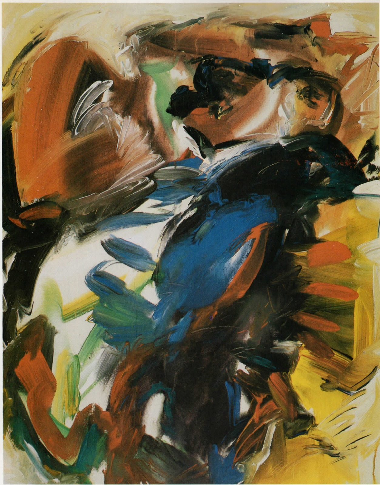
Слика 15, 1991 Від 15, 1991