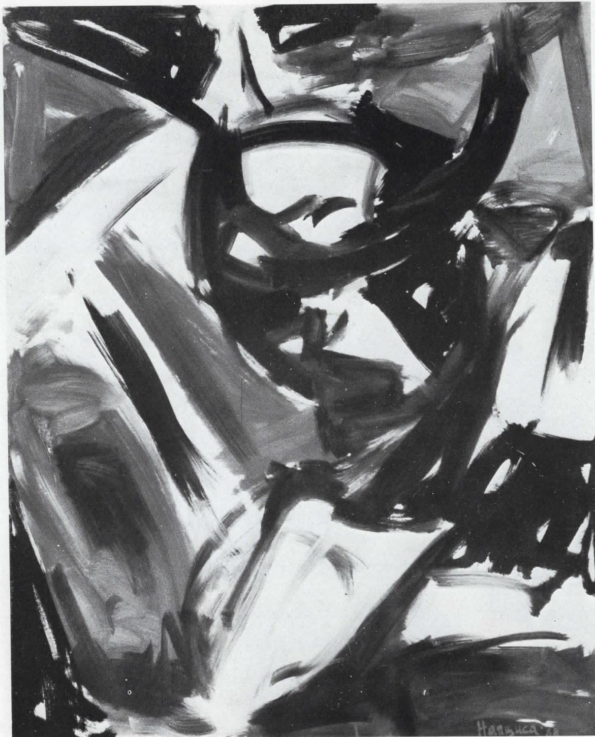
11. „Откинато од развигореното“