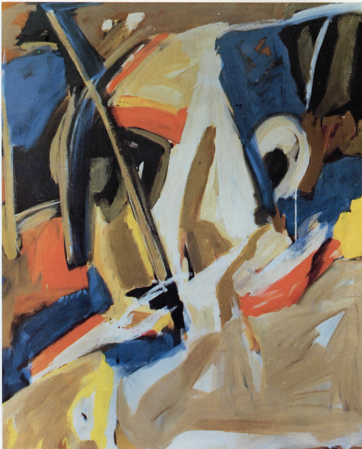
7. „Светлиот зрак“