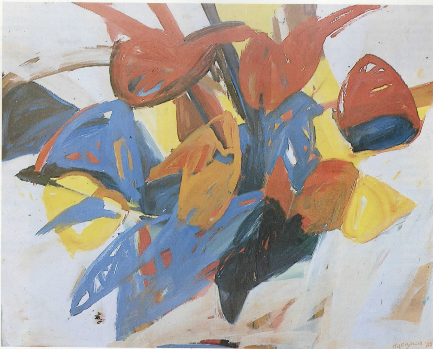
23. „Звучни асоцијацији“