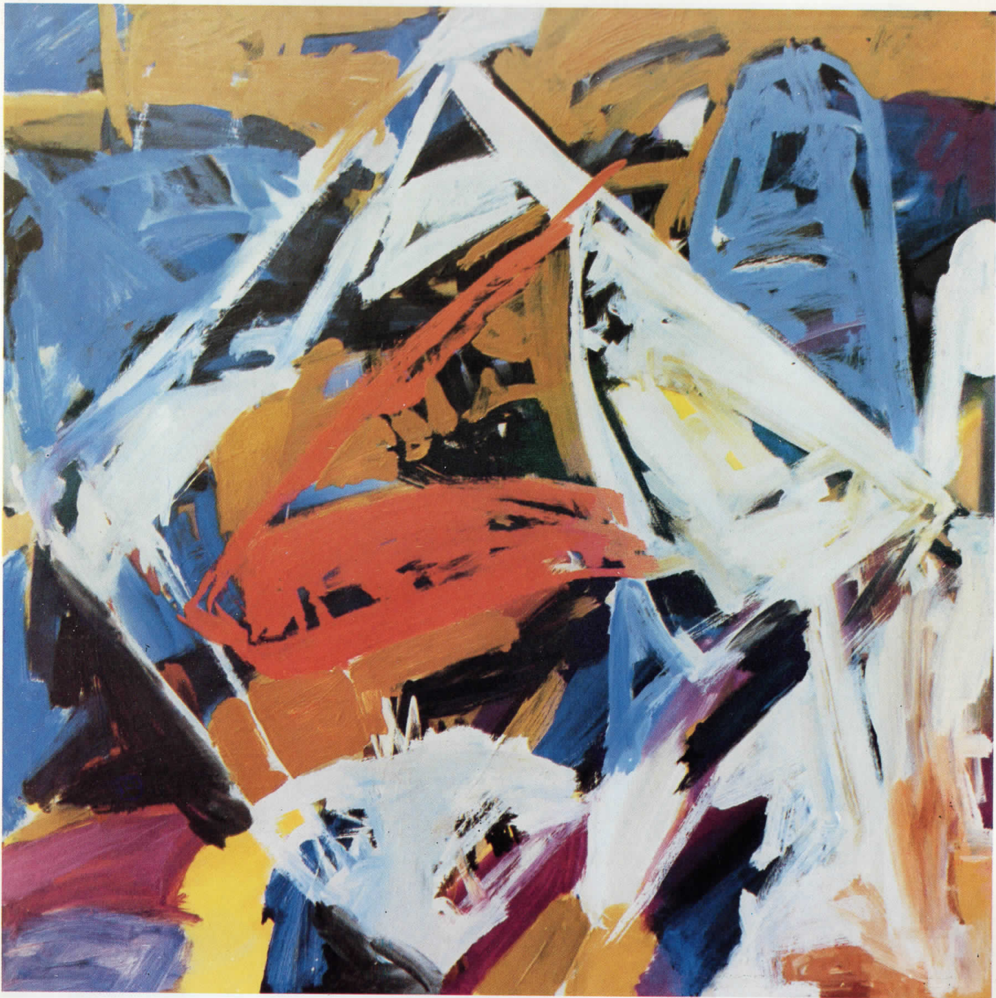
9. „Бели зраци“